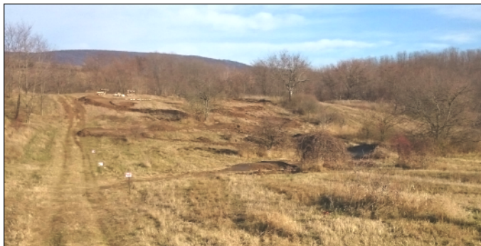
5. kép: A kesztölci bringapálya

bocsátásban vett részt. A fejlesztés finansziális és munka jellegű kihívásait a helyiek saját maguk dobták össze és szervezték meg. A november elején megnyílt ügyességi pálya híre gyorsan szárnyra kapott, mára pedig már Dorog, Piliscsév, Leányvár és Pilisjászfalu fiataljai is amiatt nyaggatják szüleiket, hogy hadd mehessenek el oda ők is „pumpálni”. Jóllehet az alkotók elsősorban cross-country (angol rövidítéssel élve: XC) jellegűre tervezték a pályát, találni ott bőven pumpálni való dombokat. A bejárat koordinátái: 47.705598, 18.788491