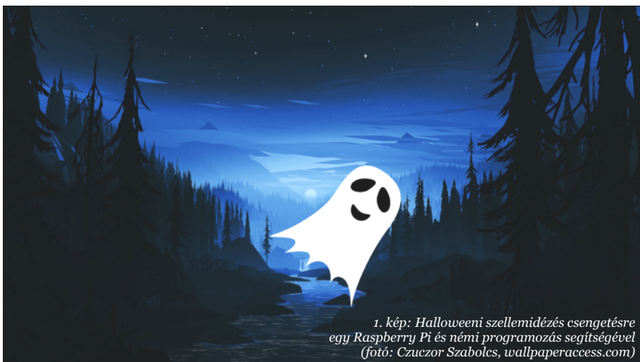
1. kép: Halloweeni szellemidézés esengetésre egy Raspberry Pi és némi programozás segítségével