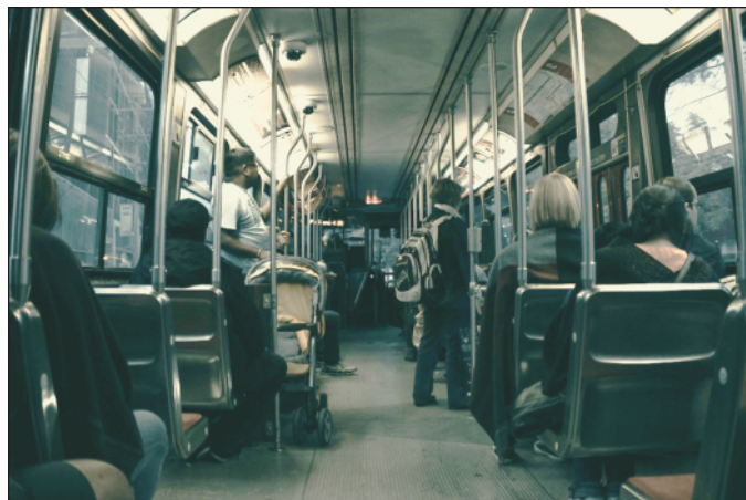
4. kép: Hajnali buszozás

Mi van ma? Kílátástalanság! Lassan kihál az emberekből a jövőbe vetett hit, az emberszeretet, pedig mindig fő vezérfonalnak számított a hit, remény, szeretet. A régi lakásokban fő helyen, falvédőkön hímezett betűkkel lakás díszként szerepeltek. Nem akarok én most okosabb lenni a pápánál, regélni dicshimnuszokat, csupán feltárni oly' gondolatokat, melyek életünket, mindannyiunk életét metelyezi ma meg, és ezek miatt van a rohanás, idegesség embertársainkkal való törődés elhanyagolása. Mondd! Minek is mondom neked mindezeket? Kít érdekelnek ezek ma? Mondanám inkább azt, törődjön ezzel más, talán az illetékesek? Óh, ha lenne az! Most, amikor kora reggelenként busszal utazom Budapestre, még a tinnyi templom toronyórája nem ütötte el az 5 órát, csak a fertályt (háromnegyedet), a busz tömve munkába indulókkal és látom az utasok, mosolygós, álmos és szomorú arcát, volt elég időm arra, hogy végig elemezzem, mit érezhetnek. Idősebbek, álmosan, fáradtan, gondterhelten a busz ringatására hamar álomba merülnek, néha még le sem tudnak ülni férőhely hiányában.