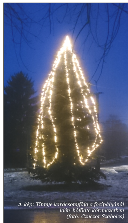
2. kép: Tinnye karácsonyfája a foci pályánál idén hófödte környezetben

Köszönjük azoknak a tinnyi lakosoknak, akik 1000 és 2000 Ft-os ismétlődő hozzájárulásukkal továbbra is kitartóan támogatják a Körtvélyes megjelenését. 😊