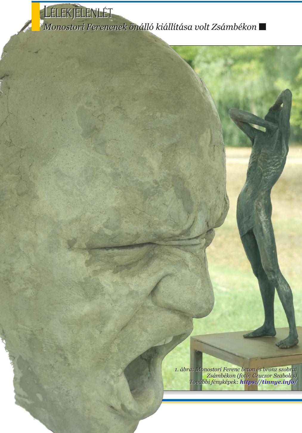
1. ábra: Monostori Ferenc beton és bronz szobrai Zsámbékon (fotó: Czuczor Szabolcs) További fényképek: https://tinnye.info/

Monostori Ferencnek önálló kiállítása volt Zsámbékon ■