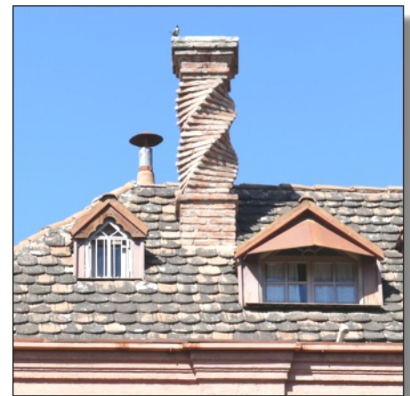
4. kép: Csoportos kéményellenőrzés idején másodsorra is

Várjuk azoknak a helyi vállalkozásoknak a jelentkezését, akik szeptember 14-én nem tudtak részt venni a szervezett kéményellenőrzés első körében, de októberben (vagy az év hátra lévő részében) ezt szívesen bepótolnák. Szerkesztőségünk elérhetőségeinek bármelyikén fogadjuk a jelentkezők megkeresését.