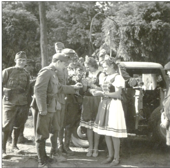
5. kép: Híradós katonák és helybéli leányok a Károlyi-kastély parkjának bejárata előtt a magyar csapatok bevonulása idején

Abban az időben sokat jártam le a Tisza partra, az ártéren a védő fűzfákat nyestük meg, a letermelt fának a fele a miénk lett. Ez biztosította a téli tüzelőt, a másik fele a gátőré, ágfa rőzséit gúzsba kötve a töltésen árvédelmi célra használták. Ahogy ott szorgoskodtunk a Tisza árterén, sajnálattal néztük, amint esőben, sárban, fagyos őszi reggelen a rabok kötéllel vontatták a nehéz gályát (fadereglyét), kezüket-lábukat véresre