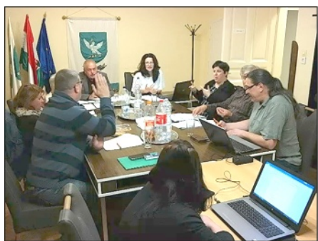
3. kép: Ülésznek a tinnyei képviselő-testület

Amikor új lapszám megjelentetését tervezem, igyekszem széles körben felhívni rá a falubeliek figyelmét, hogy akinek a lakossággal megosztani kívánt információja van, az a Körtvélyes hasábjain ezt megtehesse. Azon már nem csodálkozom, hogy erre a felhívásomra az önkormányzati hivatalból rendre nem kapok visszajelzést, mintha nem is létezne az újság. Ez bizonyára azért van, mert „a Facebook ereje” még a képviselők többsége által elfogadott SZMSZ-nél is hatalmasabb, így többek közt a szeptemberi képviselő-testületi ülés meghívója is csak itt jelenhetett meg cirka 500 követő számára, illetve a tinnye.hu egy eldugott szegletében. Pedig volt téma bőven: a képviselő-testület tagjai bő 6 órán keresztül, 16 napirendi pont témájában tanácskoztak, sokszor kifejezetten ingerült szócsaták közepette többek közt az alábbiakról: