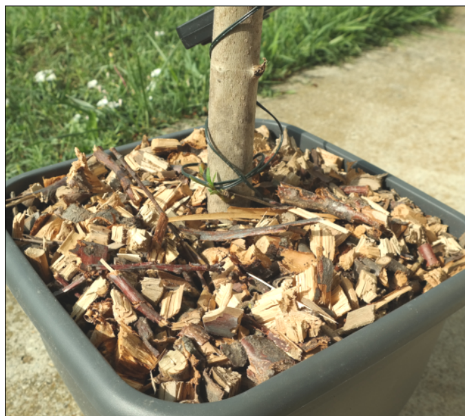
8. kép: Lemetszett ágak aprítékából készített mulcs ültetett növény tövében (fotó: Czuczor Szabolcs)

választjuk. Mi végül a dobkéses modell mellett döntöttünk. Az eredmény szerintem magáért beszél: