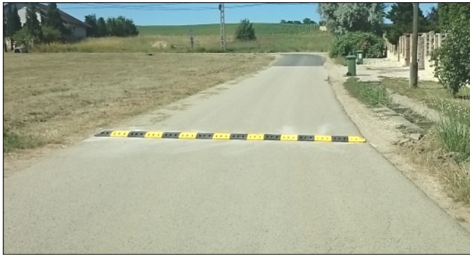
4. kép: Új építésű fekvőrendőr a Mária utcában

Június utolsó hetében várható néhány mellékutca fekvőrendőrökkel való felszerelése, így az azokon áthaladó nagy sebességű átmenő forgalom mérséklődhet majd. (Július 6-án a telepítés el is kezdődött. – szerk.)