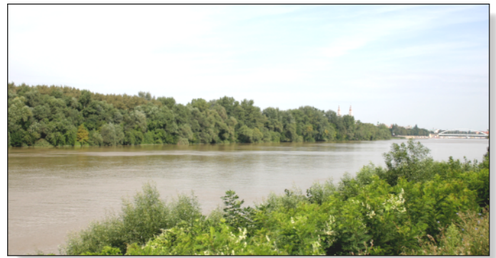
1. kép: Boszorkánysziget

Szegény Édesanyám azonnal kezéből eldobta a hagymakaparót és rohant oda. Szoknyáját felkapta, bele a derékig érő vízbe, Miskát hajánál fogva kimentette a hideg vízből, hasra fordította, kirázta belőle a vizet, megnyugodott, hogy ezt a fürdést Miska élve megúsza. Azok az időszakok a család részére még nehezebbek voltak a többinél is, talán mert Apám katona volt, épp úgy, mint idősebb testvéreim. Anyámnak és nekünk kellett a sok jószággal, a kisebb gyermekekkel, földműveléssel elboldogulnunk. Azért mégis elboldogultunk, megvolt a létbiztonság, volt mire alapozni, ismertük az emberszeretetet, munkanélküliség nem volt, a munka kötelező volt mindenki számára. Aki nem dolgozott, börtönbe is kerülhetett. ■