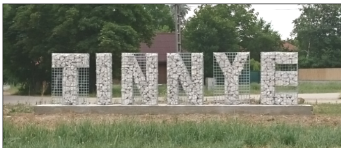
3. kép: Gabionból készült felirat Tinnye únyj végén