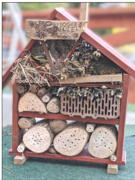
6. kép: Házi készítésű rovarhotel Tinnyén

Az igazság valószínűleg az arany középut lesz, ahol a kecske (méh, bogár, madár) is jóllakik és a káposzta (tisza udvar, rendes ház) is megmarad. ■