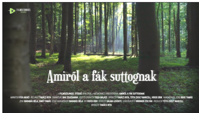
9. kép: Az Amiről a fák suttognak c. film posztere

A magyar produkció után pár nappal egy brit dokumentumfilm is megjelent az online médiában, ami ugyancsak a természet ember általi elnyomását vette górcső alá. Pontosab-