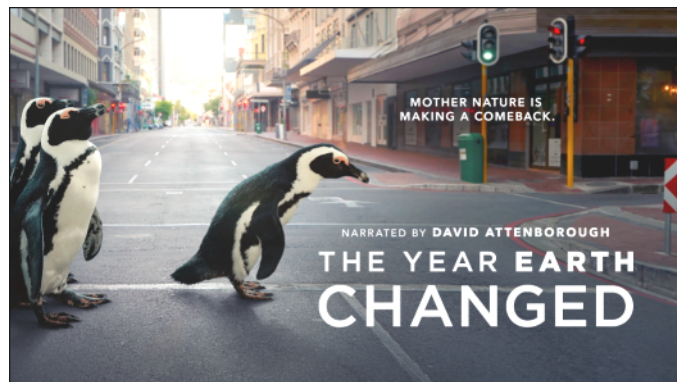
10. kép: Az év, amikor a Föld megváltozott c. film posztere

Subjektív véleményem, hogy mindkét filmet oktatási anyagként kellene terjeszteni országosan vagy akár világszerte. A minőségi ismeretterjesztés eredményeként mindegyik esetben az a tanulság vonható le, hogy mennyire komoly és káros hatással van az emberi tevékenység az őt körülvevő természetre. És hogy valójában mennyire keveset kellene csak tennünk azért, hogy ezzel a tevékenységünkkel ne száguldjunk a saját vesztünkbe, hanem megtanuljunk együtt élni azzal, amibe történelmünk hajnalán beleszülethettünk. ■