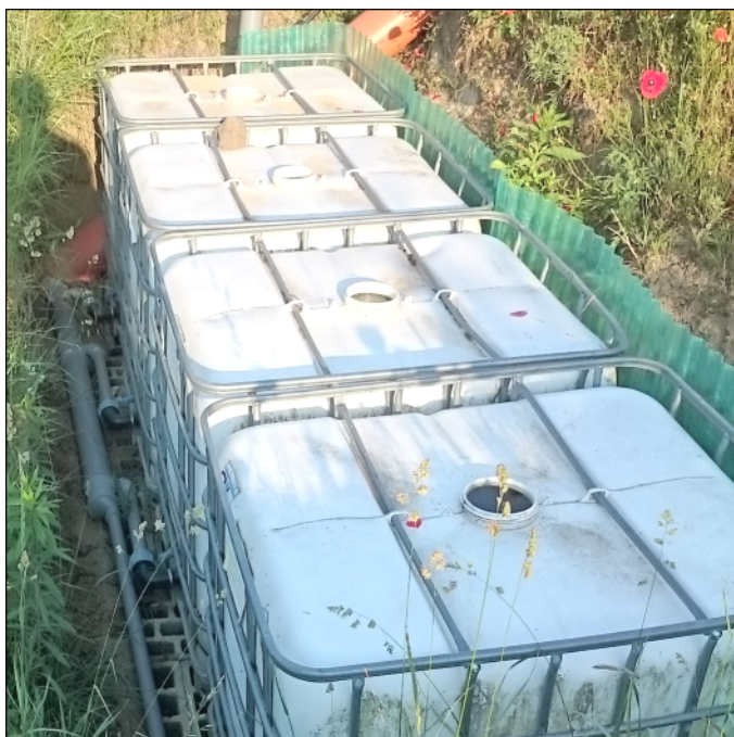
7. kép: Esővízgyűjtő ciszterna PVC csövekkel és KPE idomokkal összekötött IBC tartályokból

Nem fogok „kertelni”, nem vagyok egy kertész lélek. De azokat a racionális ötleteket, amik megragadják a fantáziámat és továbbadásra érdemesnek tartok, tovább is adom. Feleségemnek újabban a kertészkedés lett a hobbjaja, amiből azért jó pár teendő nekem is kijut. Ilyenek azok a fizikai munkák, amihez alkatilag ideálisabb alany vagyok nála, pl. ásás vagy favágás, illetve ami műszaki előkészületeket igényel, pl. jóárasított locsolás. Ugyanis fűrt kút híján, de annál nagyobb takarékoságra való törekvéssel, esővízgyűjtő ciszternából locsolunk. A ház összesen kb. 120 négyzetméternyi tetőfelületén összegyűlő esővizet jelenleg bő 7 köbméternyi tároló őrzi és ez heteken belül újabb 4 köbméterrel fog bővülni. Természetesen egy egész udvar locsolására ez is csak szűkösen lenne elegendő, de ahogy azt a méhlegelőről szóló cikkben is érezni lehetett, nem is szándékunk puha pázsitot nevelni, beérjük a némiképp szárazabb vadvirágos réttel is.