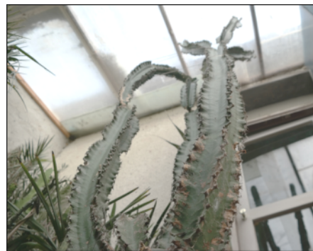
5. kép: Ember magasságú kaktusz

– Nyolcadikos koromban volt egy nagyobb akváriumom, amiben guppikat tenyésztettem. Egy kisöreg pedig mindig jött és átvett tőlem párat, vagy éppen én vittem át neki őket Perbálra. És az ő udvarának a sarkában volt egy kis sziklakert, ami tele volt kaktusszal, ebből pedig mindig adott nekem néhány kisebb hajtást. Szegény biztos nem él már, de áldom a kezét, hogy annak idején belevitt ebbe a dologba. Biztos örülne, ha tudná, hogy ma már több mint 2000 fajta kaktuszt nevelgetek az ő hatására.