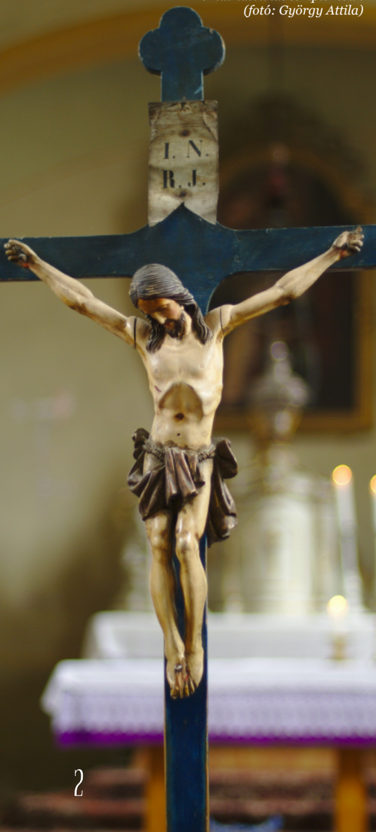
2. kép: Feszület a tinnyei Szent Anna római katolikus templomban

Csőndesedjünk el, figyeljünk az igazi, lelki célokra! Legyünk jobbak, tegyük jobbá a környezetünket! ■