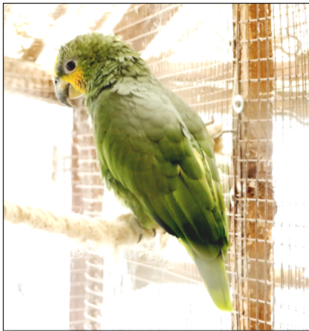
4. kép: Amazon papagáj

– Igen, van kettő olyanom, ami kézzel nevelt, így ők tudhattak, esetleg most is tudnának beszélni, de őket is igyekszem visszavádatni. Ahhoz ugyanis, hogy tenyészmadarad legyen, ahhoz vad madár kell. Ha pedig egy madár szelíd, azaz házi kedvenc, az téged tekint a párjának, így nem költ.