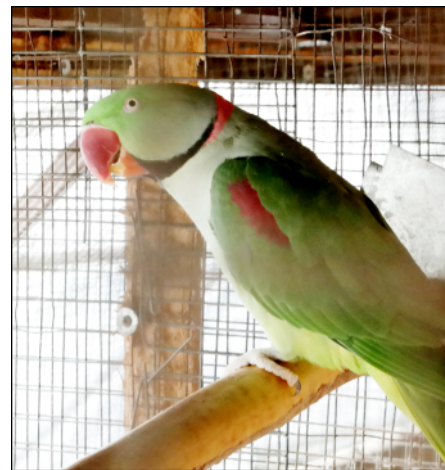
3. kép: A kifejezetten hangos nagy sándorpapagáj

már egyre kevesebb az időm rá, itt van ugyanis kb. 6000 cserép növényem, 130 db papagájom, velük pedig foglalkozni kell.