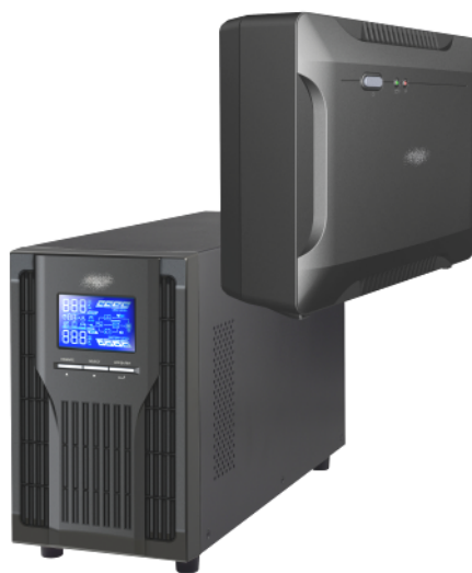
10. kép: Szünetmentes tápegységek a belépő kategória felsőbb és alsóbb szegmenséből. Balra egy nagyobb teljesítményű online készülék látható több akkumulátorral, nagyobb áthidalási idővel, tiszta szinuszos kimenettel, LCD kijelzővel, összetett beállítási lehetőséggel, számítógépes kapcsolattal. Jobbra egy kisebb teljesítményű offline készülék látható, egyetlen akkumulátorral, közelített szinuszos kimenettel, egyszerű kezelhetőséggel, LED-es jelzőfényjel, fakra szerelhető kivitelben.

Visszatérve az áramszünet okozta gazdasági károokra: az informatikai adatvesztés, hangszórók kipukkanása, elektromos vezérlésű kazán tönkremenetele, fűtés kimaradása stb. ellen érdemes szünetmentes tápegységgel (angolul Uninterruptible Power Supply , röviden UPS ) védekezni. Ez egy olyan készülék, amit a szünetmentesíteni szándékolt fogyasztónk (számítógép, hűtő, kazán stb.) és a hálózati dugaszoló aljzat közé illesztünk, a fogyasztó tehát onnantól kezdve ezen keresztül kapja az