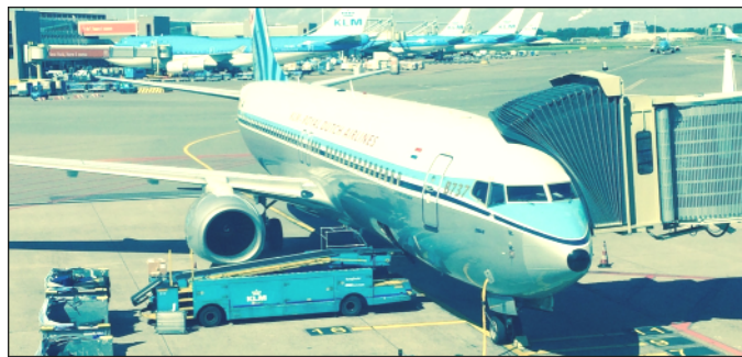
6. kép: Repülőgép az amszterdami repülőtéren

A sok finomsággal, annak ellenére, hogy már jóval éjfél után volt, jól megvacsoráztam, utána aludtam hajnalig. Kényelmes volt a szobám, kétágyas, fürdővel és teljes alsónemű csere lehetőséggel. Reggel korán felkeltem, megfürödtem és ismét lementem az önkiszolgáló étterembe és friss finomságokkal kényeztettem el magam, sok jó falatot ettem, déligyümölcsöket és egyebeket is raktam a tálcámra, péksütemények, kávé, tea, dinnye felszeletelve, sütemények, mindentől bőségesen volt. A reggelizés közben észrevettem, hogy a mellettem lévő asztalnál két színes bőrű rendőr hölgy reggelizik, és igen csak figyelnek engem, ami fölöttébb idegesített. Aranyosak voltak, mégis féltek tőlem. Mit