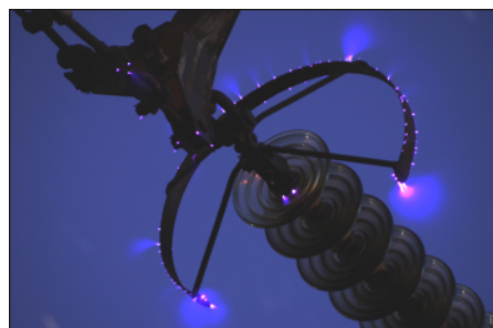
9. kép: Koronakisülés egy nagyfeszültségű távvezetéken

Figyelem! Téli kirándulásaink alkalmával maradjunk távol a hó- vagy zúzvara fódte nagyfeszültségű távvezetésektől. A téli hidegben ridegebbé váló és valamelyest összébb zsugorodó fém vezeték és tartó szerkezetük a rájuk rakódó csapadéktól nagyobb terhelésnek vannak kitéve, így nagyobb eséllyel törhetnek el vagy szakadhatnak le. Az éjszakai sötétben láthatóvá és hallhatóbbá váló koronakisüléseket is csak kellő távolságból figyeljük, soha ne álljunk a vezeték alá!