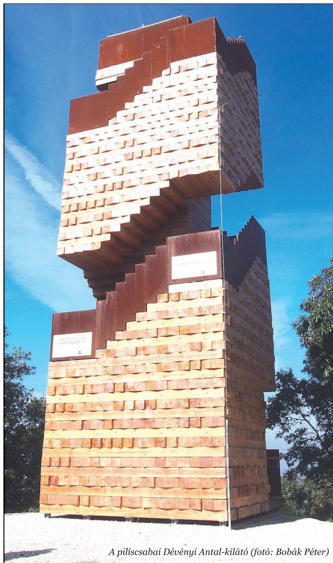
A piliscsabai Dévényi Antal-kilátó