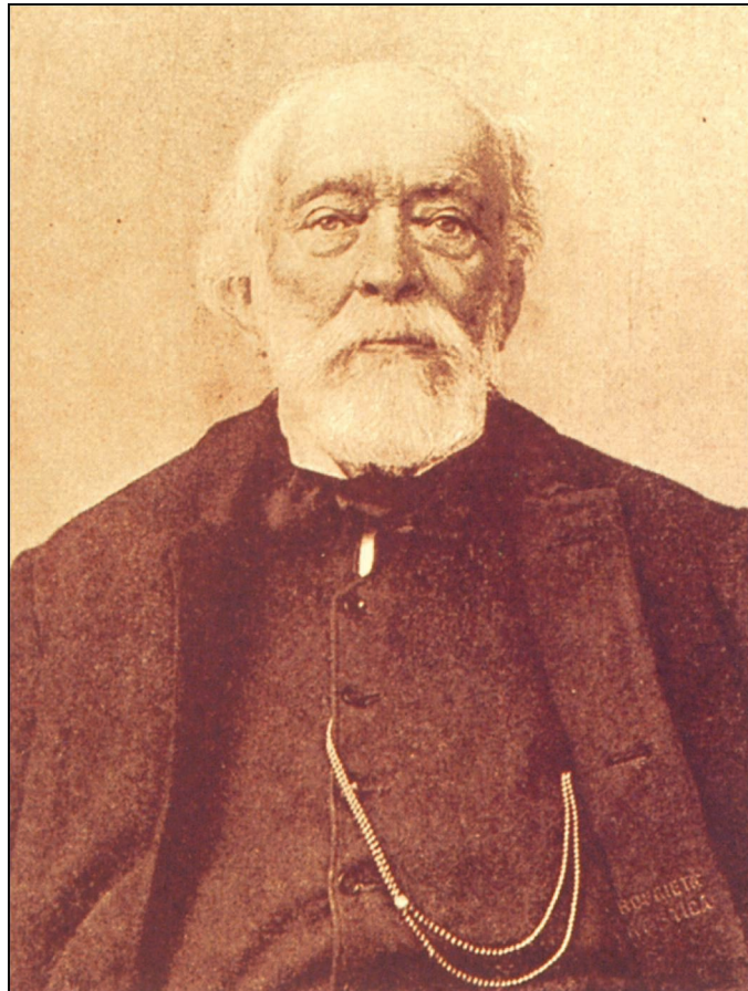
Kossuth arcképe a felvétel készítésének idejéből