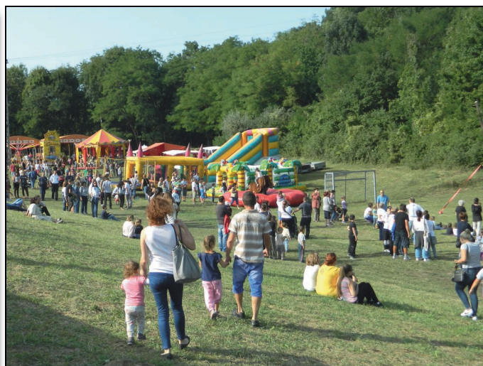
Sokan kilátogattak augusztus 20-án a Garancsi-tóhoz