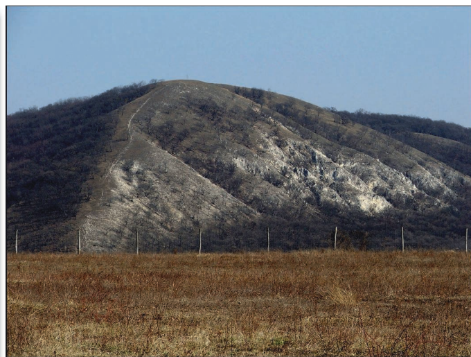
A Meszes-hegy