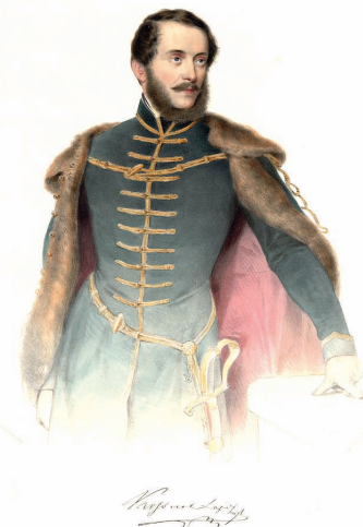
Kossuth Lajost ábrázoló színezett litográfia (1848., Prinzhofer-Rauh, forrás: wikipedia.org)

Kossuth Lajos (Monok, 1802. szeptember 19. – Torino, 1894. március 20.) magyar államférfi, a Batthyány-kormány pénzügyminisztere, a Honvédelmi Bizottmány elnöke, Magyarország kormányzó-elnöke. A nemzeti függetlenségért, a rendi kiváltságok felszámolásáért s a polgári szabadságjogok biztosításáért vívott 19. századi küzdelem egyik legnagyobb alakja, a magyar szabadságharc szellemi vezére. Mái egyike azoknak, akik a magyar nép emlékezetében leginkább megtestesítik az 1848–49-es forradalmat és szabadságharcot, Széchenyivel és Petőfivel együtt. Kossuth 1842-46-ig élt Tinnyén, most szeptemberben lenne 215 éves.