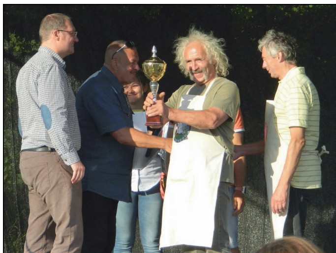
A főzőversenyt a „Fáradt kakasok” csapata nyerte