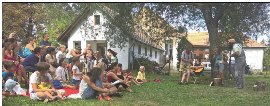
Gyere haza, Mikkamakka! (a T.a.T. Színtársulat előadása)