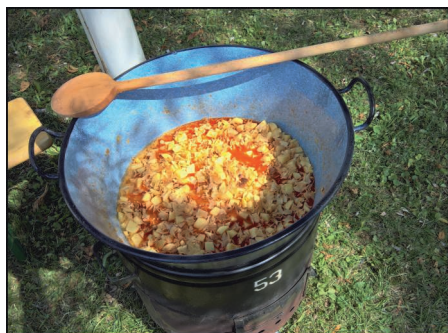
„Szuszog” már a slambuc...

A TTK és helyi művészek augusztus 19-én a református gyülekezet Bocskai utcai iskolájának kertjében egyfajta kulturális találkozót szerveztek az érdeklődőknek. A tinnyei képviselő-testület a rendezvényt a tinnyei Szent István napi rendezvénysorozat részének, így önkormányzati eseménynek tekintette és vállalta annak költségeit.