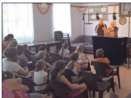
Grim/m/aszkok (a Figurina előadása)