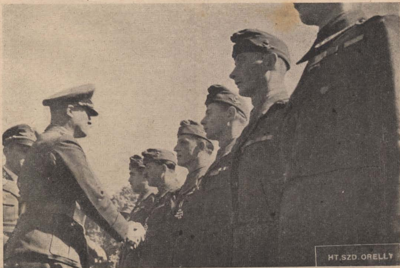
Honvéd segítség az ukránoknak.