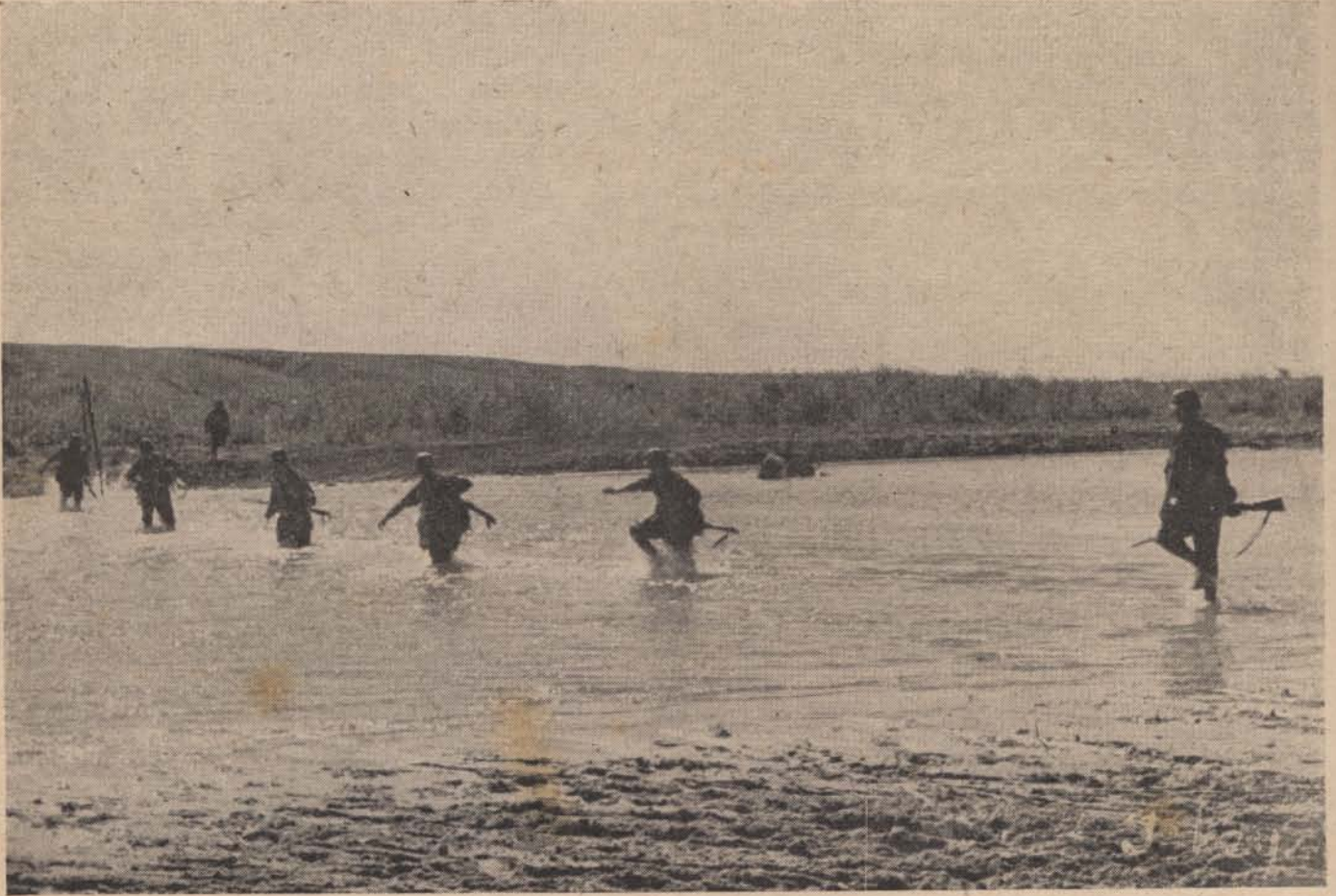
A partizánok rejtékelye felé...