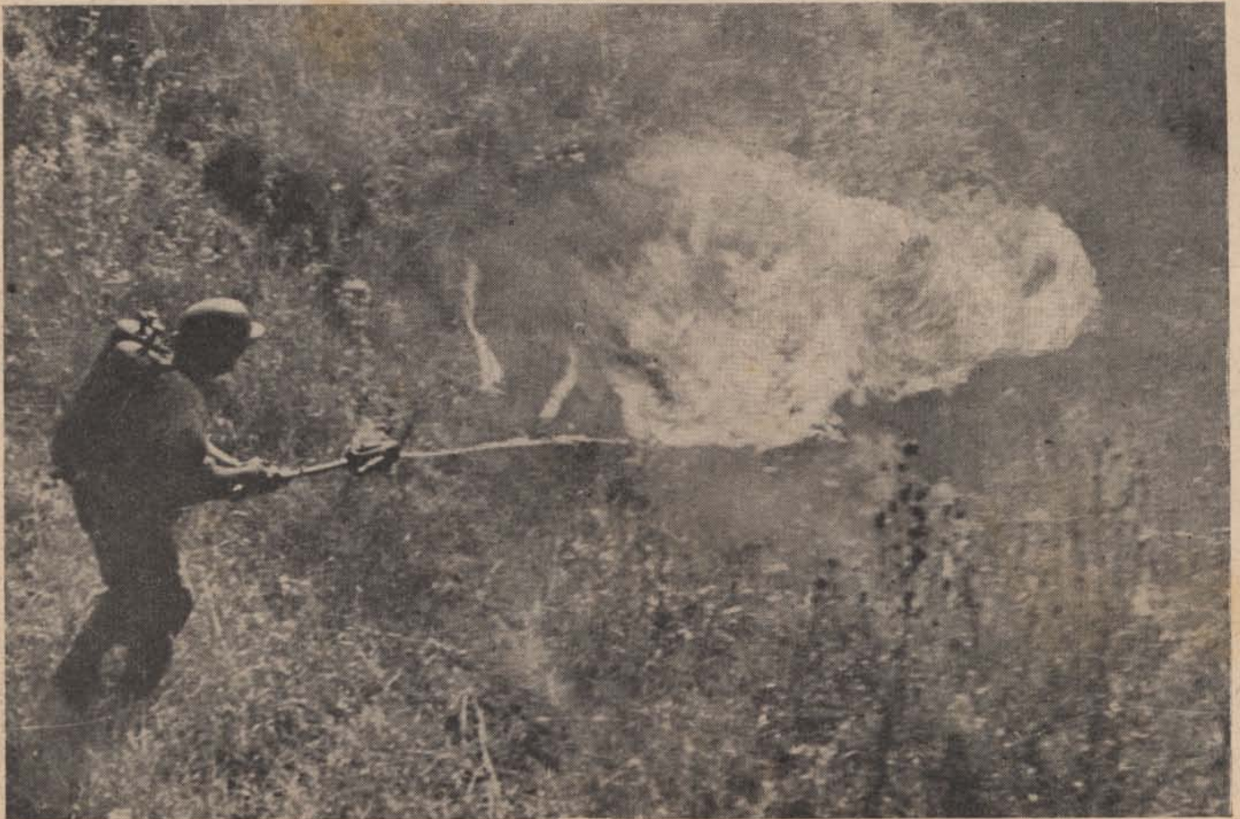
Munkában a lángszóró.