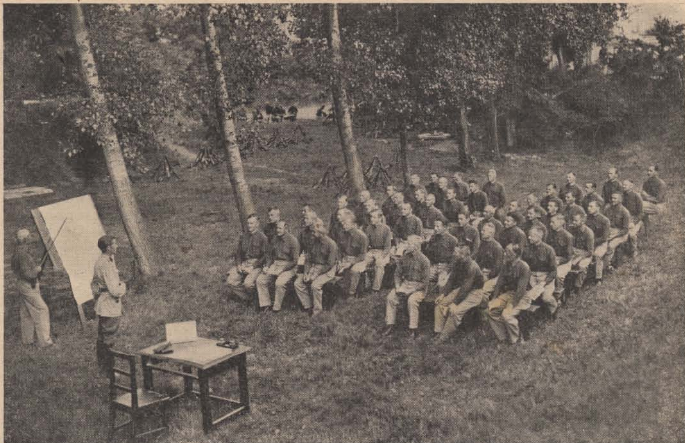
Oktatás a szabadban.