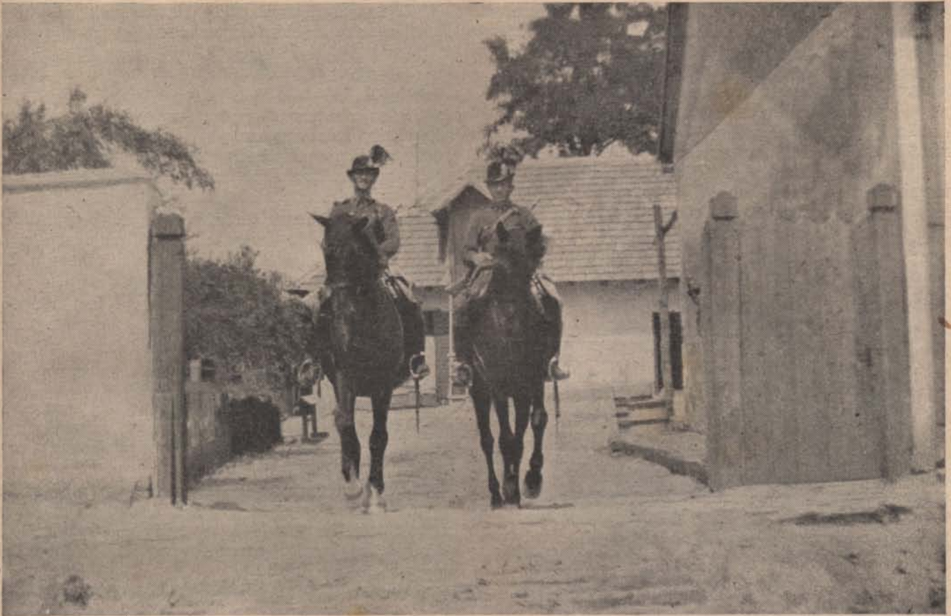
Indul a járőr.