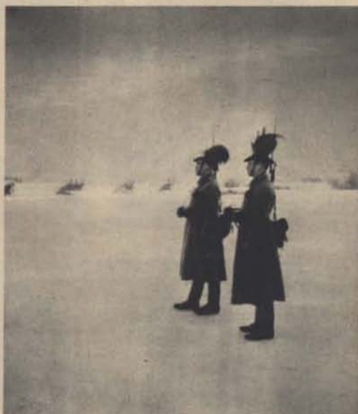
Tóth K. g. zts.