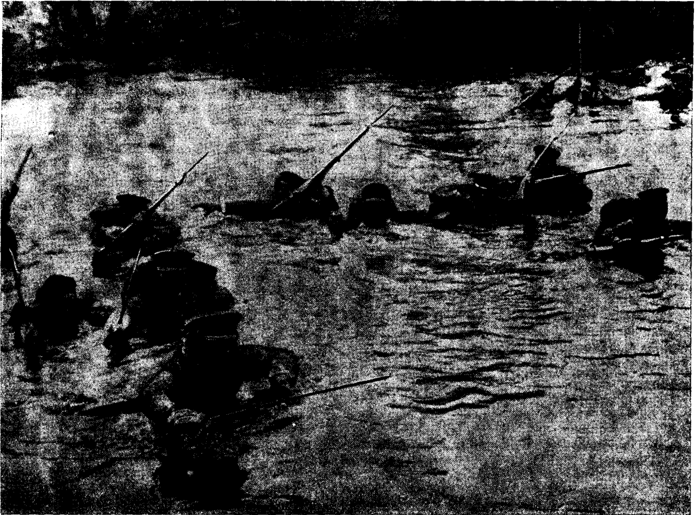
A japánok úszva kelnek át Singapore szigetére.

háborút, de ez más, mint az eddigi csetepatéi voltak. Amerikának nincs katonai multja, ezt csak most szerzi meg magának a jövőre s ha minden iskolában drága az első lecke, a háborúban a legdrágább.