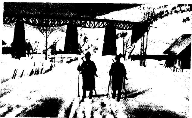
Bagoly I. thts.