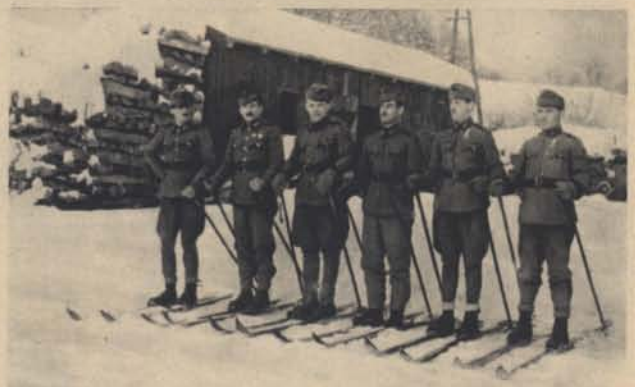
Sasvári I. I. cső.