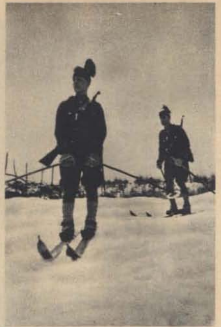
Lengyel I. őrm.