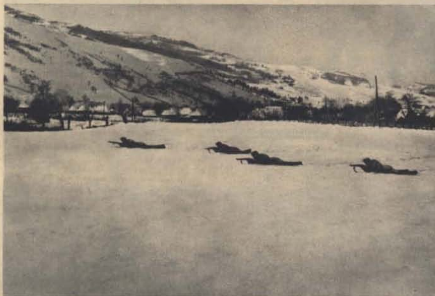
Bagoly I. thtts.