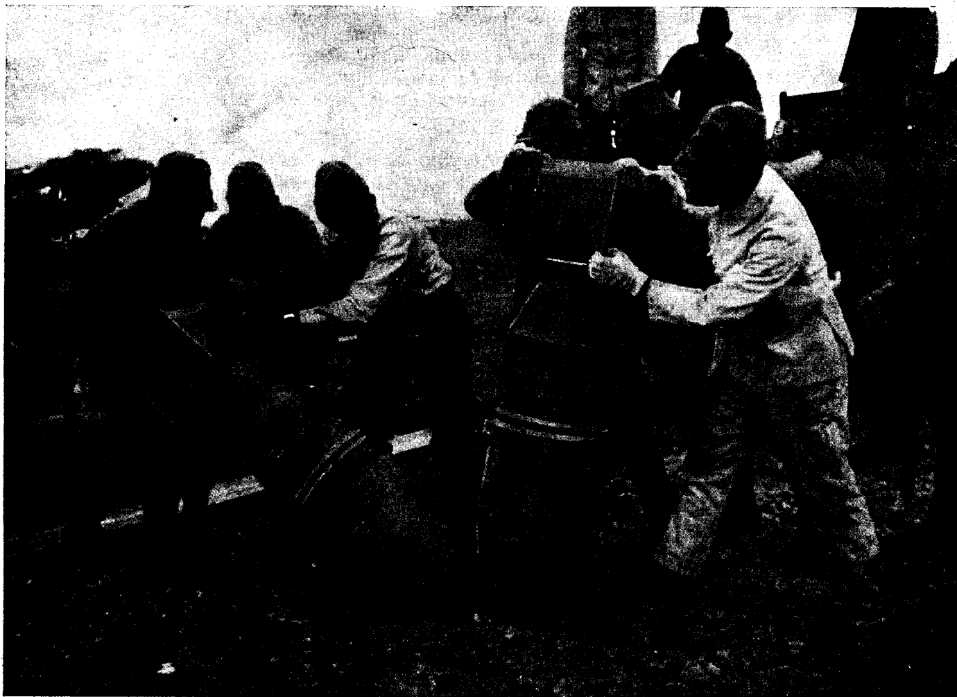
Japán repülők előkészítik a repülő-bombákat.

szeme, — amint végignézttem rajtuk, — mint a csillag, s bizony nem cseréltem volna egyikönnnyen senkivel sem.