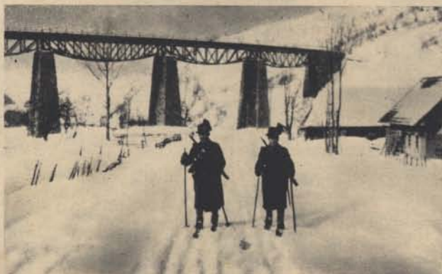
Bagoly I. thts.