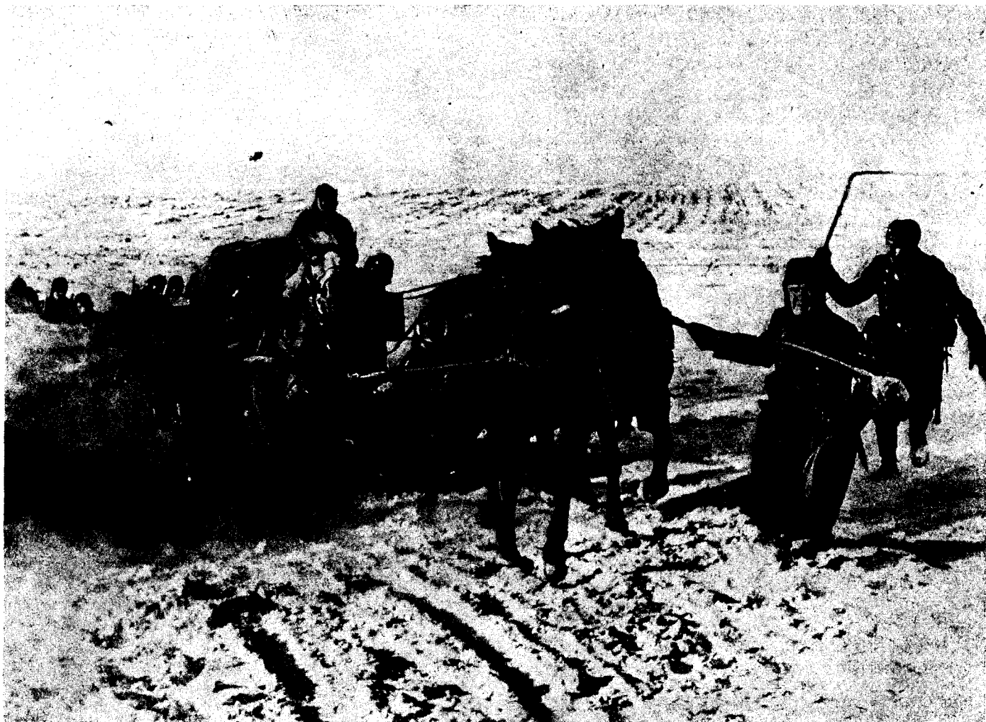
Kép a keleti hadszíntérről: Az utánpótlás óriási nehézségek között, — de jól működik.

sön volt beosztva. Egy 1918 őszi forradalmi fosztogató, aki ellen szolgálatilag fellépett, 1919 május 29-én, ablakon keresztül, orozva agyonlőtte.