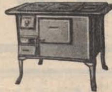
Fa vagy hazai barnaszéntüzelésre

SZOBÁJÁBAN Lampart - Celus kétaknás folytonégó hazai barnaszéntüzeléses szobakályhát. KÉNYELMES RÉSZLETFIZETÉS! KÉRJEN DIJTALAN PROSPEKTUST. Lampart Gyártmányok eladása Kft. BUDAPEST, VII., ERZSÉBET-KÖRÚT 19.