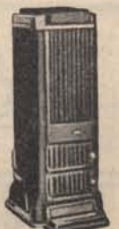
A lakásfűtésnél nagy üzemanyag megtakarítás.

SZOBÁJÁBAN Lampart - Celus kétaknás folytonégó hazai barnaszéntüzeléses szobakályhát. KÉNYELMES RÉSZLETFIZETÉS! KÉRJEN DIJTALAN PROSPEKTUST. Lampart Gyártmányok eladása Kft. BUDAPEST, VII., ERZSÉBET-KÖRÚT 19.