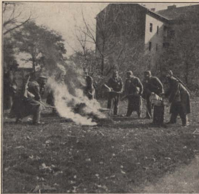
Légvédelmi gyakorlat az őrsparancsnok iskolában.