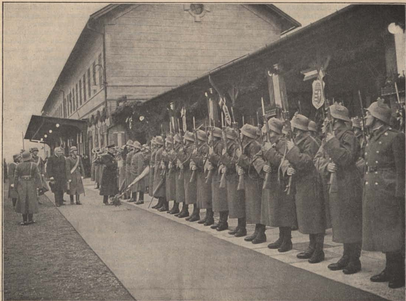
A kassai honvéd repülőakadémia avatási ünnepségéről. A Kormányzó Úr Ó Főméltósága fogadtatása a kassai pályaudvaron.