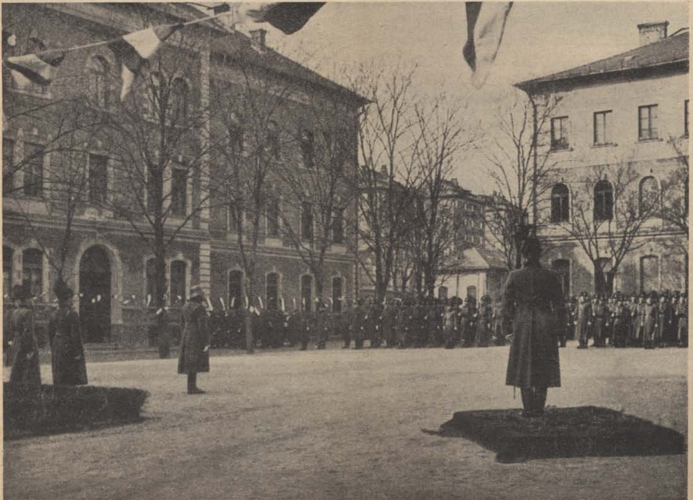
A csendőrnapról: vitéz Damasy Farkas ezredes, kerületi parancsnok ünnepi beszédet mond.

Ezer magyar esztendő öröme, bánata világra szóló hőstett kapcsolt össze bennünket az Anyaországához még vissza nem tért véreinkkel. Ez pedig olyan szoros kapocs, amit erőszakkal ideig-óráig lehet bénítani, de a viszontlátás történelmi kényszerűségének útját örökre lezárni nem lehet.