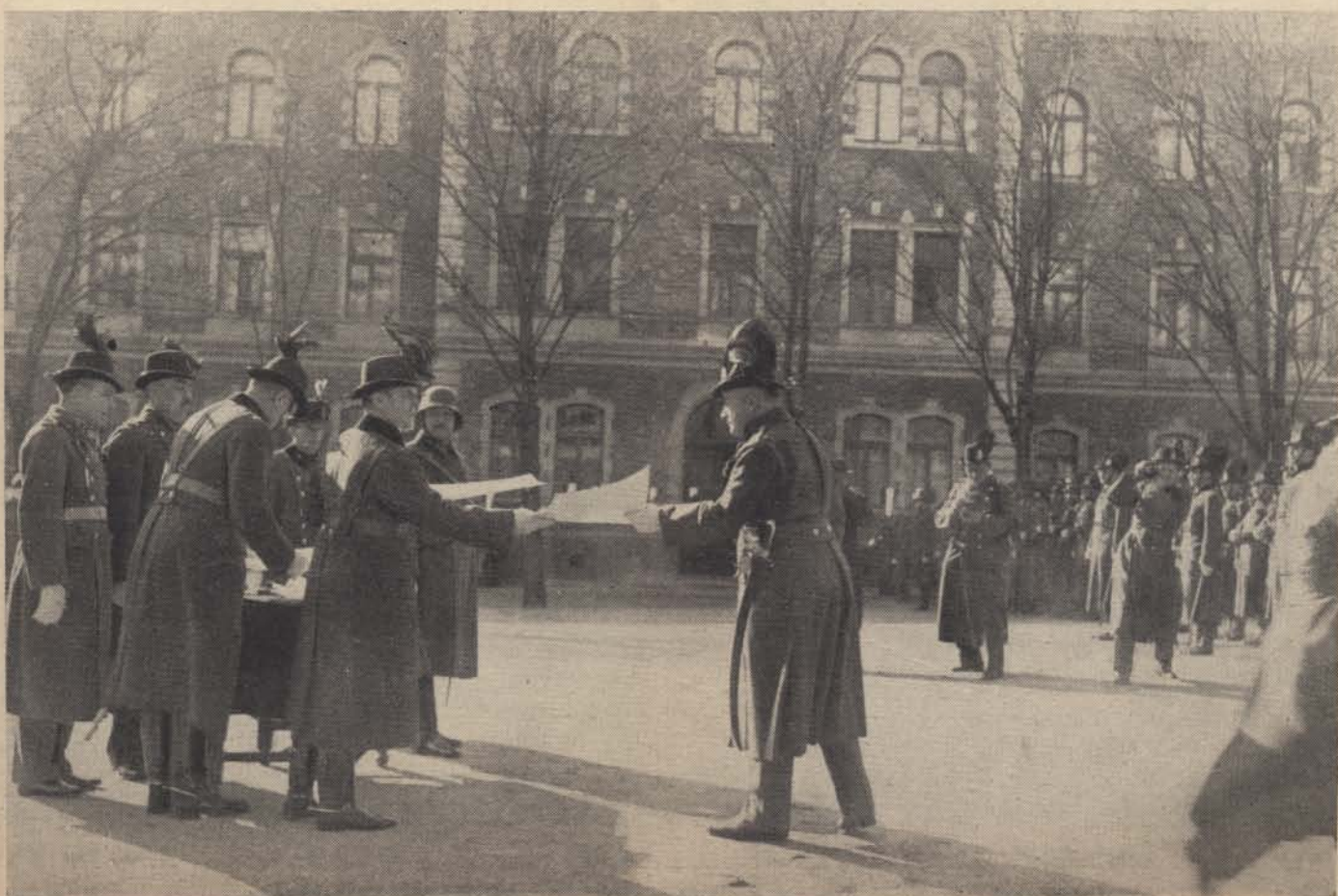
A csendőrnapról: Kiosztják a dícsérő okiratokat.