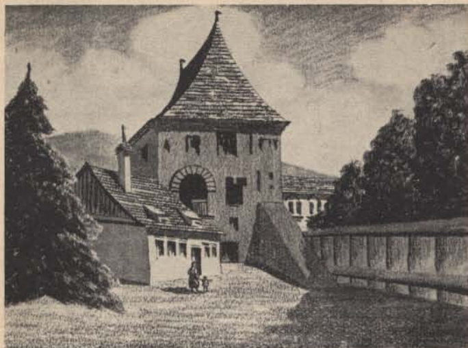
Emlékezzünk! Kolozsvár, Bethlen-bástya.

állította, hogy az orvvadász a kerítésen beugrott, 40 lépésre két embervastagságú cserfa áll. Az egyik az út mellett, a másik pedig, mivel az út ott kanyarodik, majdnem az út közepén és Réz azt állította, hogy a két fa mellett állt az a két ember, akinek ő oda köszönt. Oda mentünk a fához és amikor 20 lépésre megközelítettük, Réz hirtelen megállt és azt mondta, hogy most is ott áll az a két ember. Amikor odaértünk, megnyugodott, hogy nem emberek, hanem két cserfa.