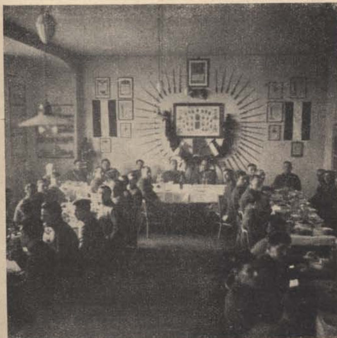
Csendőrnapról. Bajtársi ebéd Ungváron.

Emelem poharamat Magyarország Kormányzója, Ó Főméltósága, nagybányai vitéz Horthy Miklós és hazánk nagyjai