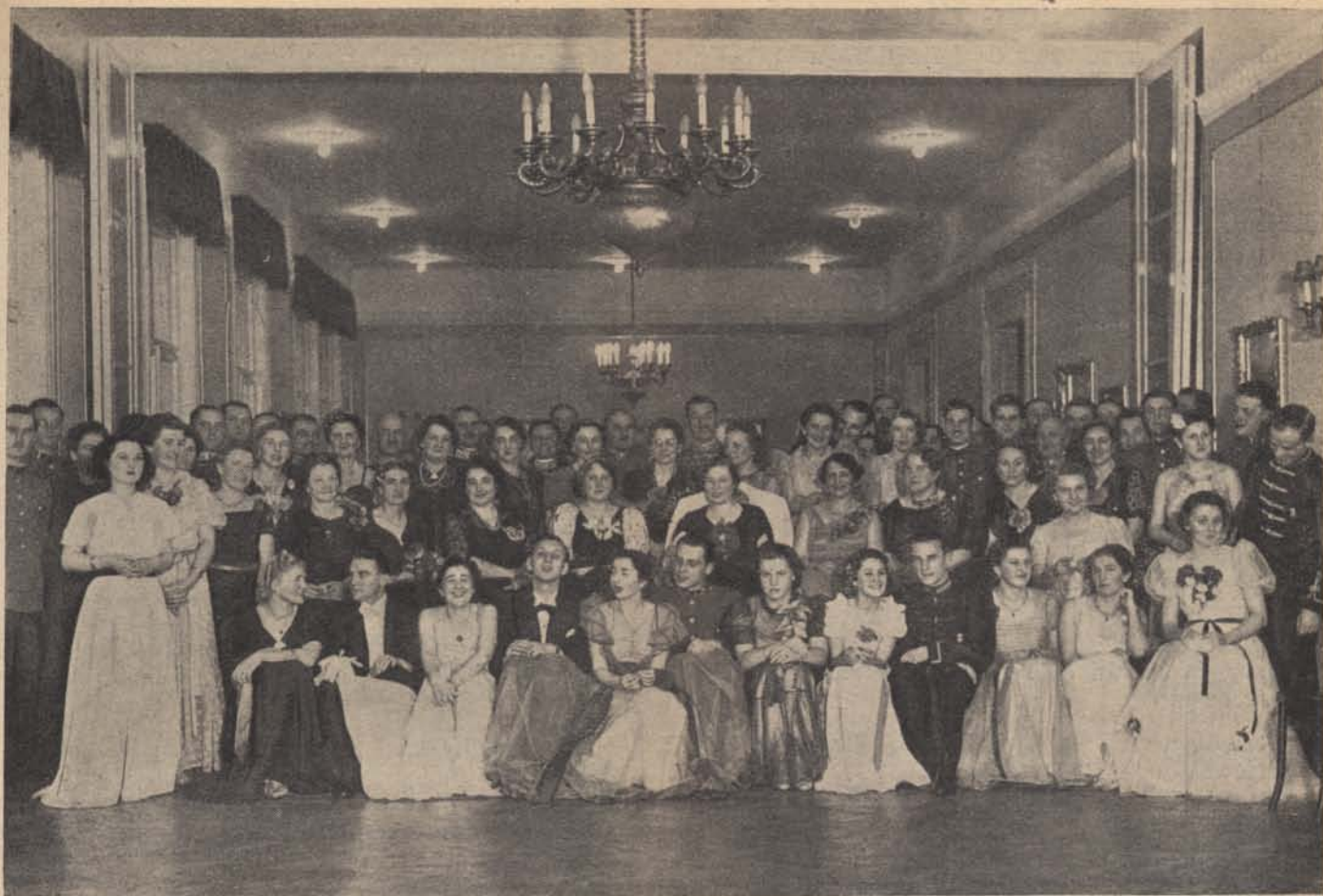
A budapesti csendőrtiszti kar február 18-i táncestélyéről.