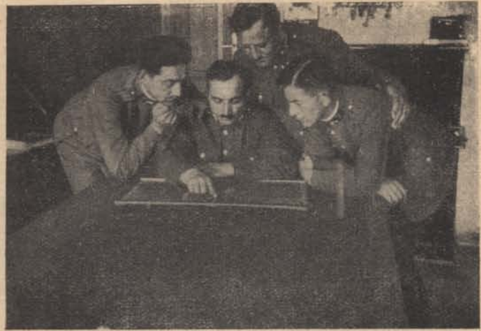
Mi került vissza?...

A vámospéresi örs egyik tagjától arról értesültünk, hogy egyes vámospéresi egyének bemondása