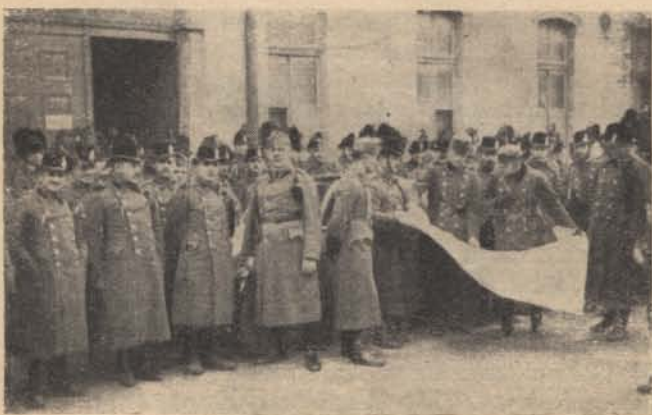
Megbeszélés indulás előtt.