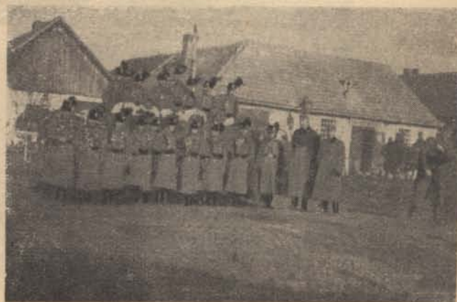
és bélyi őrsük legénysége.