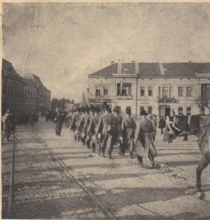
Húsz év után újra Kassán.

helyet kapott-e, arról nincs hírünk, de erősen nem hiszünk benne. Az meg egészen bizonyos, hogy Scotus Viator szobra nekünk magyaroknak éppen nem kell.