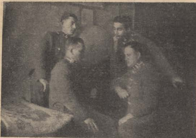
Közvetítés innen is — onnan is...

beregszászi legény mondotta, mikor honvédeink bevonultak. Aztán csak nézte őket a legény megkövülve, valami bémült megszállottsággal, míg egyszerre visszazárlt belé az élet, és ő is belerikkantott a tömeg zúgásába: Mindent vissza!