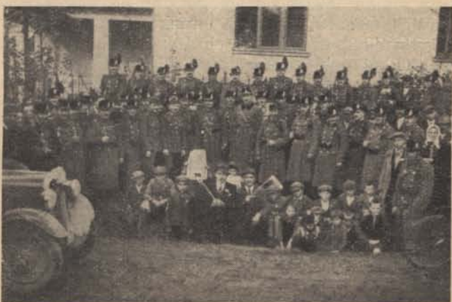
A Dunaszerdahelyre bevonult csendőrszázad.