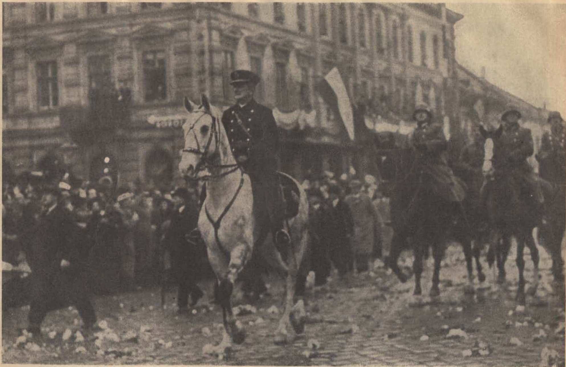
A Kormányzó Úr ő Főméltósága bevonul Kassára 1938 november 11-én.