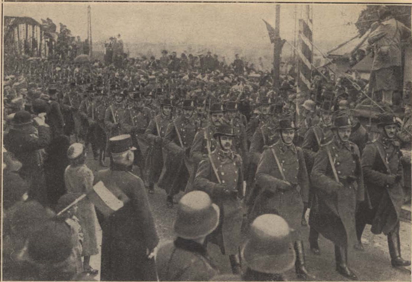
Csendőreink bevonulnak Komáromba.