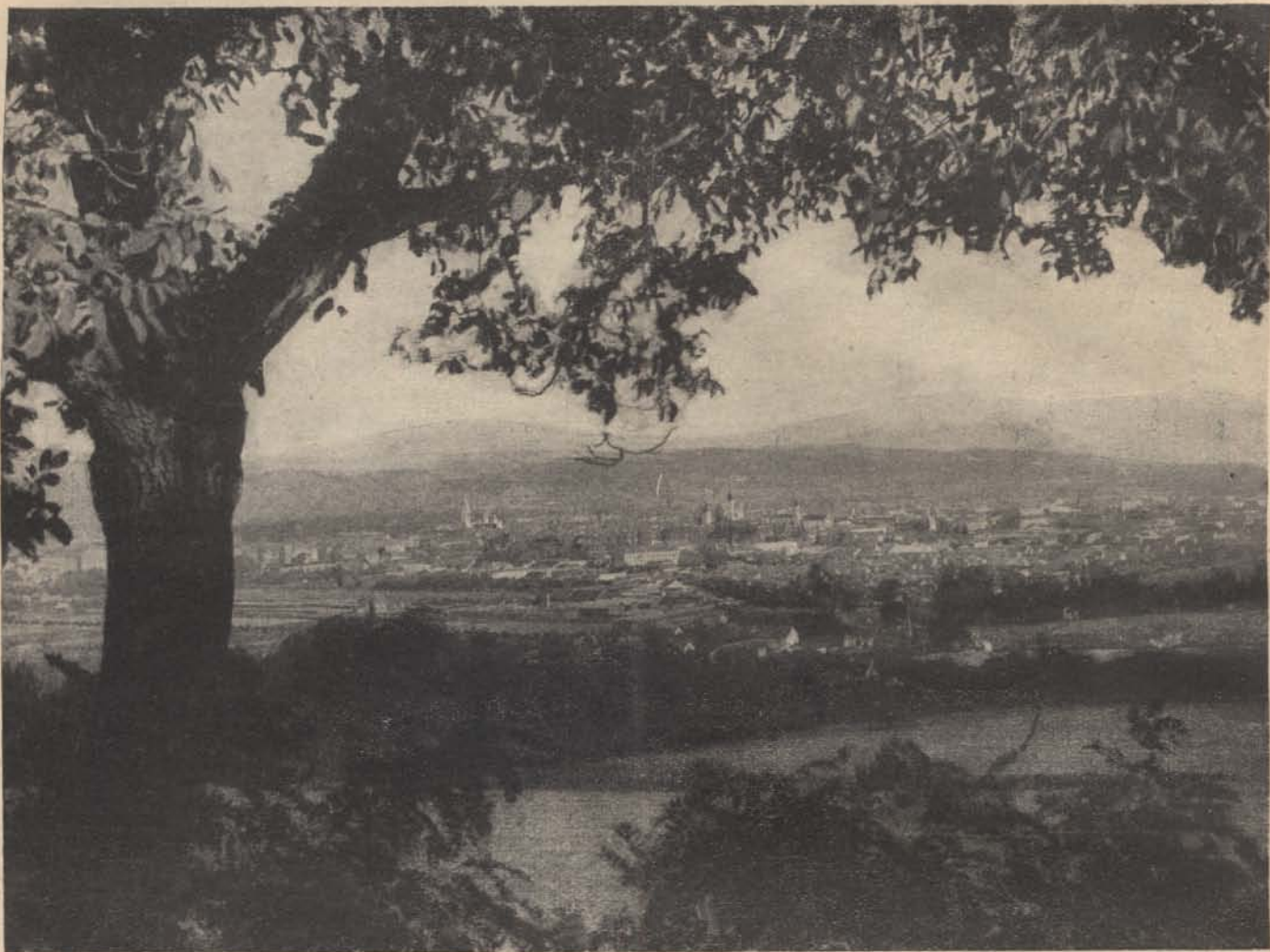
Felvidékünk gyöngye: Kassa.

részben a csehek által újonnan építettek. Mikor egyik ilyen új épület kulcsait nekem átadták, a küldöttség vezetője ezeket mondta: