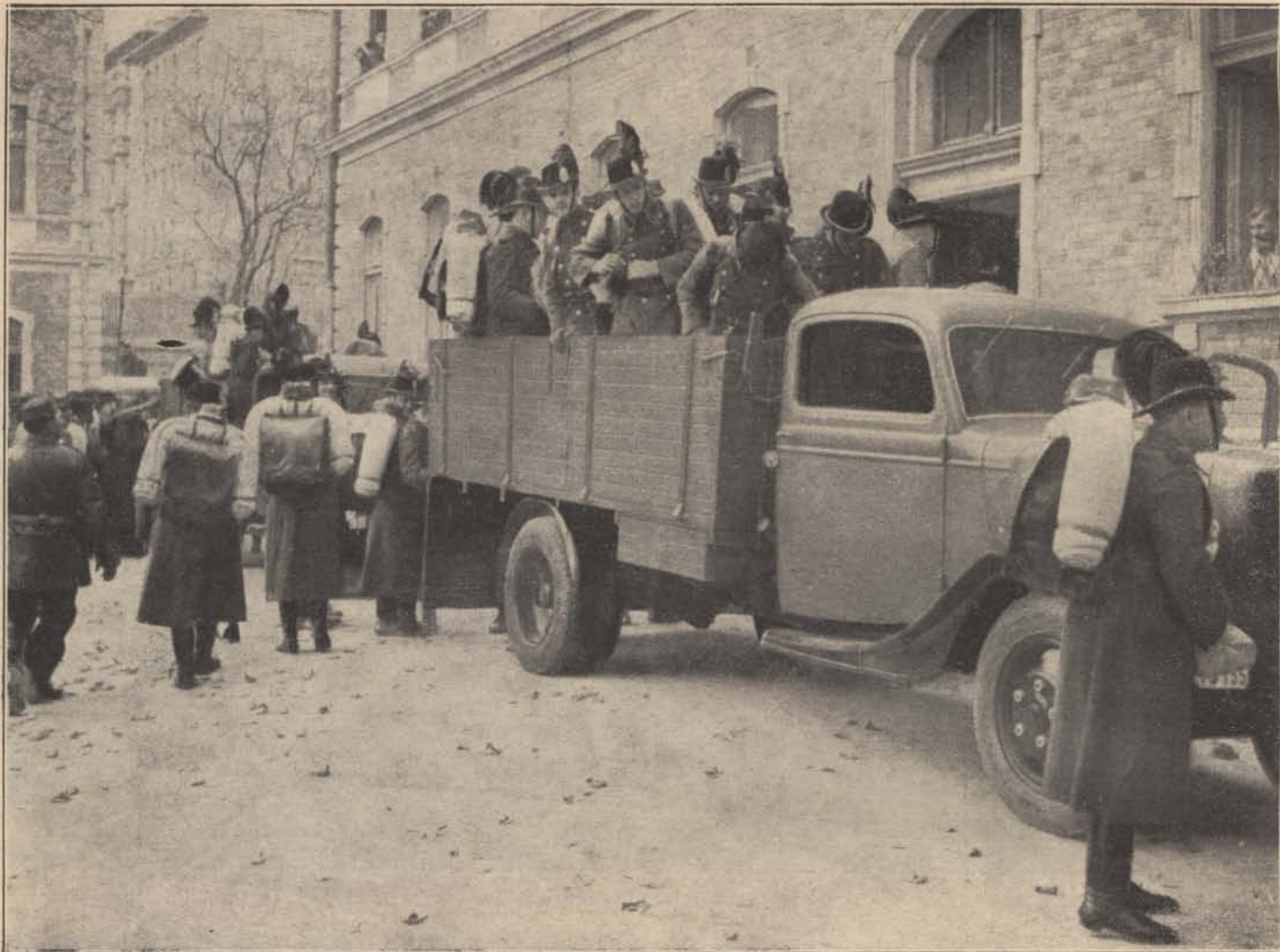
Teherautókon indul a Felvidékre kerülő csendőrszázad.

Hidasnémetinél léptük át a trianoni határt. Az előző nap ledöntött cseh határoszloptól pár lépésre, az országút vasbetonból készített tankesapdái kényeszerítették gépkocsinkat lassú kanyargásra. Közben volt időnk jól megfigyelni az út mindkét oldalán épült első erődív vasbeton építményeit. Hiába őrizték Prága nyugtalan lelkiismeretének lidércnyomásos álmait!