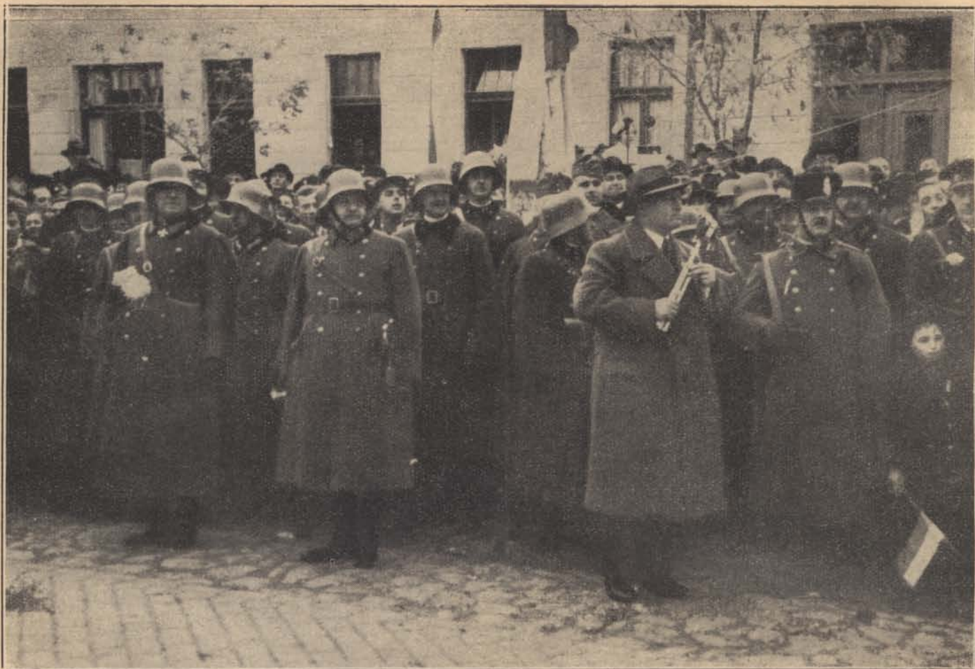
A honvédség párkányi bevonulásánál már ott van a magyar csendőr.

Visszatérünk még a tudósításokra, összegyűjtjük azokat, amint mondtuk: a történelem számára, a testület lapjaira és a csendőr majdanvaló emlékezése végett. De a még továbbiakban beszámolnak majd új őrszeink. Munkával. Ez olyan lesz, mint a magyar csendőr eddigi munkája mindig: fáradhatatlan és a lehető legjobb. Tudjuk, hogy megnövekedett munkaterületünknek ez az új része, igen nagy feladatokat ró vállainkra. A megkínzott magyar községek a mieink. A kifosztott, kizsarolt, gazdasági és kulturális vonatkozásokban elhanyagolt s az utolsó napokban még kirabolt községek a mieink, ahol minden léleknek csak az irántunk való korlátlan bizalma adta meg a fentmaradása alapját, viszont kenyere; semmi vagy alig, panaszja, baja: tenger. Lélek és mosoly, szeretet és áldozatkészség kell ide. Mi mándezt vittük is át testvéreinkhez, azokhoz, akiket magunkhoz ölelni, húsz éven át, mi is szüntelenül vágytunk.