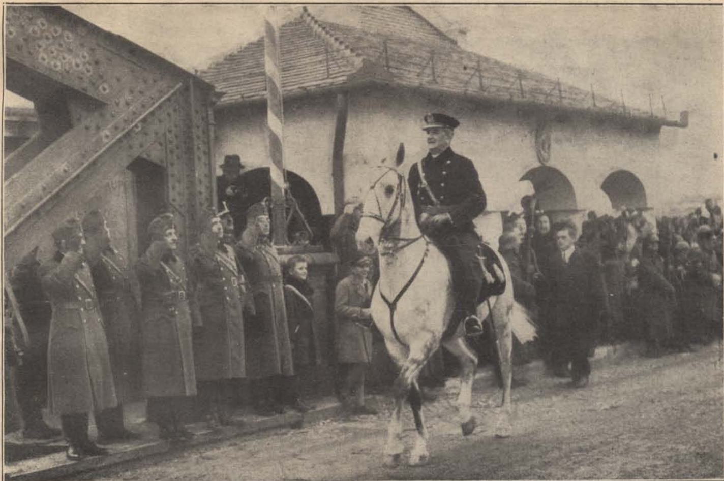
Kormányzó Úr Ő Főméltósága Komáromban 1938 november 6-án

mint a m. kir. csendőrség tulajdonába tartozó bútorok. A laktanya, a csehekre jellemző legnagyobb rendtelenségben volt.