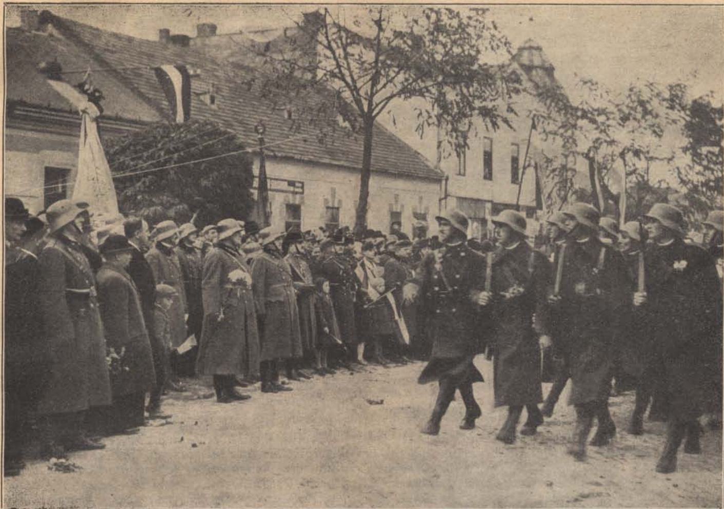
A honvédesapatok bevonulásánál már csendőreink biztosítják a rendet Párkányban.