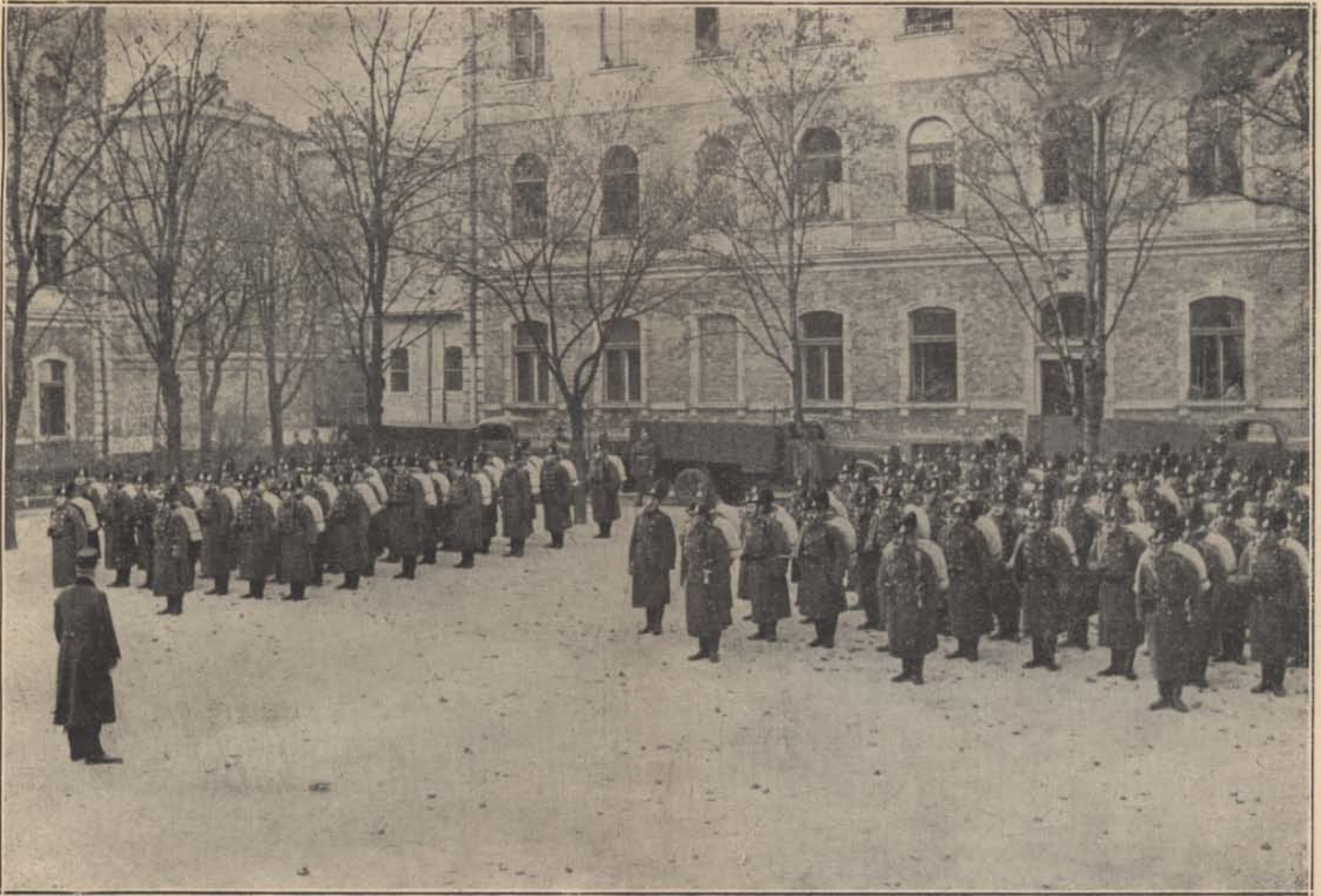
A budapesti kerület paranesnoka búcsúztatja a Felvidékre induló legénységet.

és szempillantás alatt virággal borítják el őket, símogatják ruhájukat.