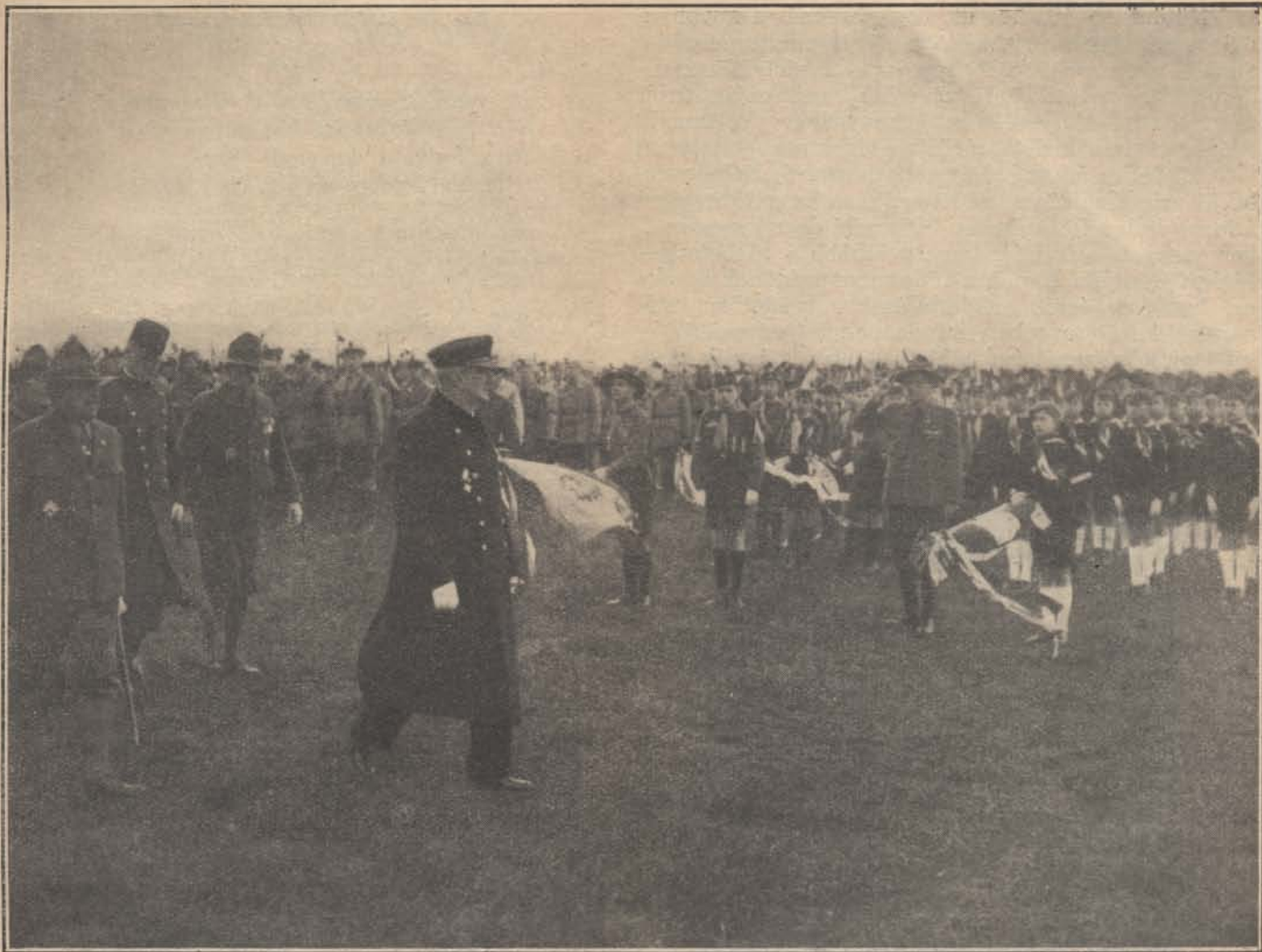
A 25 éves jubileumát ünneplő magyar cserkészet országos díszszemléje a Kormányzó Úr Ó Főméltósága előtt április 24-én a budaörsi repülőtéren.

Rövidesen nyugtalanság vett erőt a fiatalemberen, amely olyan nagyfokú volt, hogy ágyából felkelt, de aztán hamar elesett. Vádlott ügyvédje azt a kijelentést tette, hogy a halálos koponyaüri vérzést a fiatalember akkor szenvedte el, amikor az ágyból felkelve, elesett. A tárgyalást vezető bíró kérdésére, hogy lehetséges-e ez, azt feleltem, hogy a halálhoz vezető koponyaüri vérzés már akkor egy idő óta tartott, az a nyugtalanság pedig, amely a sérültet az ágyból való felkelésre készítette, nem volt más, mint a koponyaüri nyomás következtében beálló izgalmi szaknak az egyik kifejezője, tehát megvolt a koponyaüri vérzés akkor, amikor a sérült az ágyból felkelt. Csakhamar aztán beállott az öntudatlanság, — az anyja vallomása szerint — s így kijelentésemet mindenben igazoltnak láttam. A bíróság ezt el is fogadta.