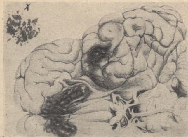
Régi agyrázkódás és zúzódás nyoma: a bal sarokban fent vérkristályok görcsövi képe.

nek az alsó, illetve hátsó része; szabadszemmel nézve az agyzúzódás kék vagy lila, rendszerint csoportosan egymás mellett fekvő puha területek, amelyek tűszúrásnyiak, rajzszegfejniyek. Ha ezek a sérülések nem vezetnek a sérült halálához, akkor ezeket a zúzott területeket, mint sárga foltokat megtalálhatjuk egy későbbi boncolásnál is, amennyiben a vérfesték ott helyben megfestette az agy állományát. Lásd az 1. sz. ábrát.