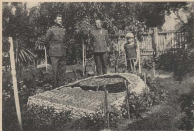
A tápiósápi őrskertjéből.

Rendületlenül hinni tudó szívem azonban nem csüggedt el. A gúnyos vicceket némán tűrtem. Ma- gamban büszke öntudatot éreztem — és lelki sze-