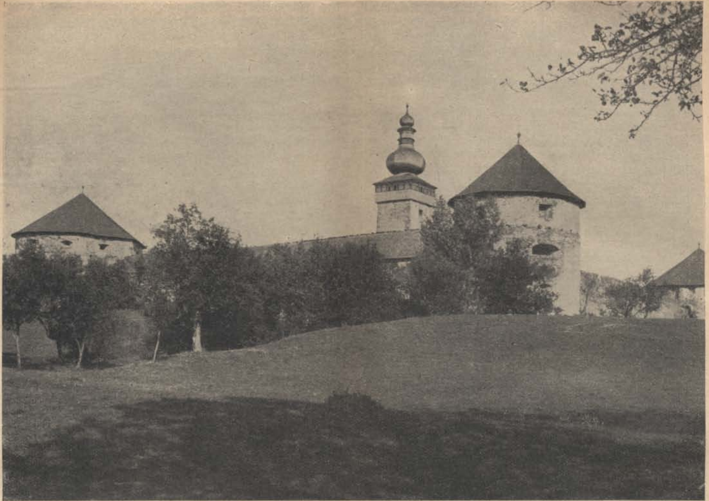
Amit vissza kell szerezniük: Bozók.

sével nagy lépéssel haladhatnánk előre a közlekedésrendészeti szolgálat terén. A kerékpárosokat a közlekedési előjáróságok, illetve rendőrkapitányságok fényképes igazolvánnyal látnák el, amelyen a legszükségesebb személyi adatokon kívül a kerékpár gyártmánya és gyártási száma is fel lenne tüntetve. Az igazolványnak a gépjárművezetőkre előírt 3 betétlapot is tartalmaznia kellene. Természetes, hogy az igazolványok bizonyos idő eltelté után új fényképes igazolványra lennének kicserélendők, mely alkalommal a kerékpár üzemi ellenőrzése is foganatosítható lenne. E kérdésbe részletesebben már nem bocsátkozom bele, csak igyekeztem kimutatni, hogy az ilyen igazolványra nem csak a közbiztonság, hanem a kerékpár tulajdonosa érdekében is szükség van. Rendezést igényelne még a kerékpárlámpáknak a kerékpárra való kötelező felszerelése és a prizma kötelező viselése is.