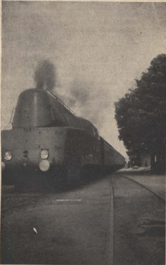
Óránként 130 km.

Dacára annak, hogy az édesapám csak abból tartotta fenn családját, amit két keze munkájával ke-