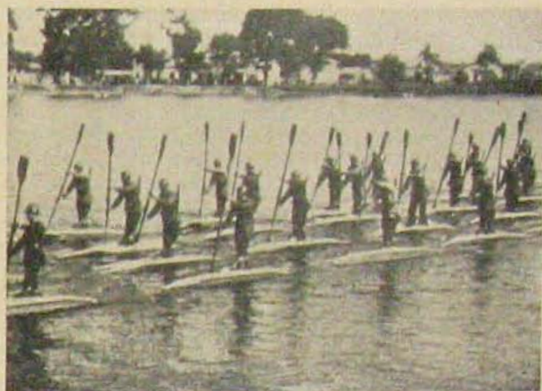
Fegyverben a világ: A románok.

Állásharc vagy mozgóháború? — e kérdés felett vitakoztak hosszú ideig a harcászok a világháború után. A tűzhatás és a technika miatt merevültek állásokká és földalatti erődítményekké az arcvonalak és újra a technikához kellett folyamodni, hogy ebből kiutat találjanak. A harckocsik első szereplése a világháborúban 1916-ban a Somme-menti csatákra esik, ahol arra használták őket, hogy az élő harcosokkal szemben bevehetetlennek látszó tereperődítéseken törjenek keresztül. Páncélozott testű gépkocsik ezek, becsükből néhány kezelővel, közepes és nehéz géppus-