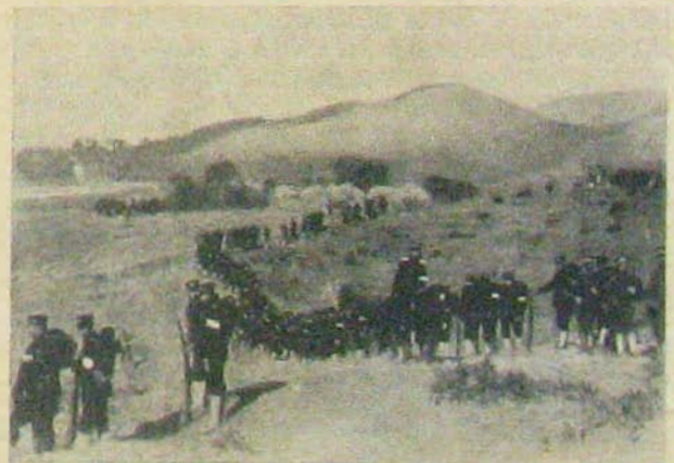
Fegyverben a világ: Kína.

Látható ebből a kevés példából is, hogy minden technikai újítás dacára, az emberi erő szerepe ma sem kevesebb, csak változott formában alkalmazkodik az új hadvezetés követelményeire. A máai tényező, a technika viszont sokkal erőteljesebb alakban juttatja érvényre a maga jelentőségét, mint akár még a közelmúltban is. Az újkor háborúja valóban műszak és anyag mérkőzése az ellenfél anyagi és műszaki erejével. Már az egyes harcok felszerelése bonyolult és furfangos eszközök keveréke. Puska, kézigránát, géppuska, — páncél és lövedék — azután kíséző löveg és gyalogsági ágyú, — harckocsi és tankelhárító üteg — lángszórók és gázvetőkészülékek, aknazárak és elektromos védelem berendezkedések csak szemelvények ma már abból a sorozatból, amely a gyalogság harcerejét akarja növelni. A többi fegyvernem más újításokkal vetélkedik. Nehéz és messzehordó erejű tüzérség, elmésnél-elmésőbb célzó és irányzó készülékekkel,