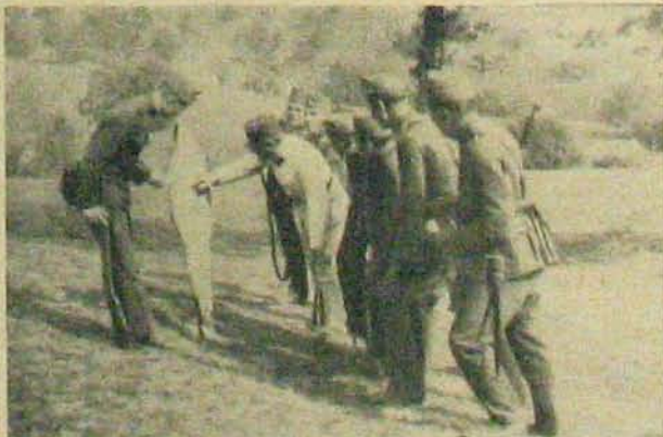
Nézzük, hogyan talál Bandur próbacsendőr?

Az eszközök és módok tökéletesbedését technikai téren itt is bizonytalán várhatjuk.