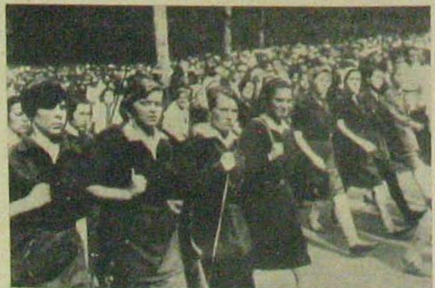
Fegyverben a világ: Az oroszok.

Az elmélet tudása a tömegek alkalmazását és a technika kihasználását úgy véli összeegyeztetni, hogy az állam a korszerűsítés minden kívánságát csak a haderő egy kisebb, azonnal alkalmazásra kész részénél teljesítse. Ez a hadseregrész hivatásos, tehát hosszú szolgálati idővel rendelkező, jól kiképzett és begyakorolt emberekből álljon, akik állandóan útrakészek és nemzetközi feszültség esetén külön mozgósítás bevárása nélkül az ellenfél határára indíthatók. Gyorsmozgású, gépesített földi seregekből és repülőflottákból álljon ez a hivatásos haderő, amely így a háborút az első időponttól kezdve már messze az ellenséges ország területére helyezheti. Azonnali alkal-