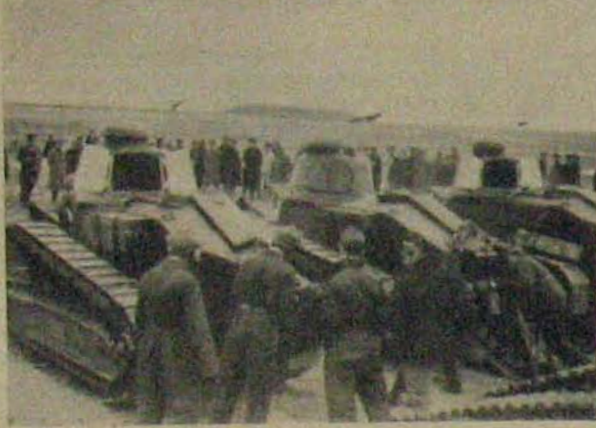
Fegyverben a világ: A spanyolok.

— lovasságot helyettesítő és terepen vágató egy-két emberes és nehezebb motoros osztagokkal, — felderítő, vadász és bombázógépek, ködben és sötétben, sőt helyenként pilóta nélkül önműködően irányíthatóan, — ellenük felsorakozva új védelmi ütegek csoportjai, melyeknek irányzó, fűlélő és jelző berendezései évről-évre újabb találmányokat tárnak elénk. De itt vannak dübörgő osztággal és a legújabb géporiasok, — a gépesített hadvezetés eszközei, — önálló harcsoportok páncél és vértetett mögött, támadó erejük lökeménck fokozásáa terepjáró gépkocsin szállított gyalogsággal megerősítve. Nehéz és legnehezebb harcokcsik törnek számukra utat az ellenfél védelmi rendszerén keresztül. A fedezékek mögé, ahová tűz és lövedékhatás el nem ér, a vegyi harcsoport gáz és kémiai eszközei kerülnek alkalmazásra, — a saját csapatot ugyanakkor gázvédelmi és fertőtlenítő osztagok kísérik és oltalmazzák. A gázharc nemcsak a földről folytatható, korszerű repülőgépek többszáz kilogramm teherbíró képességgel gázbombák tömegét vihetik magukkal. Elektromos gyújtóberendezésekkel fokozzák a gáz hatását.