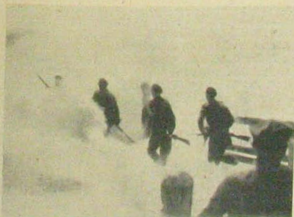
Fegyverben a világ: A lengyelek.

Az angol technika és fejlődés még tovább ment ezen a téren. A gyalogságot kísérő és támogató fegyver-ből önálló fegyverneminé leptette elő a tankokat, ame-lyek önálló egységekbe, egész seregtestekbe egyesítve, gyalogság nélkül hajtják végre és folytatják le a táma-