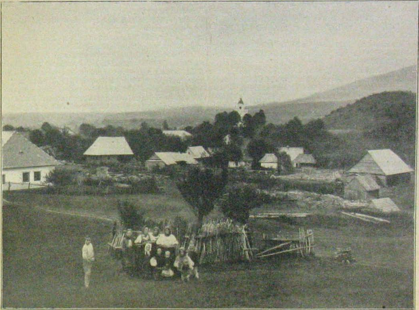
Amit vissza kell szereznünk: Sztropkó.