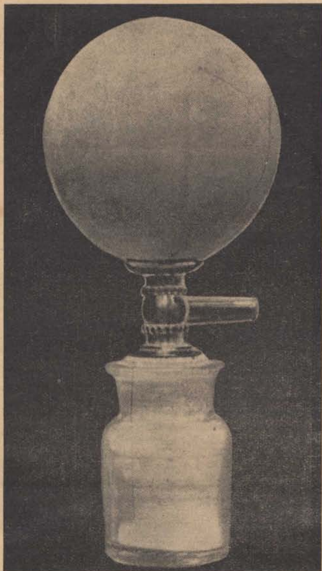
Müllner-féle lábnyomrögzítő-készülék, amellyel a legkényesebb anyagban (por, liszt stb.) levő lábnyomokat is teljes biztossággal és élethűséggel le lehet mintázni.

üdvös dolog volt, féltetve minden kicsinyes költséglémlést, a magyar királyi csendőrséget a nyomozás modern eszközeivel ellátni. Beigazolódott az is, hogy a magyar királyi csendőrség tagjai milyen kitűnően képzettek és iskolázottak és hogy minden szakavatott daktíloszkópusnak is becsületére válnék az az úgynevezett újjlenyomat-biztosítás, amelyet a csendőrök a malomcsárda bűnügyének felderítése alkalmával fogatosítottak.