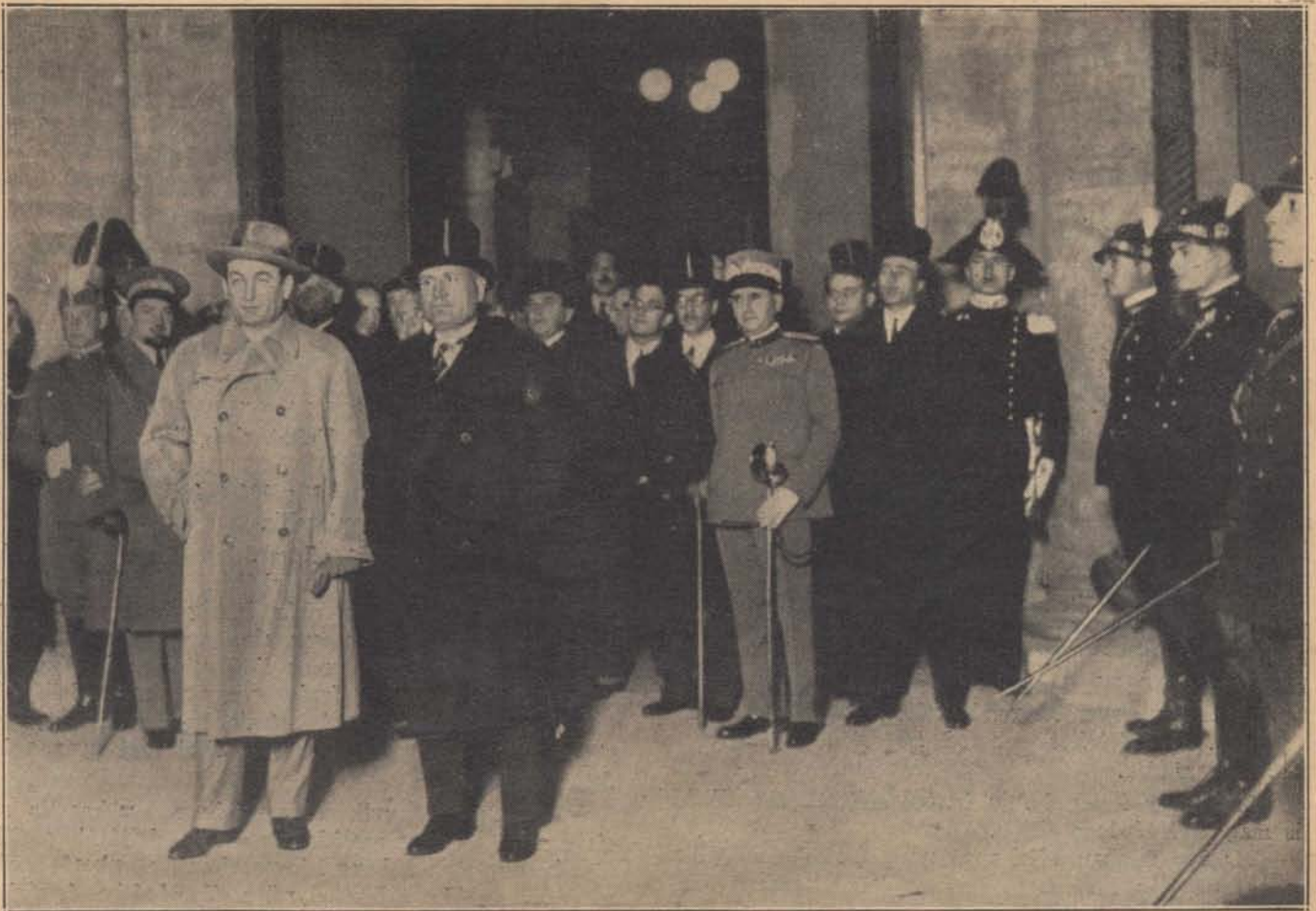
Vitéz Jákfai Gömbös Gyula miniszterelnököt Rómába érkezésekor Benito Mussolini olasz miniszterelnök személyesen fogadta a pályaudvaron. A kép jobbfelében, a nézővel szemben a fal előtt olasz csendőr (carabiniere) áll.

ságnak közvetlenül postáztunk, néhány hétnél hamarabb nem igen kaphatunk választ, mert a főkapitányság ügyforgalma olyan nagy, hogy ennél gyorsabb elintézés nem igen lehetséges. Olyan átiratokra azonban, amelyeket az összekötőtiszt útján küldöttünk el, sokkal hamarabb kapunk választ, mert az összekötőtiszt személyesen utánajár, hogy az elintézés soronkívül történjék. S ha pedig a nyomozásnak rendkívül fontos érdekei fűződnek ahhoz, hogy az elintézés postafordultával megtörténjék, akkor írjuk fel a megkeresésünk jobb felső sarkába piros tintával, hogy „Nagyon sürgős”; az ilyen jelzésű megkereséseket, ha valóban sürgős természetűek, egy-két nap alatt elintézik.