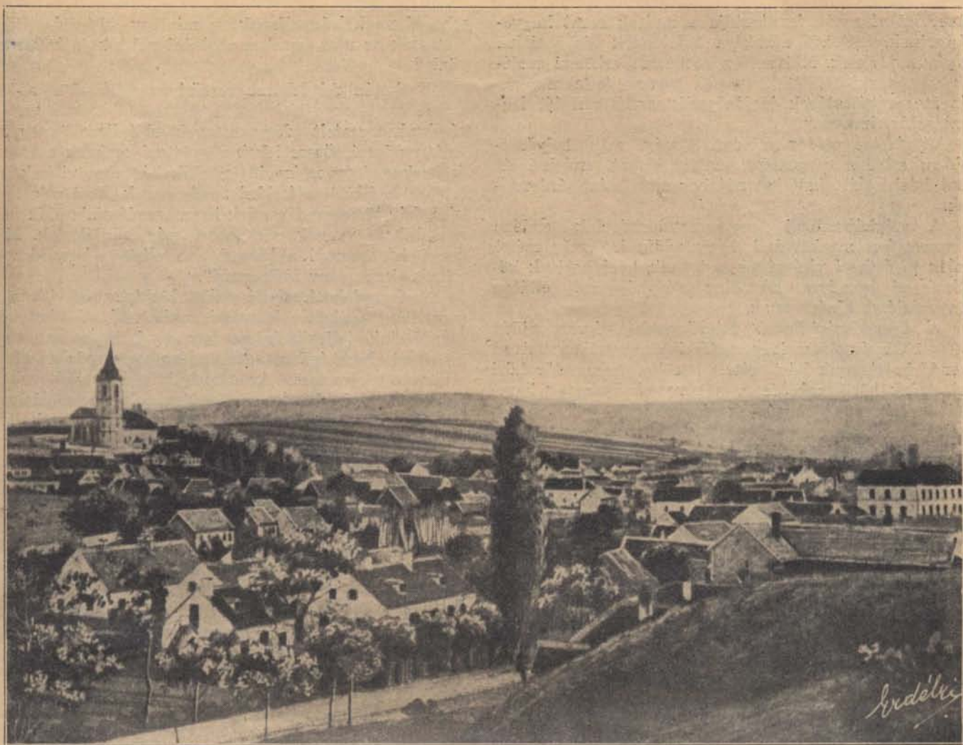
Amit vissza kell szereznünk: Nagymarton.