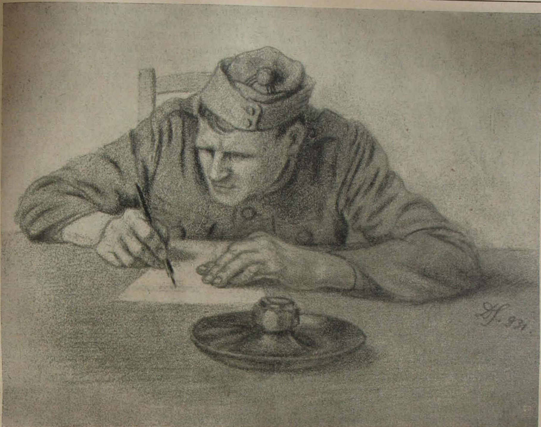
Készül a feljelentés.