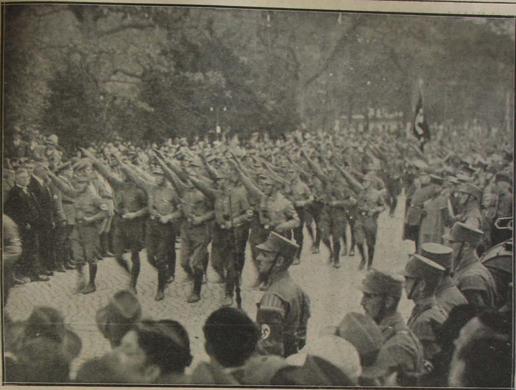
Német nemzeti szocialisták felvonulása.