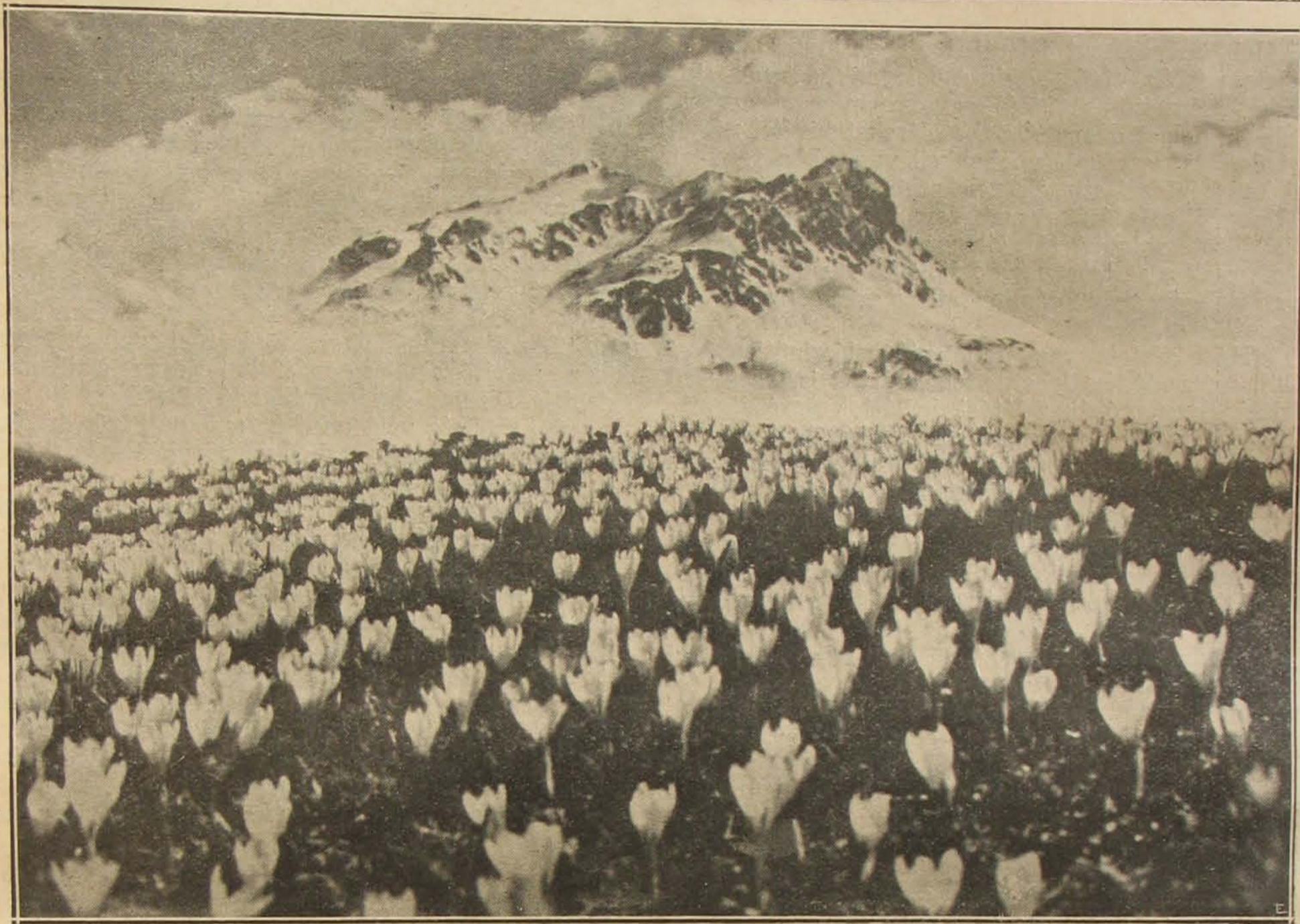
A tavasz hírnökei.

már a sértett vagy feljelentő első kikérdezésénél is — ha a bűncselekmény minősége és a körülmények megengedik — megbízható és titoktartó egyéneket az előadottak tanujaként alkalmazni, mert előfordulhat, hogy a feljelentést csak azért teszik meg, hogy azzal nagyobb bűncselekményt palástoljanak, vagy hogy a figyelmet más, fontosabb dologról eltereljék. Ha azonban ez az első kikérdezésnél nem lehetséges is, a további kikérdezéseknél bizalmi egyéneket a Szut. 425. pontja értelmében mindig alkalmazni kell.