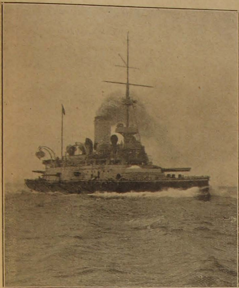
A „Budapest” partvédő páncélos.

ják eldönteni, hogy egy győzedelmes tengeri harc után lehetőleg egyáltalában eredményes támadást intézni a partok ellen, feltéve természetesen, hogy a támadó a feladatához mérten fel van szerelve. A krími háborúban a szövetségesek jól felszerelt és nagy flottái azért nem értek el eredményeket, mert mélyjáratauk folytán nem közelíthették meg eléggé a partot; a Dardanellák elleni harcban pedig az antant hajóhadának erőfeszítése kétségtelenül a megfelelő felszerelés és felkészültség hiányában maradt eredménytelen. Azok a különleges viszonyok, amelyekhez partiharcban a vízjáróműveknek alkalmazkodniok kell, különleges tulajdonságokat is követelnek meg ezektől. Az nem szükséges, hogy különösen jól állják a tenger viszontagságait, mert nyílt tengeren, nagy távolságokra úgysem fogják