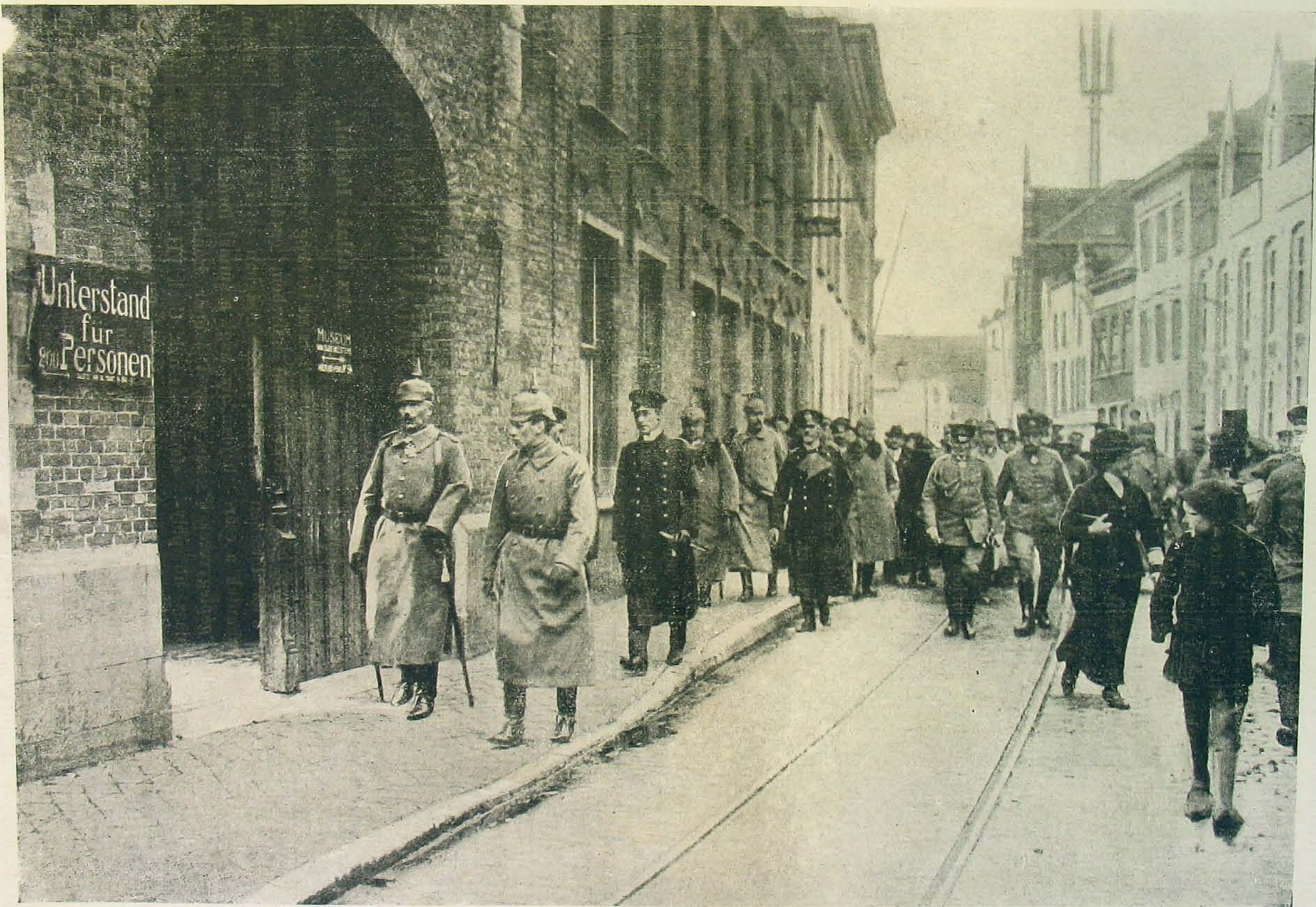
A német császár látogatása Brüggeben.