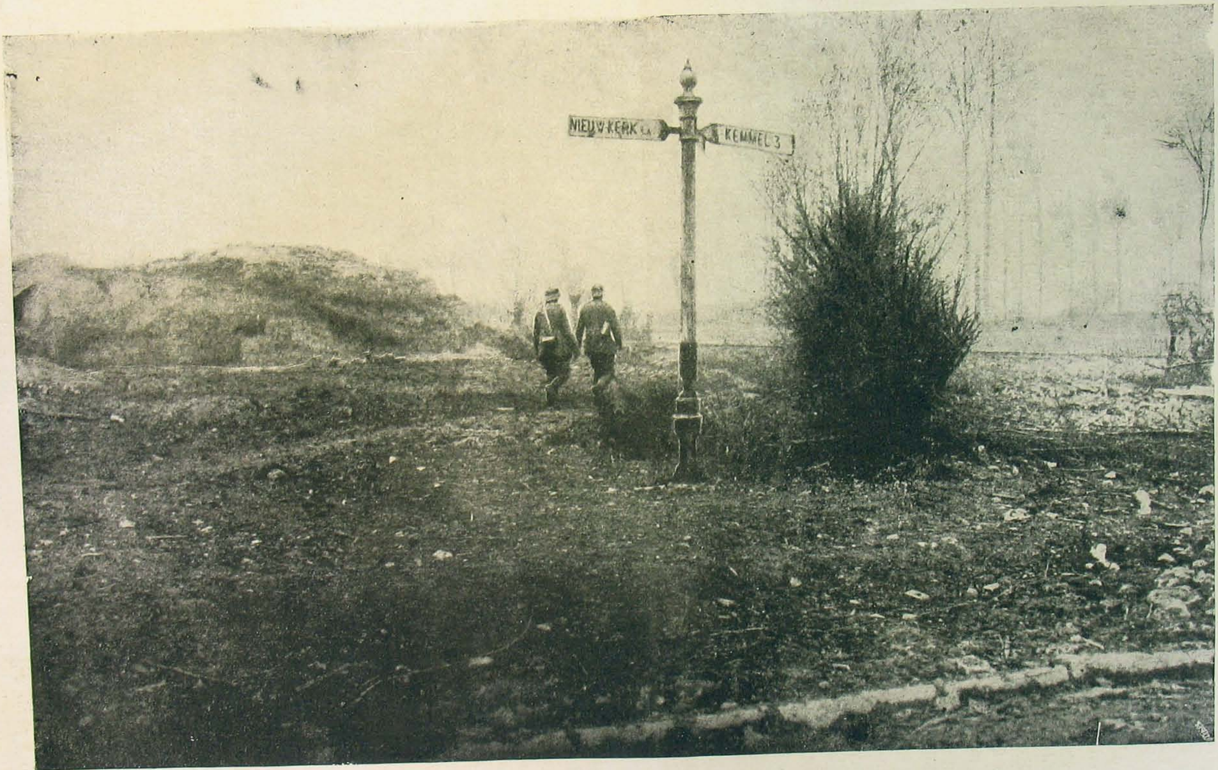
A hol legerősebb a küzdelem.