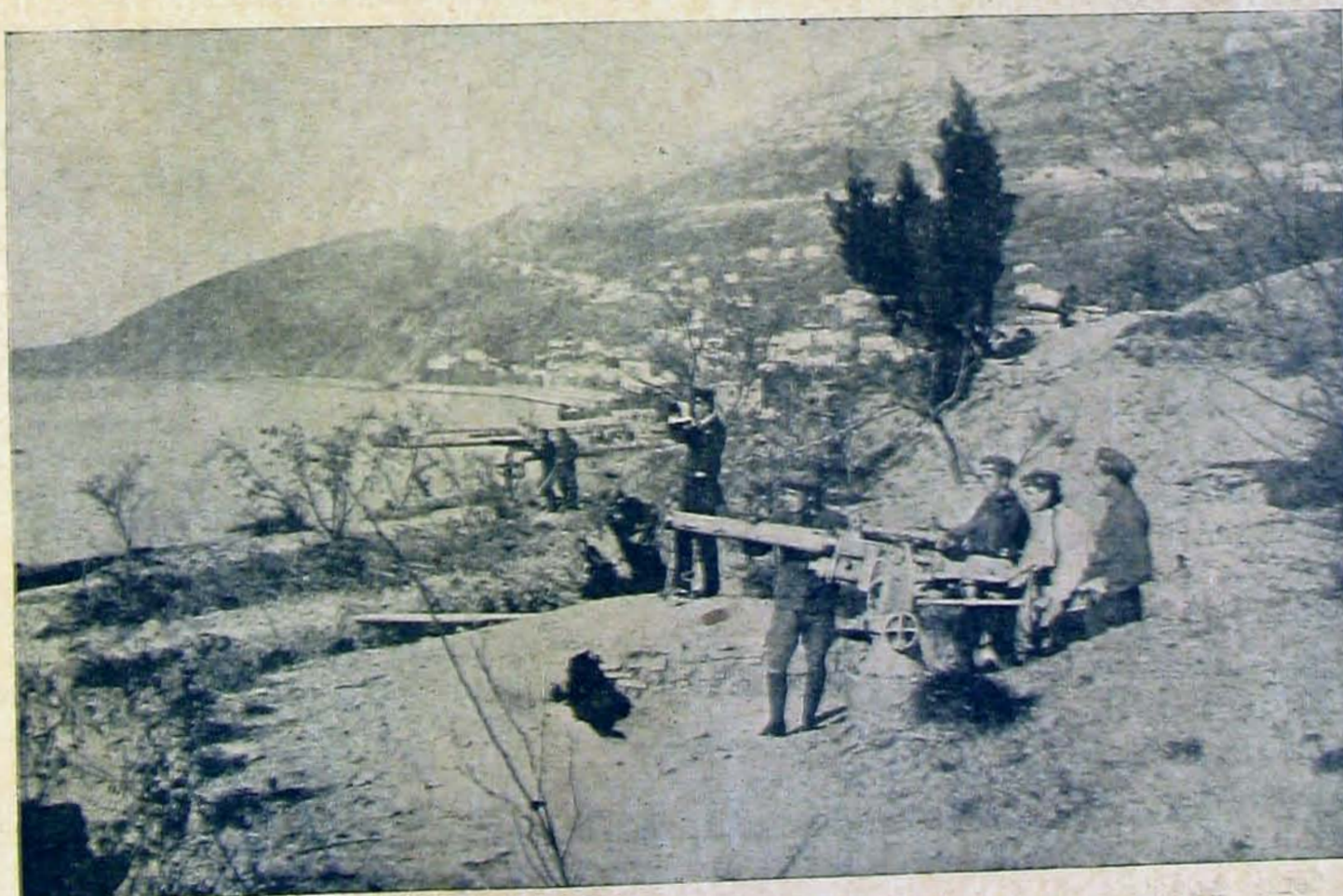
Őrség az Adriónál.