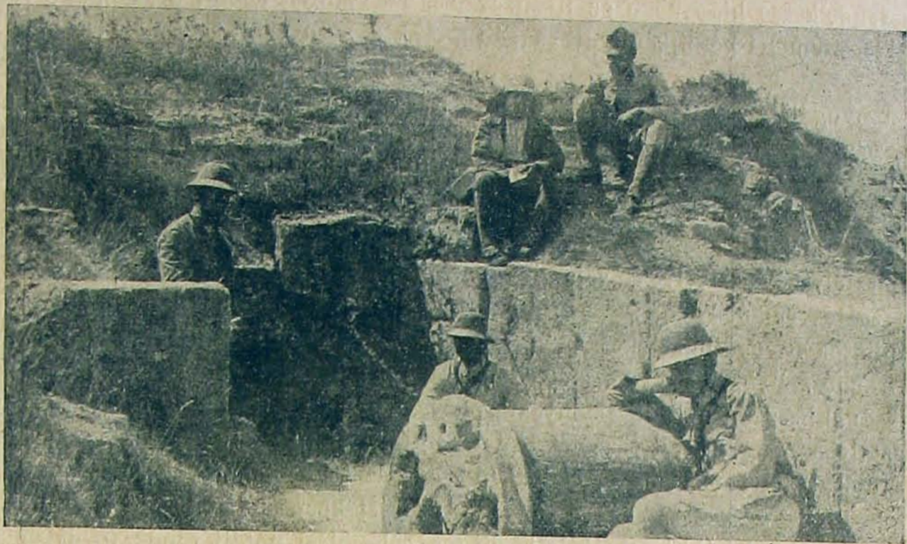
Tüzéreink Trója romjai közt.