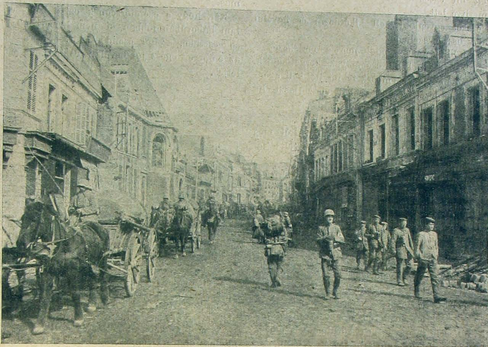
Német csapatok átvonulása St.-Quentinon.