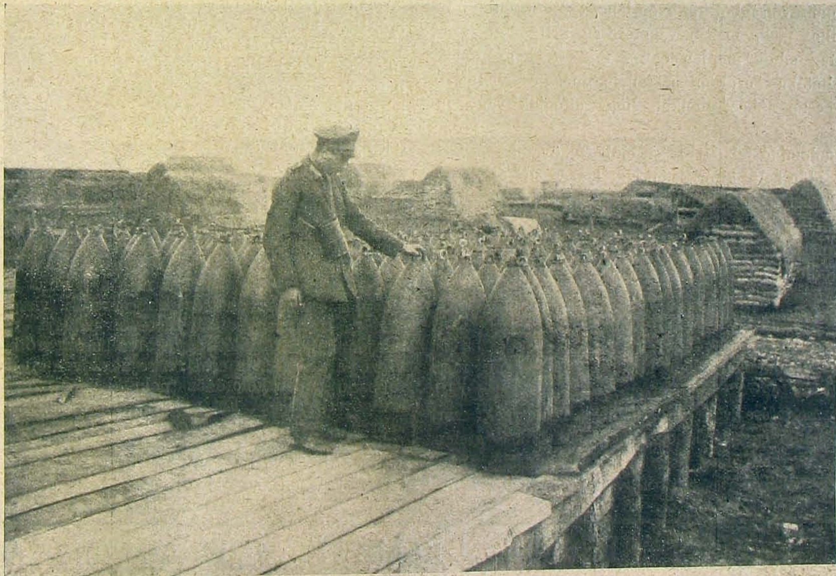
Nehéz angol gránátok egy sértetlen állapotban zsákmányolt raktárban, Aubignyben.