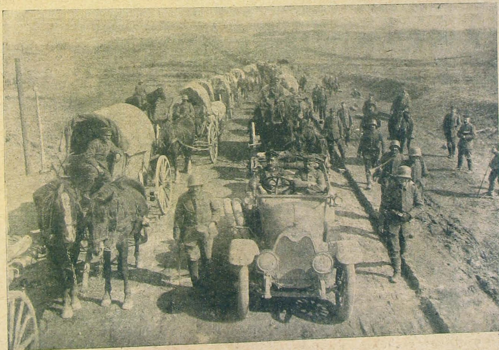
Német csapatok átvonuló útja Ham előtt.