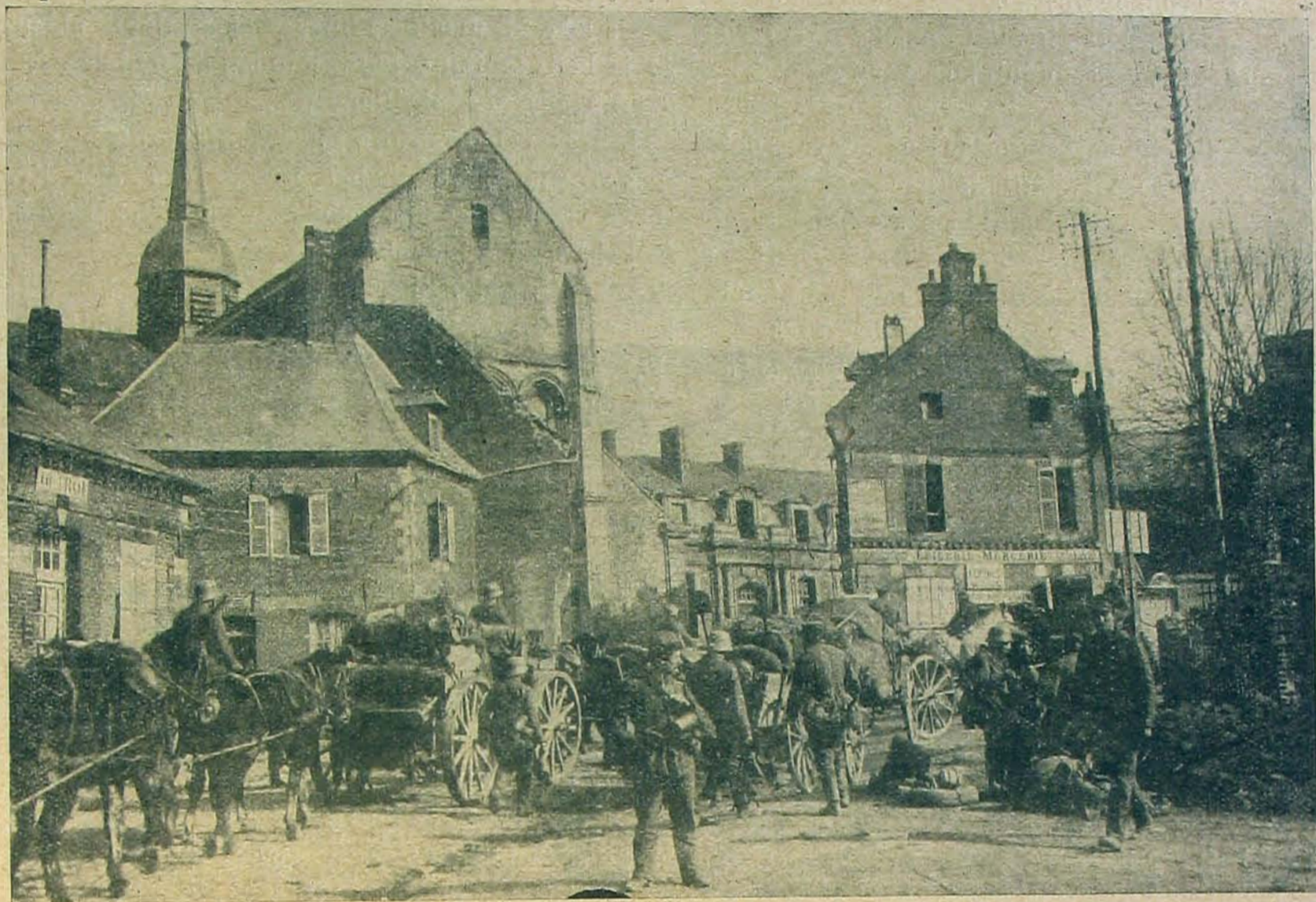
Előnyomuló német csapatok elvonulnak Hamban a templom mellett.