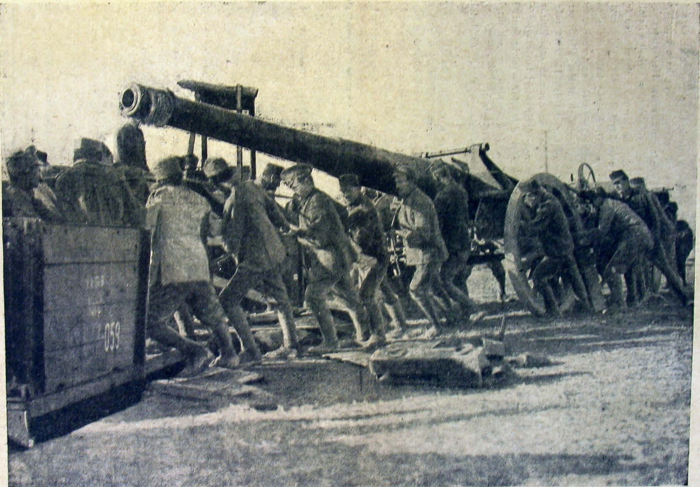
Zsákmányolt olasz ágyú szállítása.