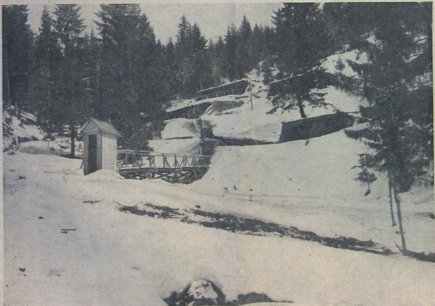
A keleti harctérről. — Fedezékek a hegyoldalon