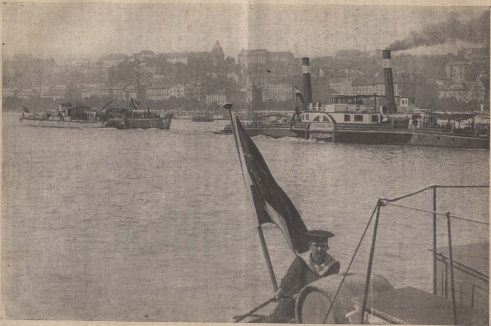
A Teues monitorunk diadalutja.