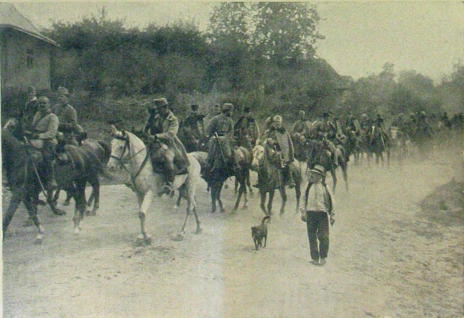
A galicziai harczterekről. — Egy lovashadosztály bevonul egy faluba.