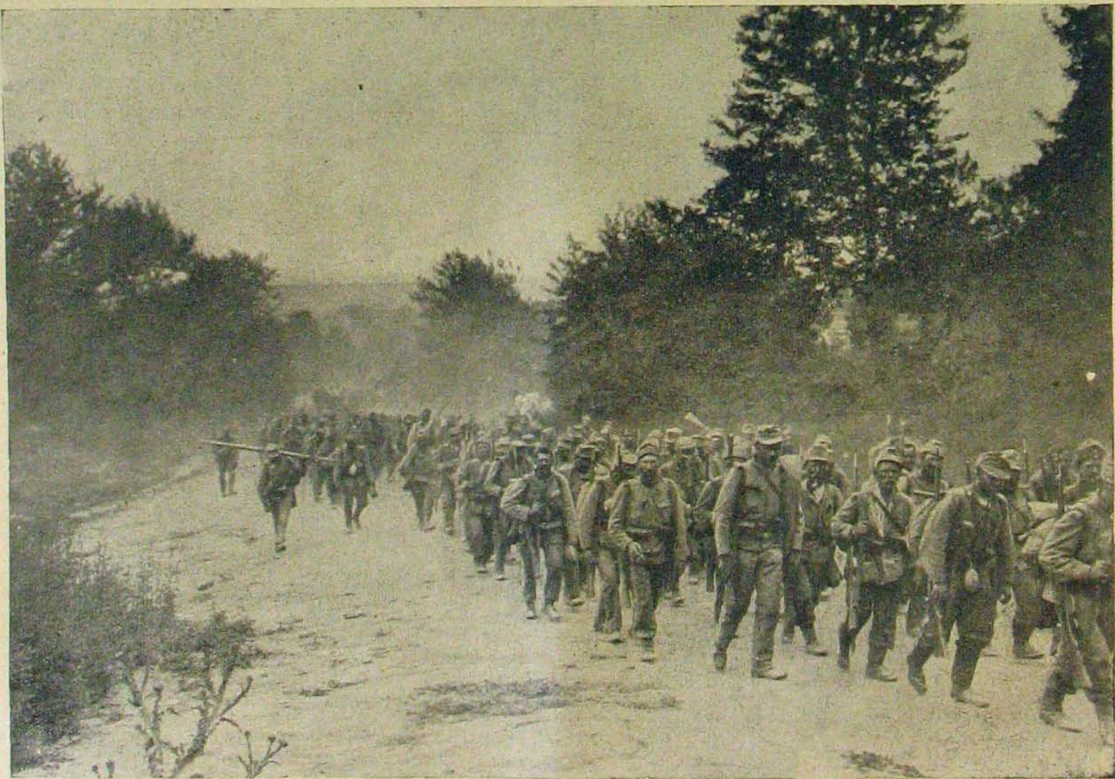
A galicziai harcsterekről. — Előrenyomuló csapataink.