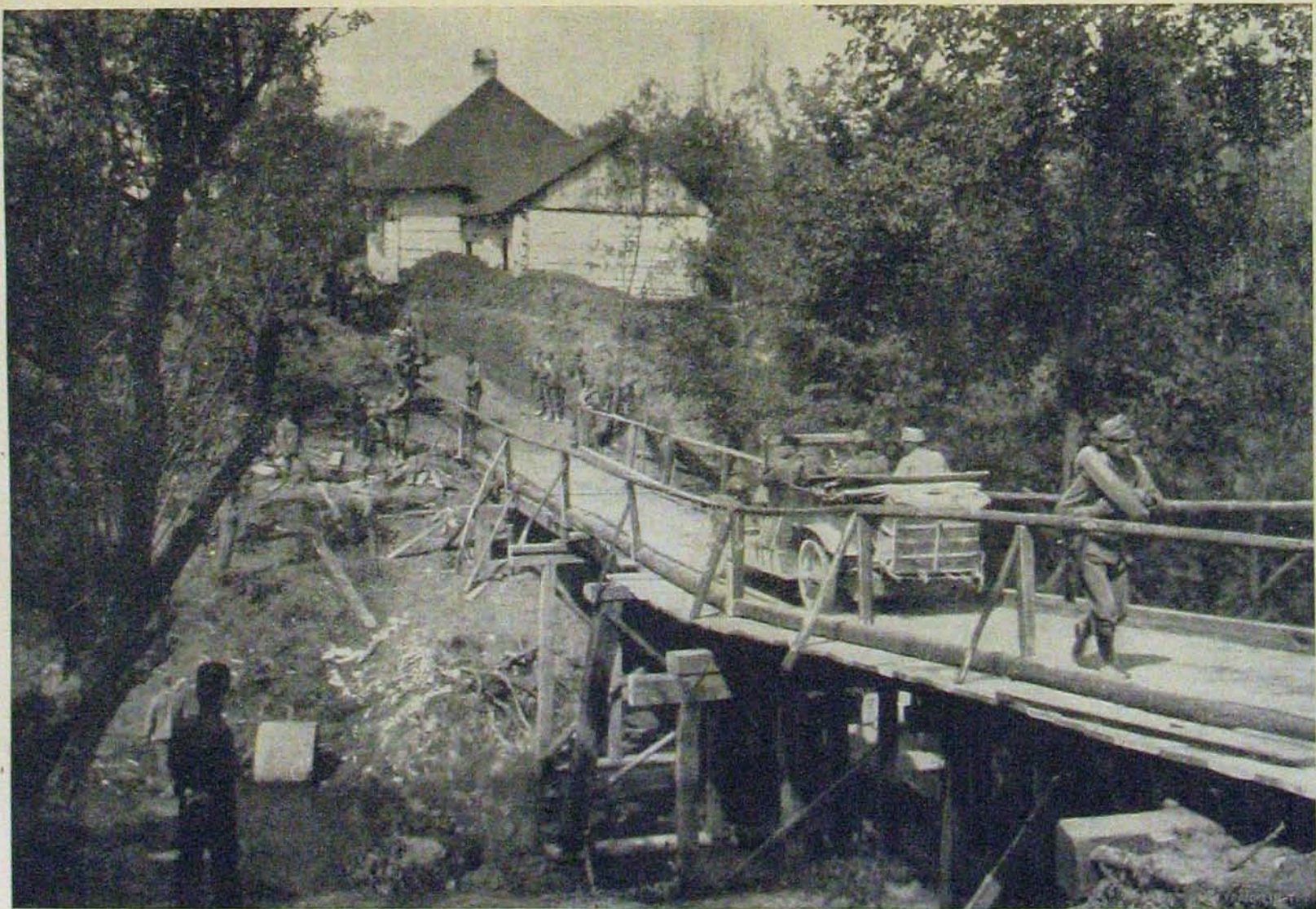
Galiczai győzelmes harcainkból. — A vitkoveci hadi híd az oroszok elvonulása után.