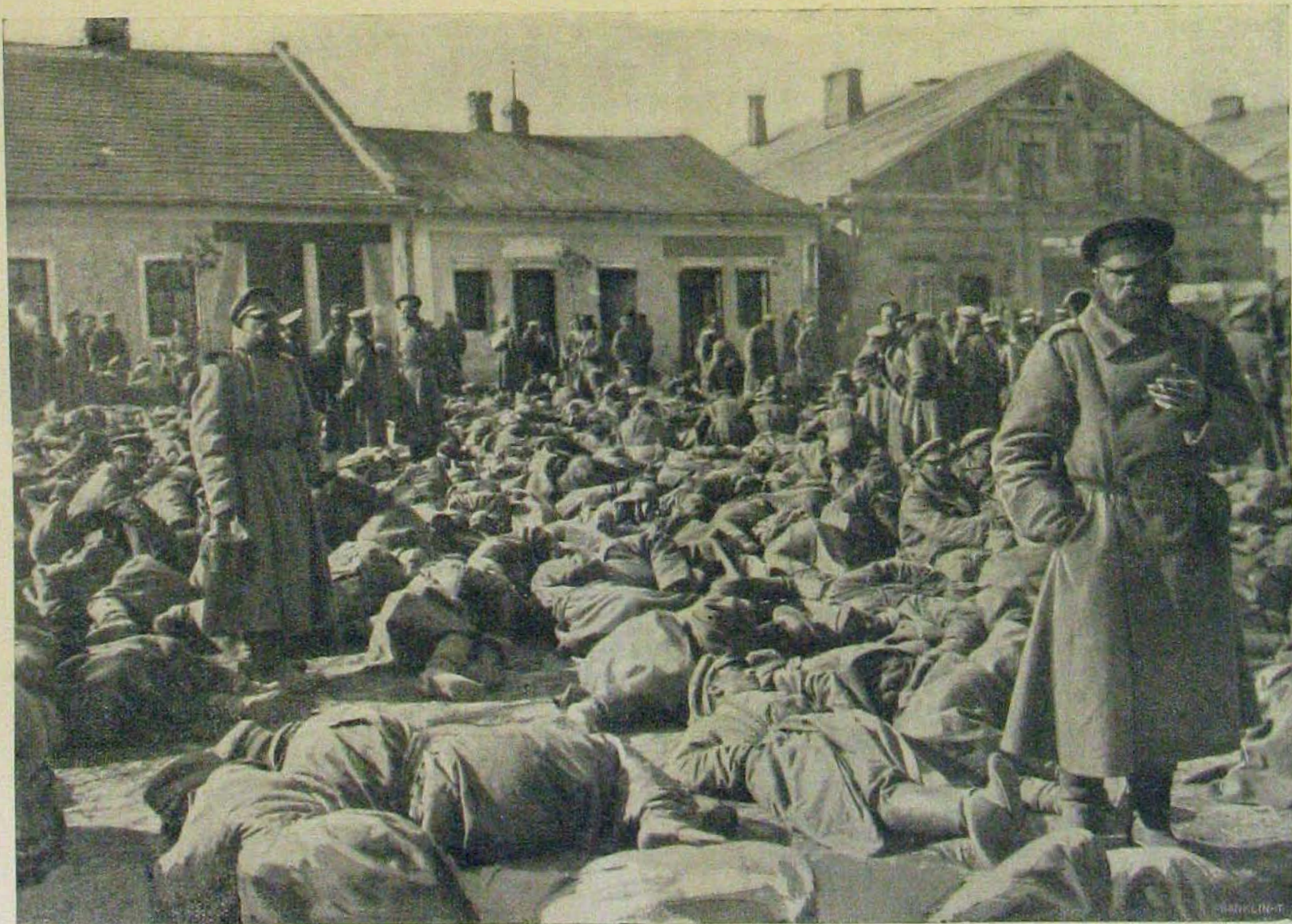
Galicziai győzelmes harcainkból. — Orosz foglyok.