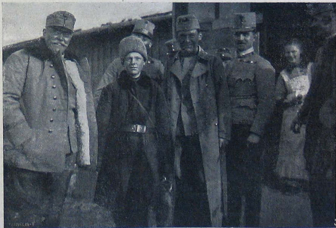
Az északi harctérről. — Magyar bakák a Kárpátokban. — Tizennégy éves orosz önkéntes.