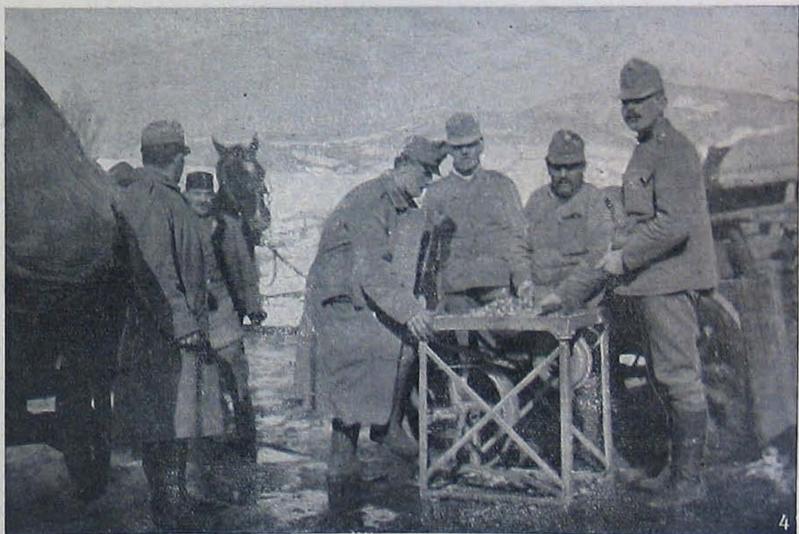
Az északi harcztérről. — Orosz foglyok munkaközben. — Részáruilik a kardokat.