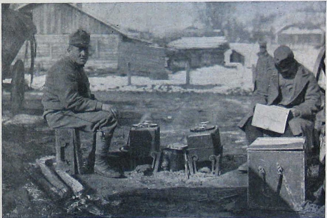
Az északi harsztérről. — Elfogott orosz gépfegyverek. — Főzőláda, melyet akkor használnak, mikor a közelben nincs konyha.