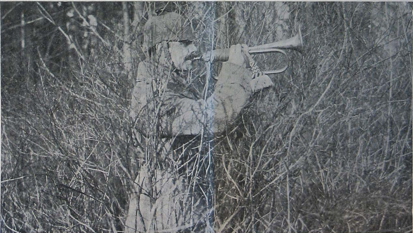
Az Argonneokban. — Német katona trombitával jelt ad.