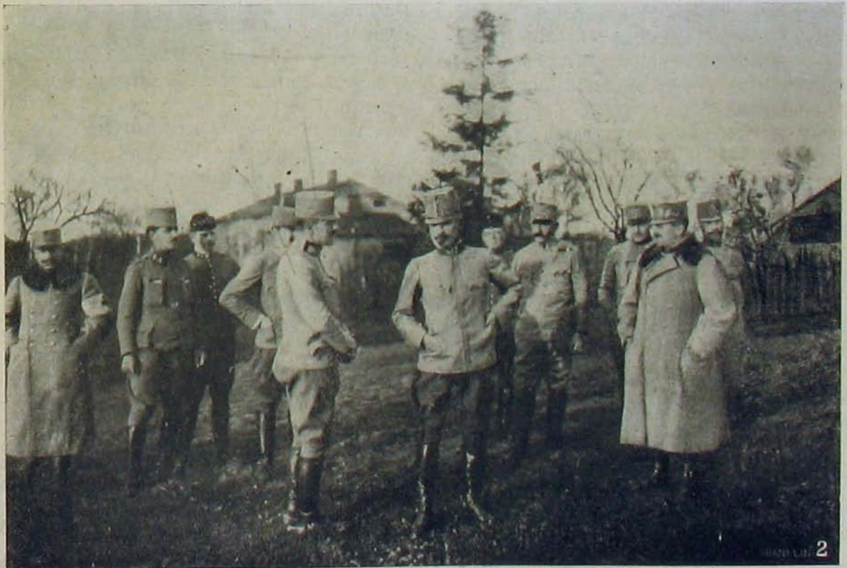
Az északi harcztérről. — Tschurtschenthaler altábornagy, hadtestparancsnok vezérkarával.