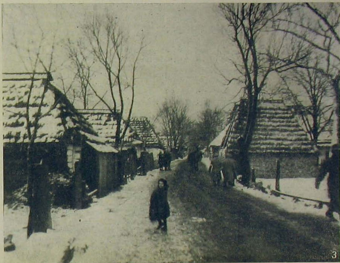
Kwasznio w ssiu Orosz-Lengyelországban.