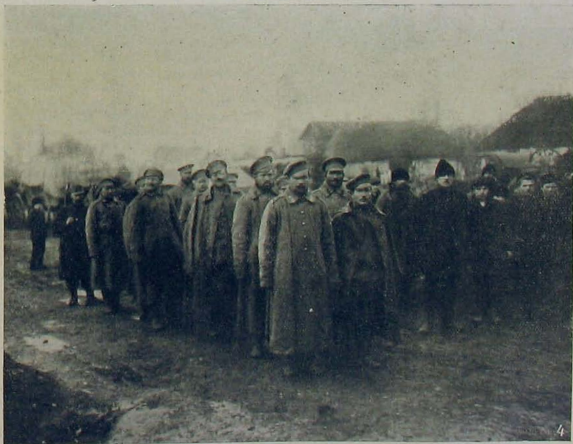
Az északi harcztérről. — Orosz foglyok a gárdaszerezből.