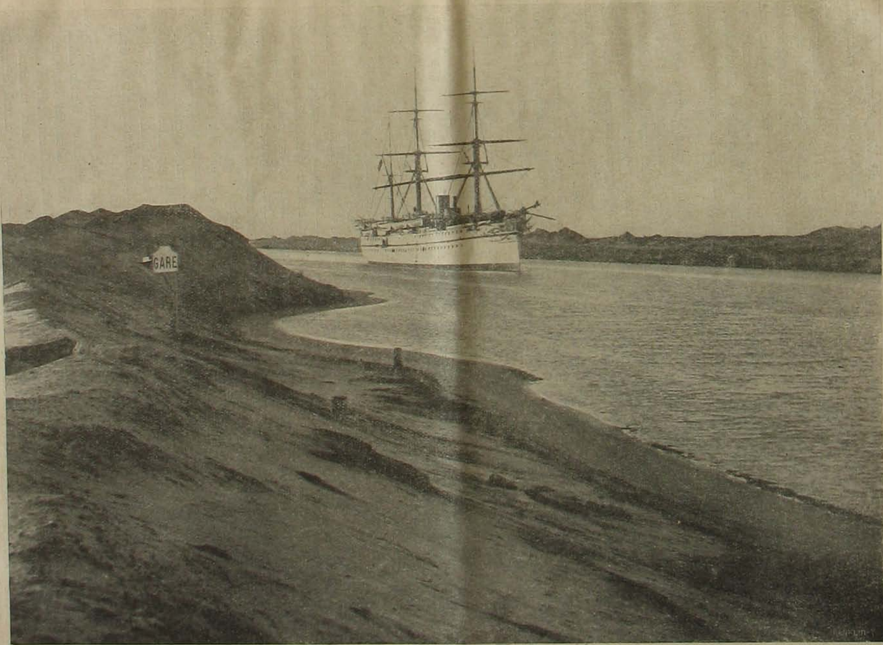
Részlet a szuezi csatornából.