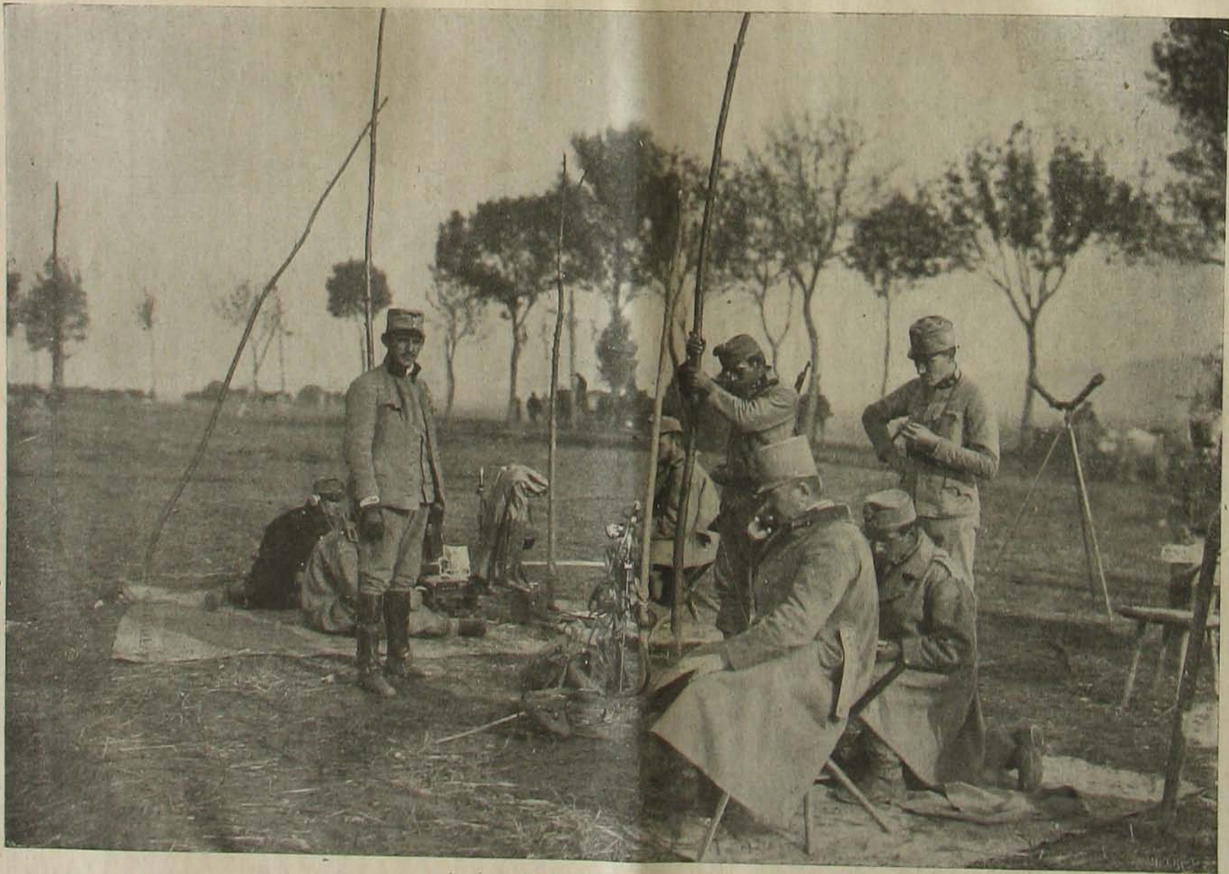
Az északi harcztérrel. — Törzs telefonja.