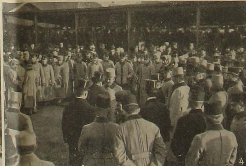
Helyőrség-változások Budapesten. — 1. A 38-ik gyalogezred távozik Péterváradra: Lukácsies ezredes bucsuboszéda. — 2. A zászló begöngyölítése. — 3. Beszállás. — 4. A 44-ik gyalogezred távozik Bécsbe: József főherozog üdvözlő Festetics gróf alpolgármestert.