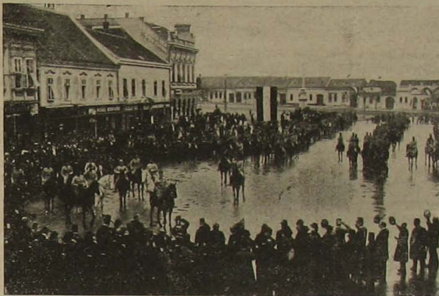
A 2. sz. honvédtüzér ágyús-ozrod a népélyes bevonulása és fogadtatása Verseczen április 4-ikén.

másik, hanem X. őrmesternek, N. járőrvezető csendőrnek stb.