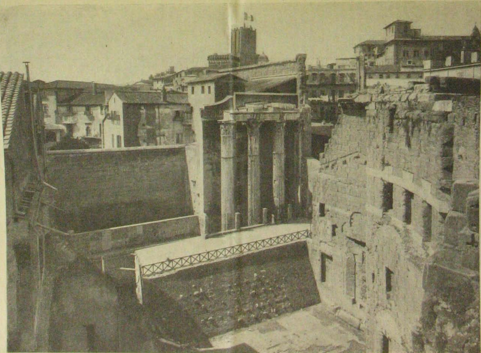
A császári fórumok Rómában. — Augustus fórumának romjai és Mars Ultor temploma.