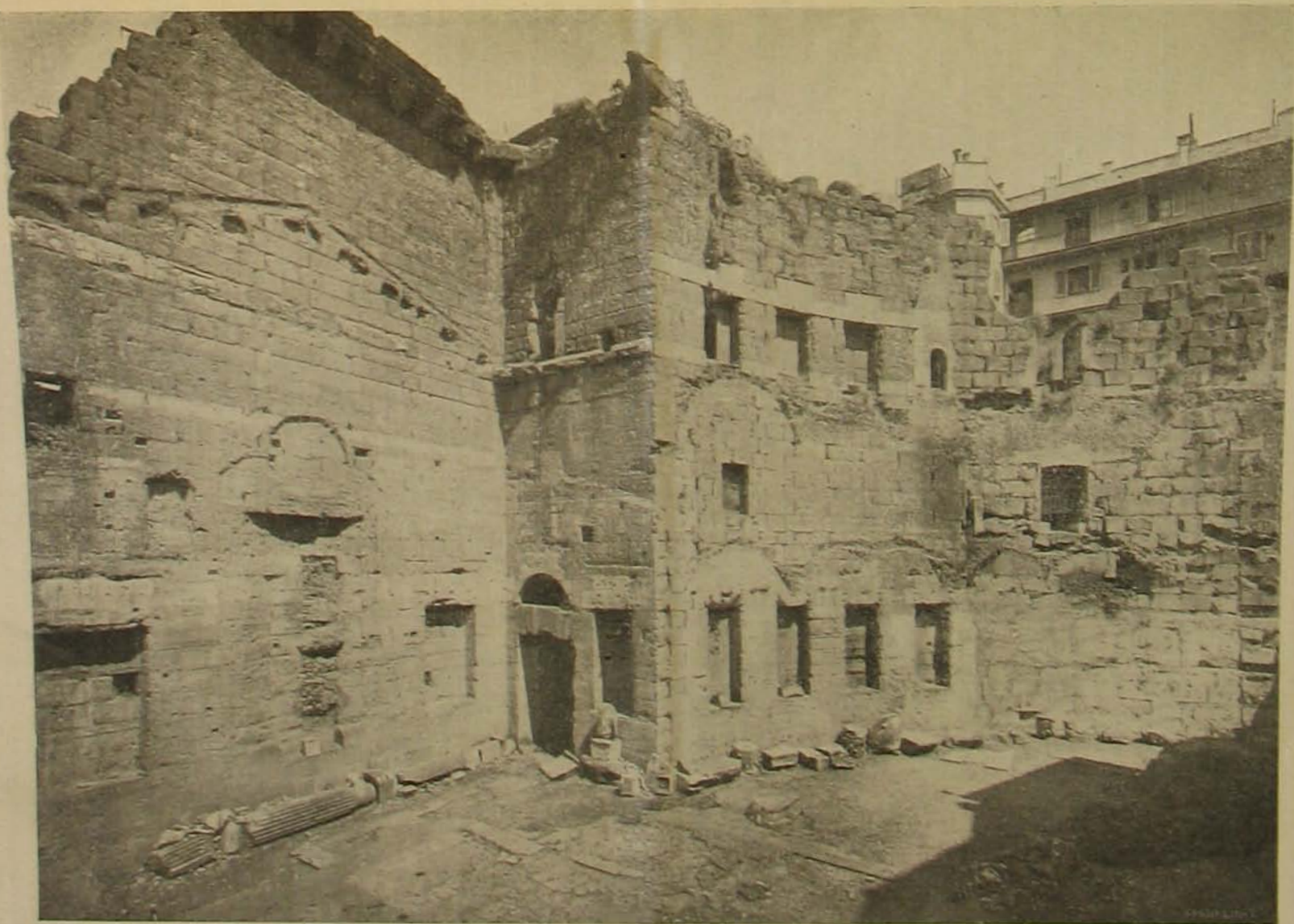
A császári fórumok romjai Rómában. — Augustus fóruma; déli részlet.