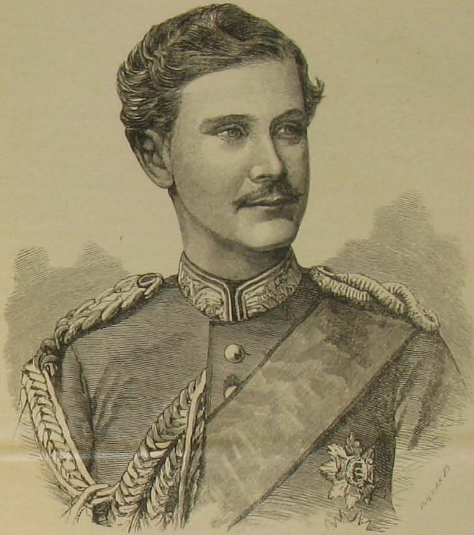
Ottó, a trónjavesztett magyar király. Kép a 70-es évekből.

A cigánygyerek, mint a gyík, úgy kuszott a tanya felé, de a mint kijött a szőlők közül és a ház végéhez ért, Thoma őrmester galléron ragadta, a száját befogta és úgyszólván négykézláb menve, behurcolta a sötét konyhán át a kivilágított szobába, a nélkül, hogy a megrömült gyerek egy kukkot is szólhatott volna.