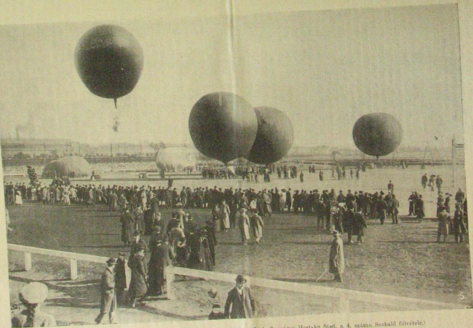
5. A léggömbök a Tattersallban. Léghajóindítás automobillal, Budapesten október 19-én.