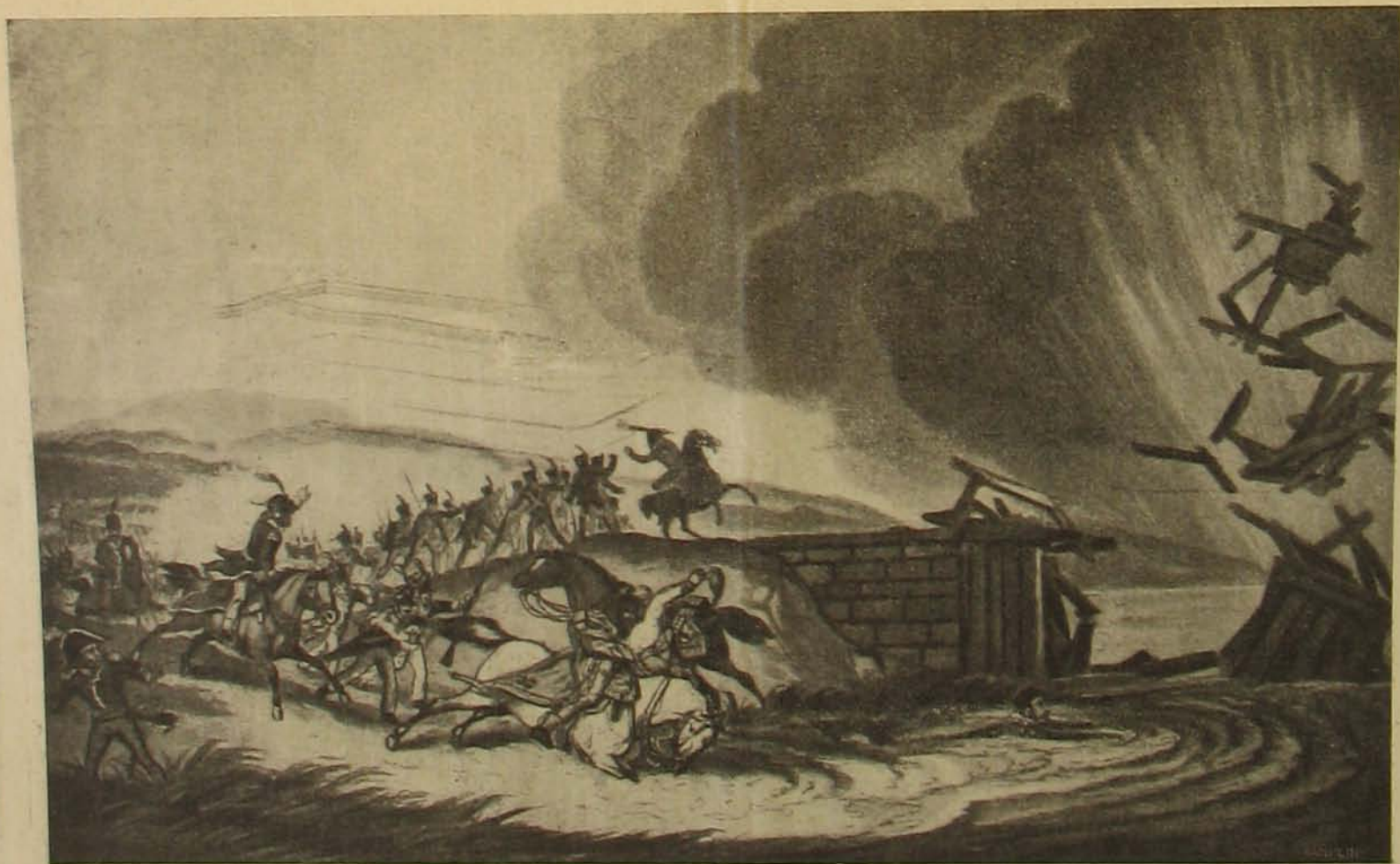
Ponyatovszki a lipócsai csata után megsebesülve az Elszerbe veti magát.