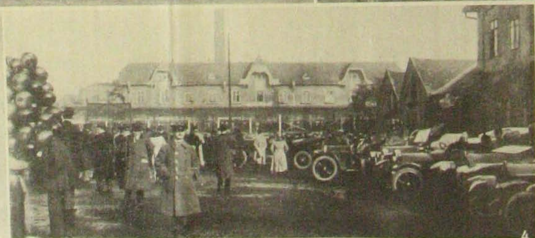
1. A töltéskor katonák tartják a léggömböt. — 2. A 3-as számú léghajó felbocsátása. — 3. Egyik léghajó a keleti pályaudvar fölött. — Az üldözésre induló autók.

Léghajóüldözés autóbíllal, Budapestén október 10-én.