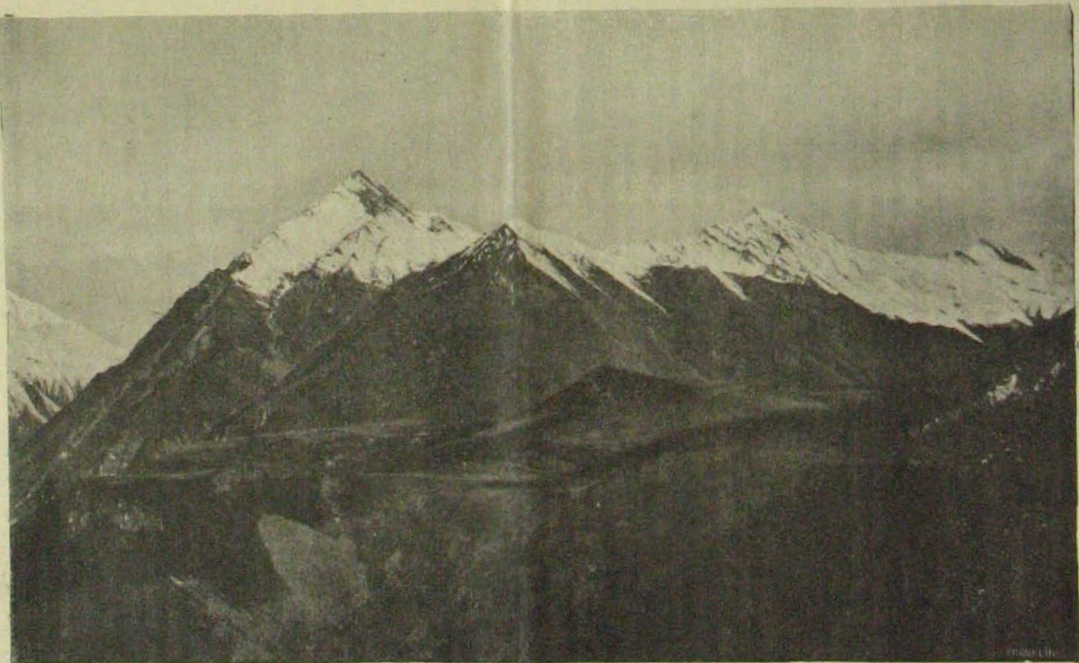
Hóval fedett csúcsok Krimében.