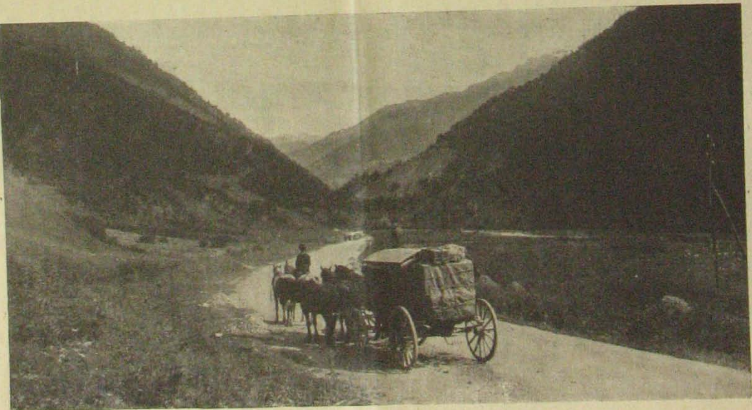
Utazás Krimea félszigetén át.