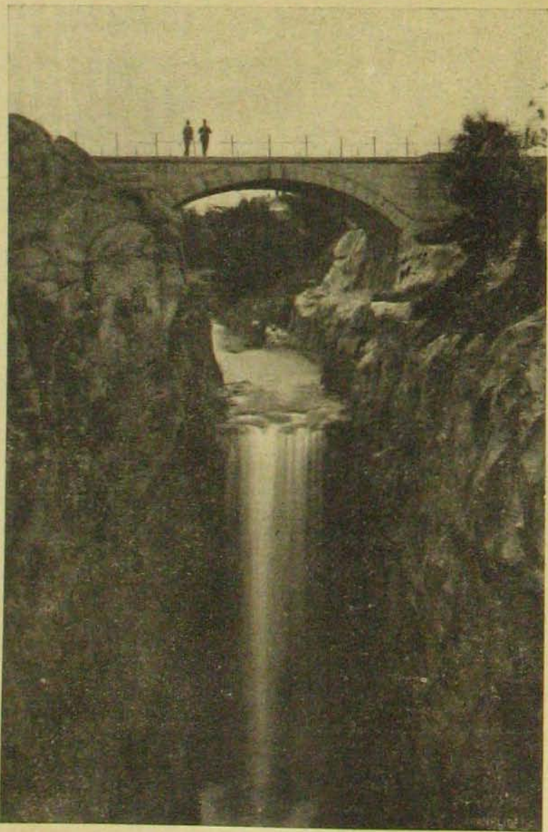
Vadregényes tájkép Trollhatannál, Götoborg közelében. (Svédország.)