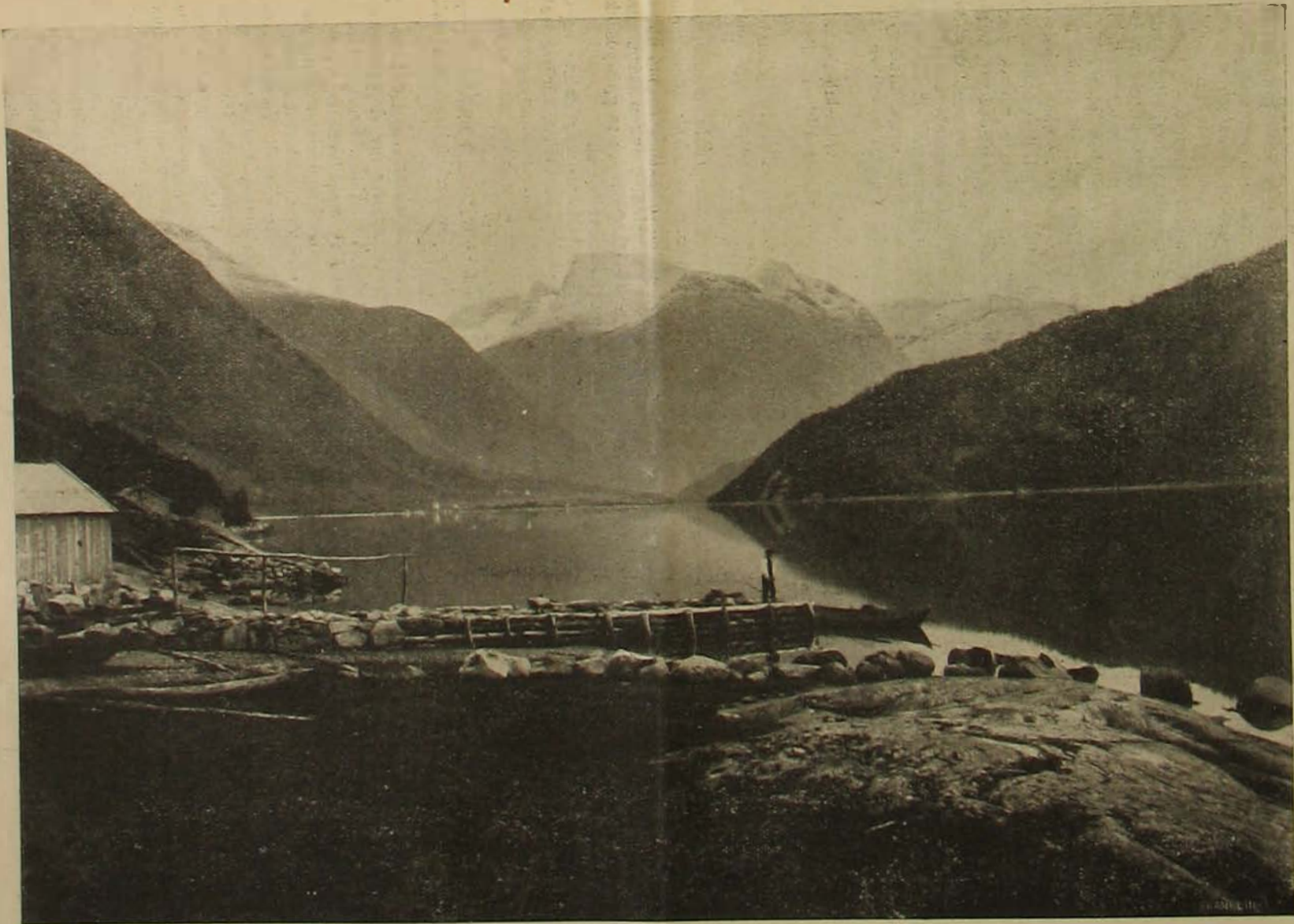
Norvégiai tájképek. — Norfjord Loan vidékén.