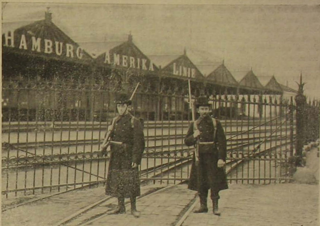
Katonák őrzik az antwerpeni kikötőt.