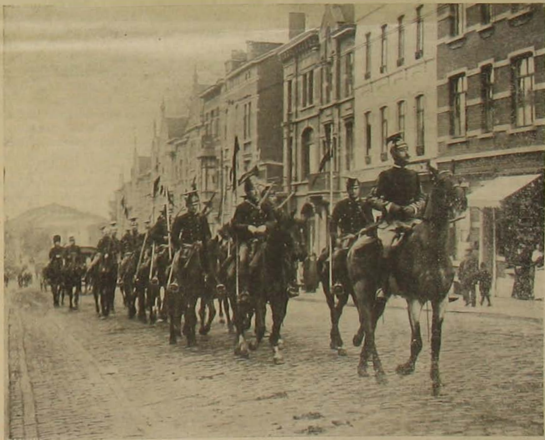
A belgiumi általános sztrájk. — Lovas őrzület Charleroi-ban, a hol a nagy köszénbányák vannak.