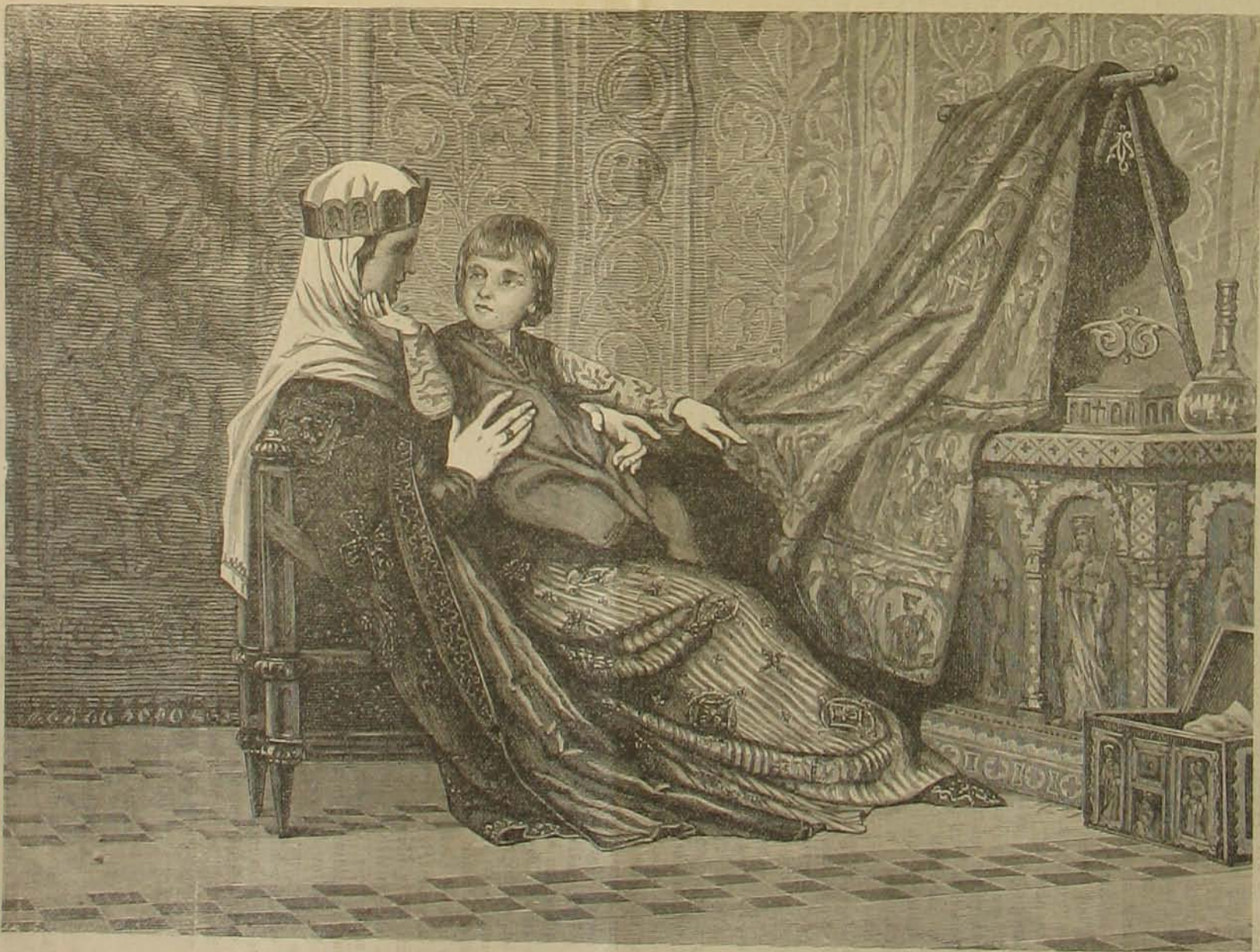
A Gizella-albumból: Gizella királyné és Imre herceg.