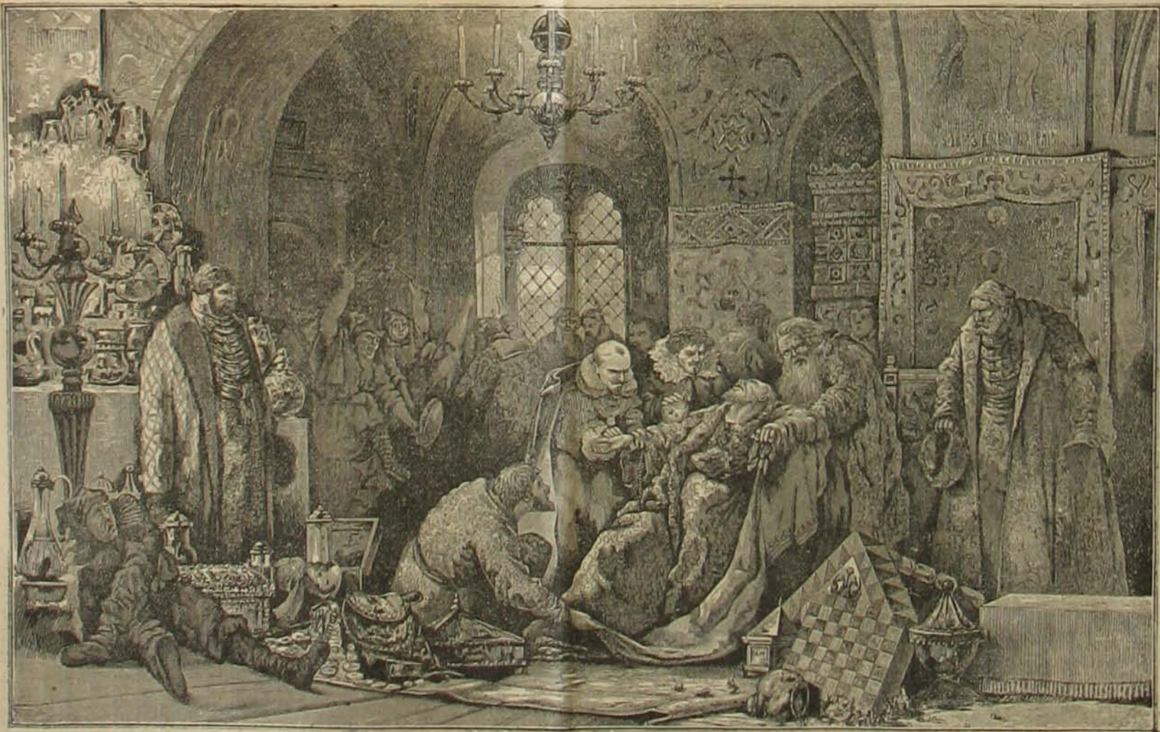
Az orosz történetből. — IV. (Rektonotos) Iván halála.