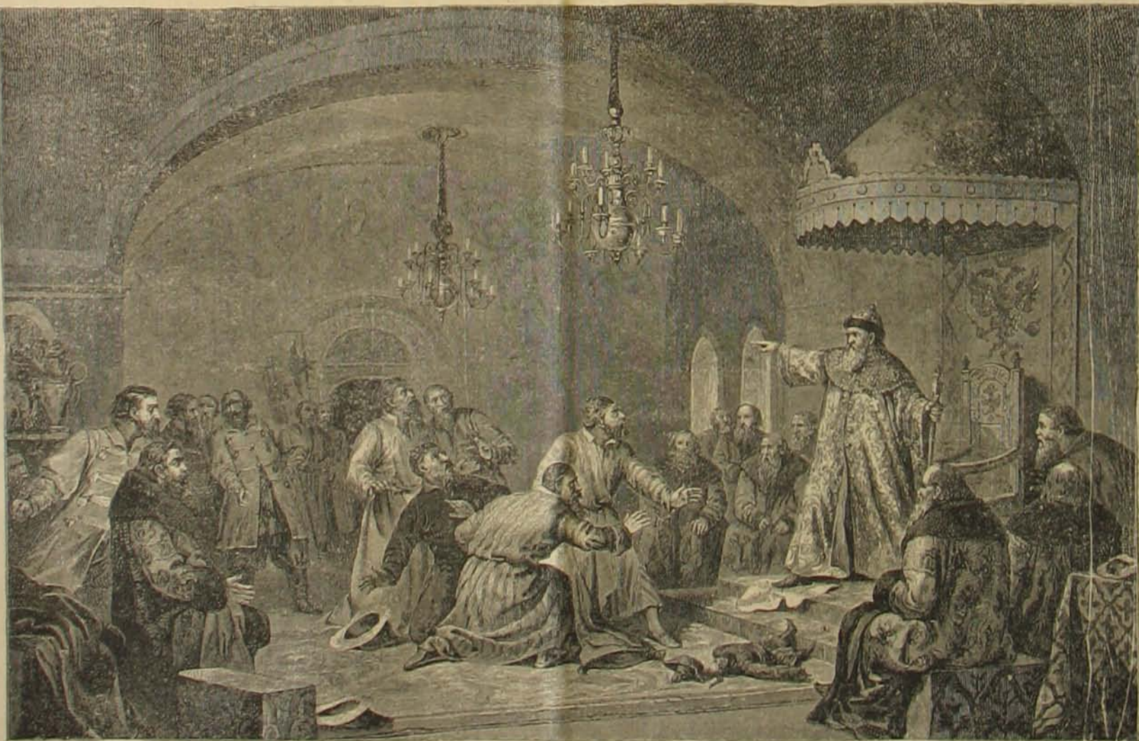
Az orosz történetből. — III. Iván megtagadja a Khán követőitől az adót.