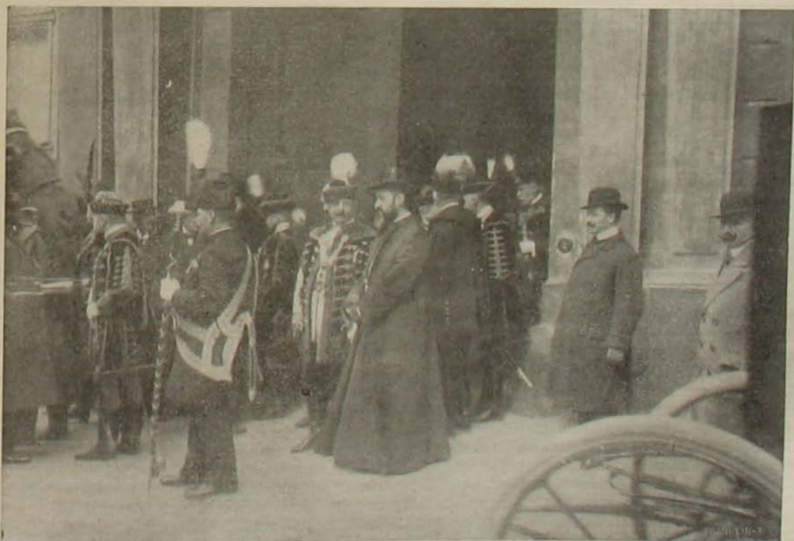
A magyar delegáció Bécseben. — A delegátusok indulása a trónbeszéd meghallgatására.