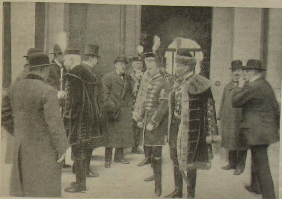
A delegátusok indulása a trónbeszéd meghallgatására.