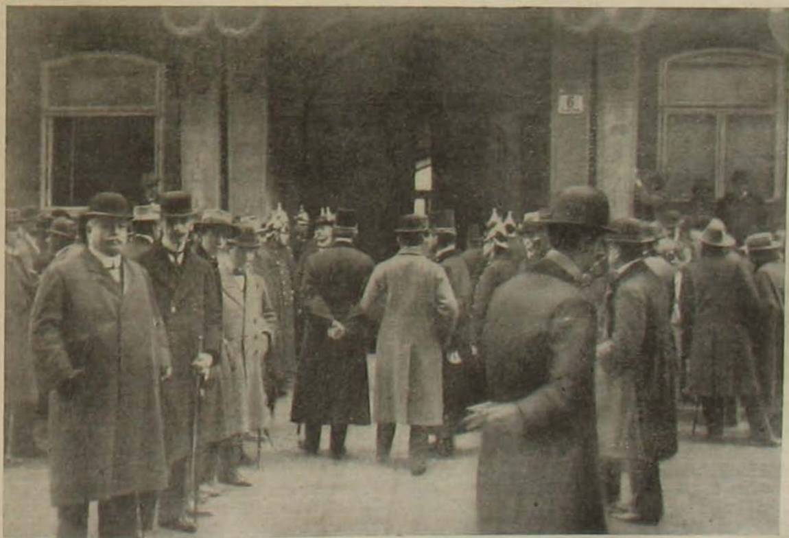
A magyar delegáció Bécében. — A bécsi rendőrök a magyar ház kapuja előtt.