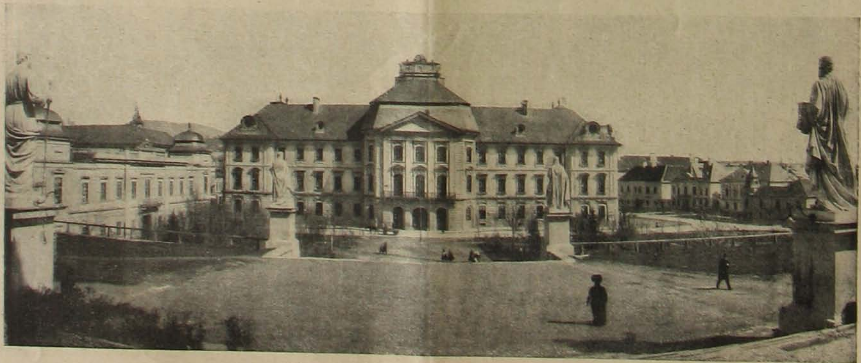
Egri képek. — A lyceum palotája az Eszterházy-téren.