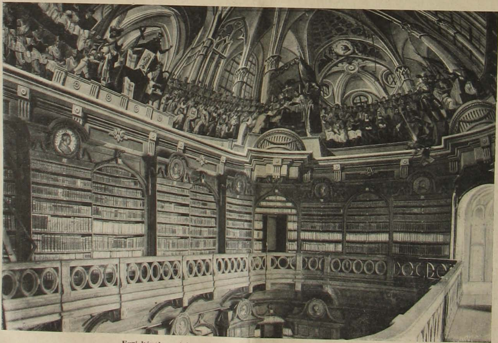
Egri képek. — A könyvtár a tridenti zsinatot ábrázoló Kracker-féle freskóval.