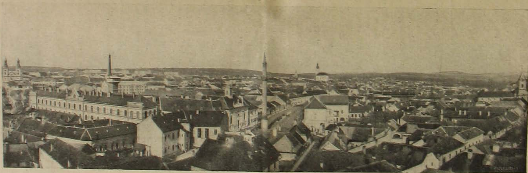
A török mecset az irgalmas rend kórházával.