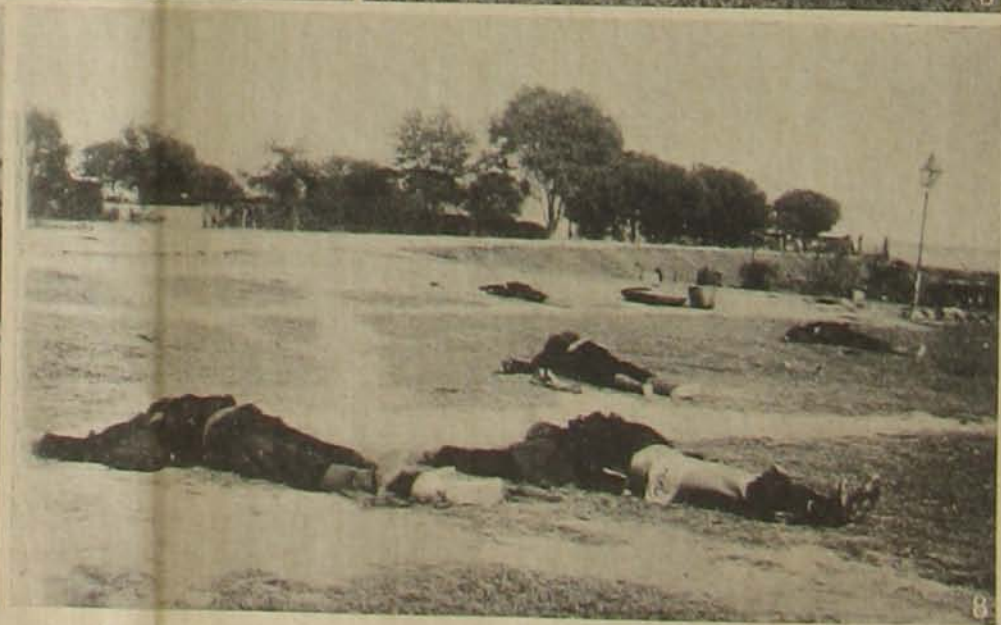
5. Katonai őrállomás. — 6. Gépfegyveresapat. — 7. Egy lázadó büntetése. — A forradalom áldozatai. A kínai forradalom színhelyéről.