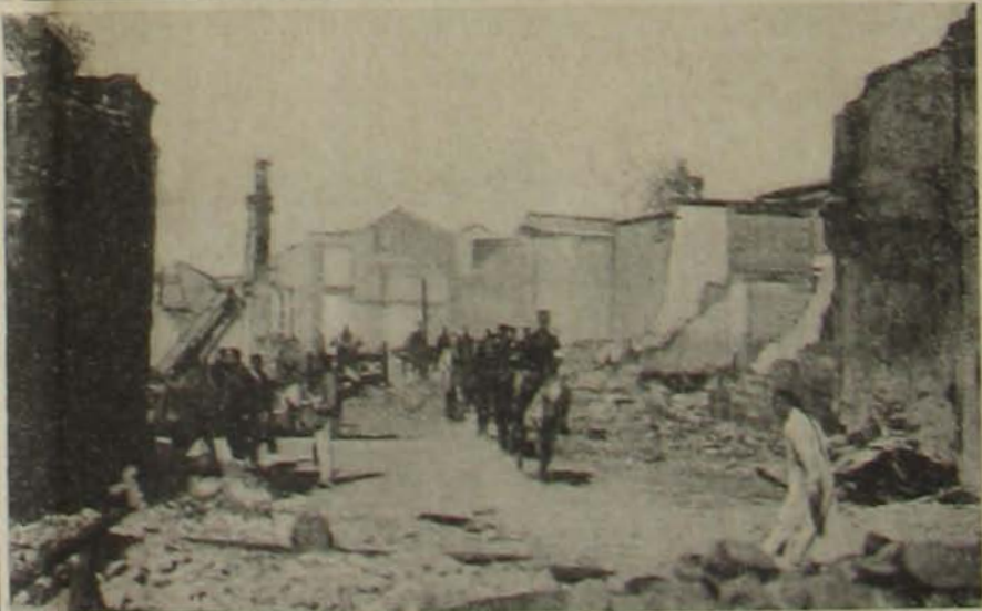
1. Peankau város égése. 2. Forradalmár csapat. — 3. Egy elfoglalt ágyú. — 4. Egy elpusztított város utcája. A kínai forradalom színhelyéről.