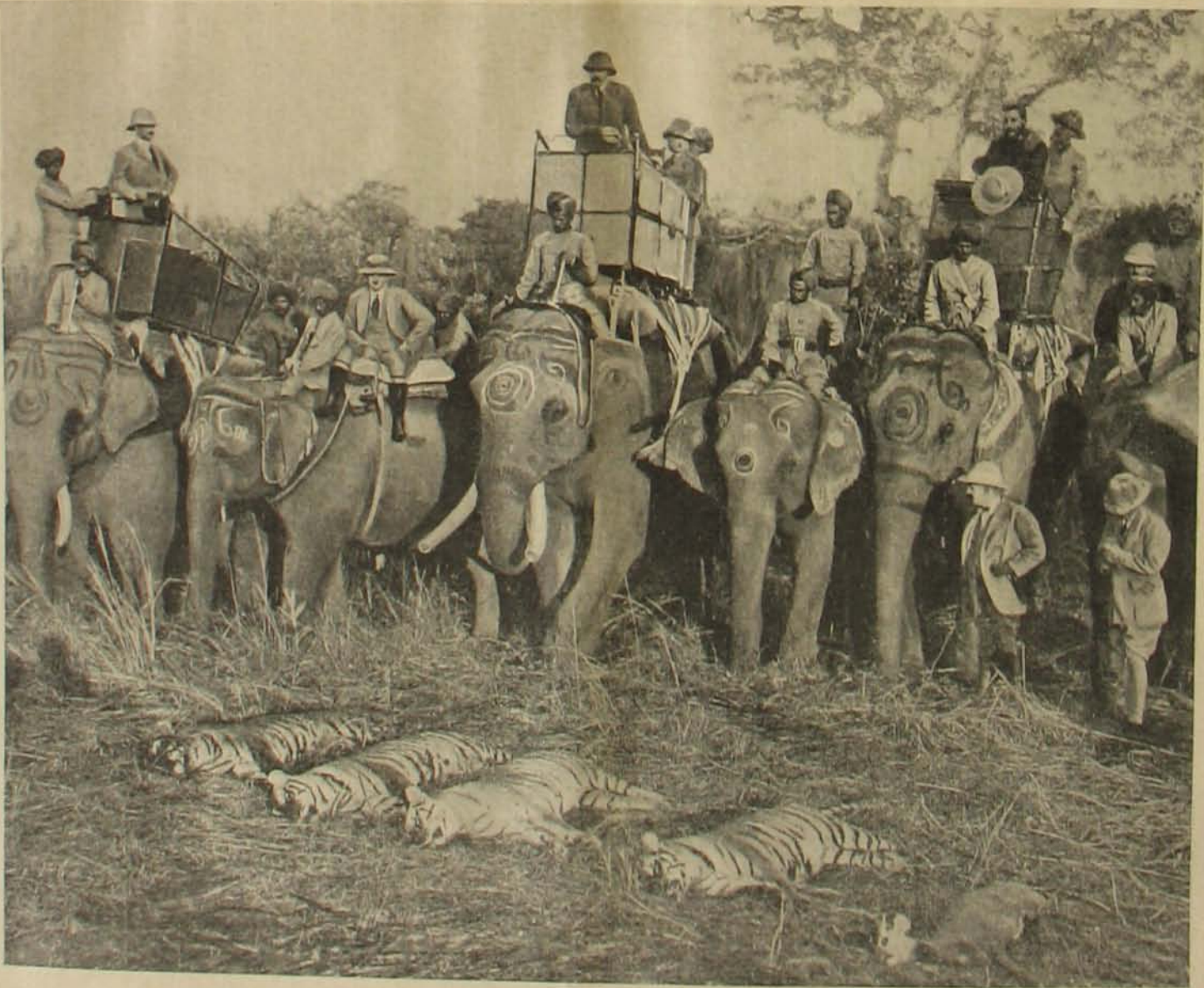
V. György angol király higrisvadászata Kelet-Indiában. — Vadász-zsákmány.