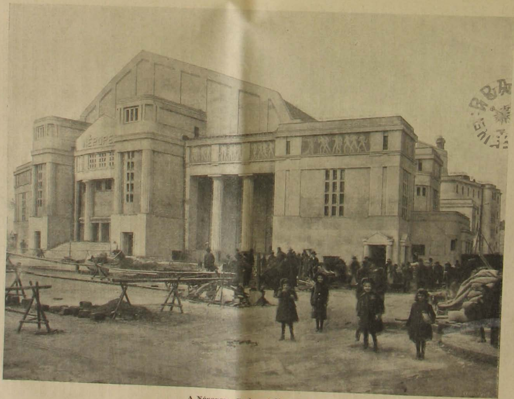
A Népopera, Budapest új színháza.