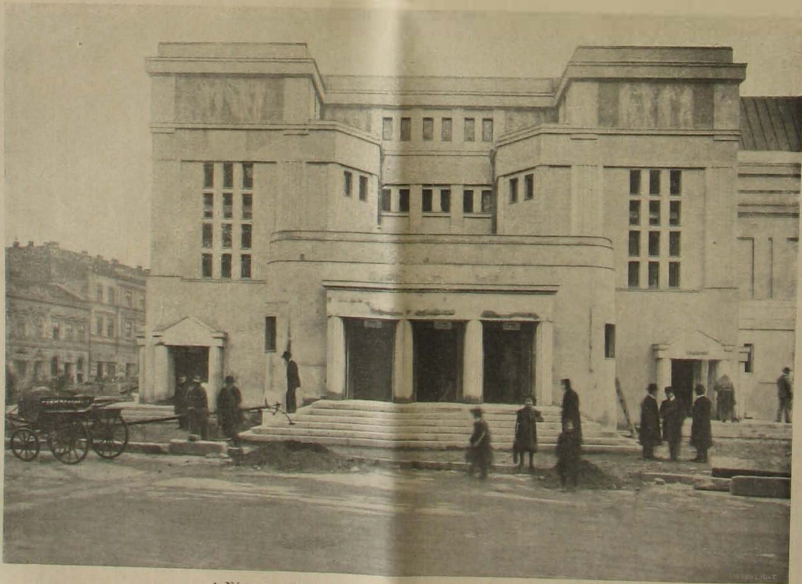
A Népopera, Budapest új színháza. — Az oldalhomlokzat részlete.