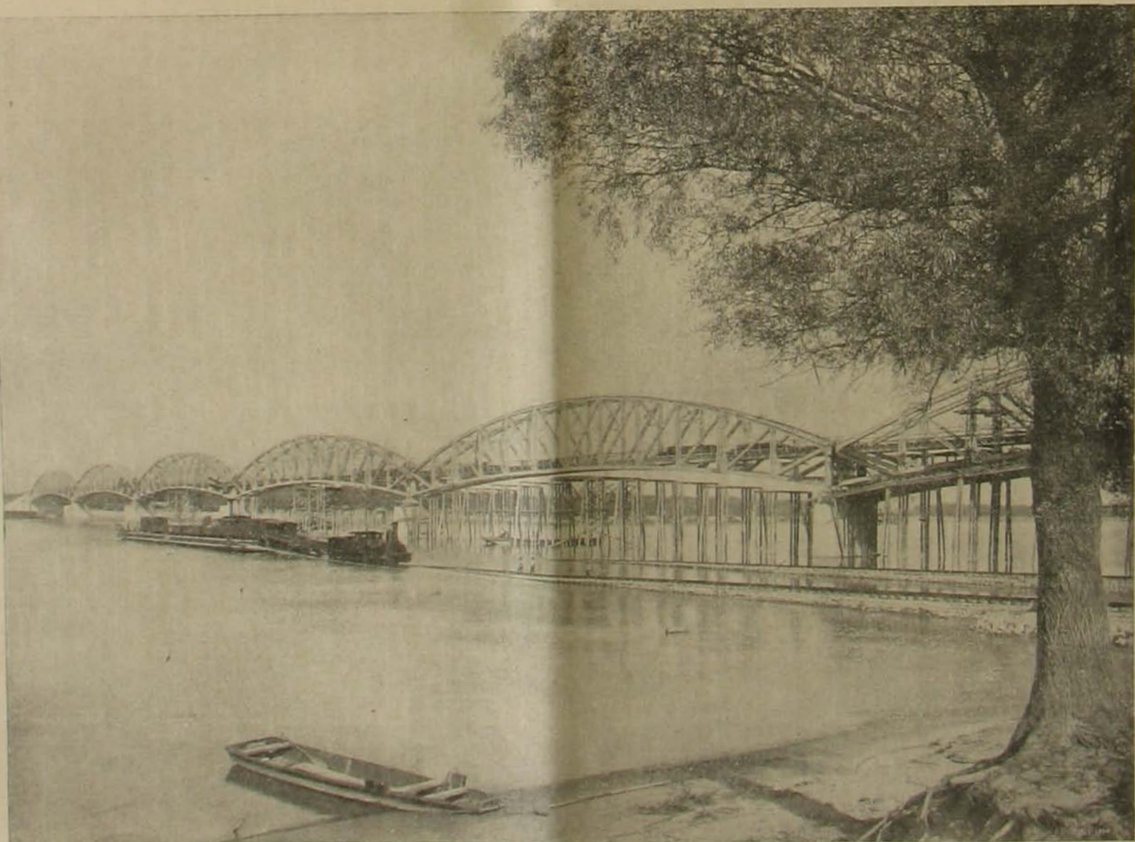
A gombos-erdőnél új vasúti Duna-híd. — Az új híd, mellette a régi gőzkomp.