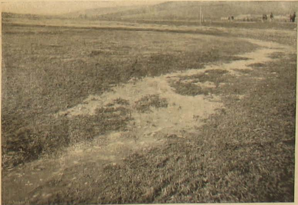
A földgáz bugyborékai.