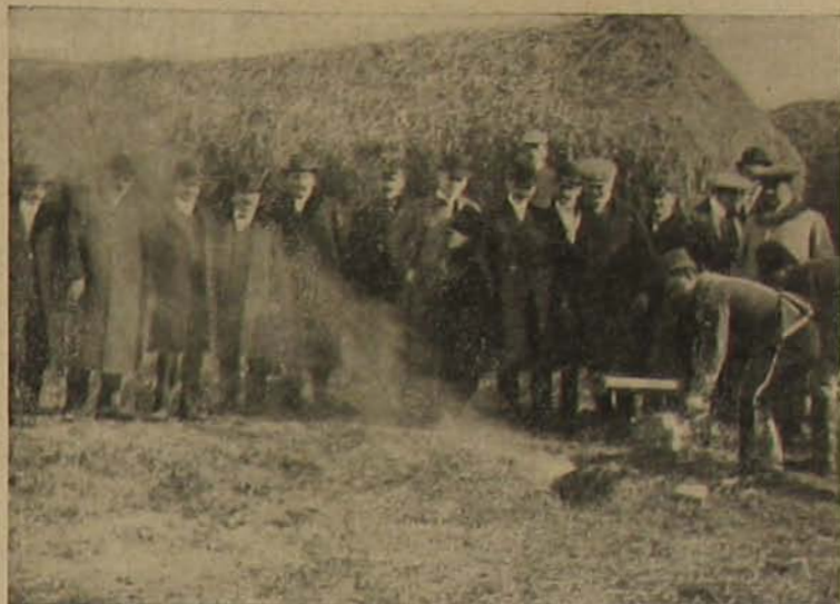
Égési kísérlet a gázzal.

Nem nagy terület ez a gáztartalmu föld és igazán