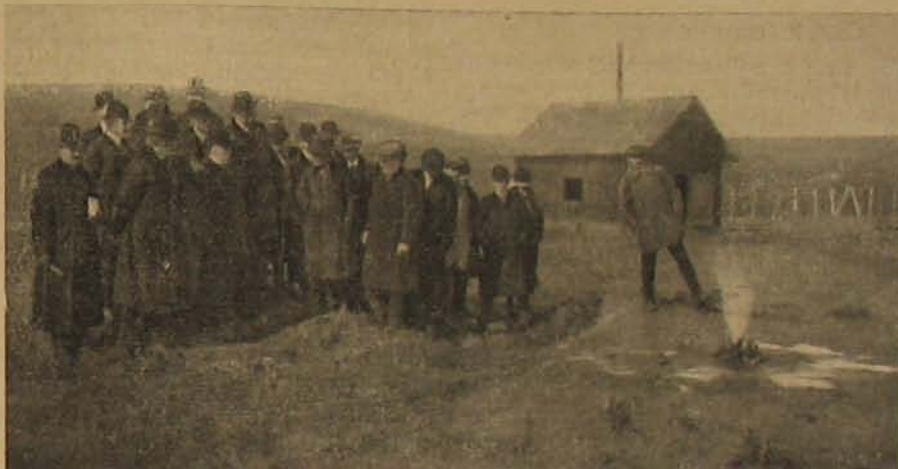
A kissármási gázkút. — A gáz a kút elzárásakor kibuggyyan a földből.

100. Mindennemű jelentkezést az őrsirodában kell teljesíteni. Ha az őrsparancsnok nincs jelen, akkor a helyettesnél jelentkeznek.