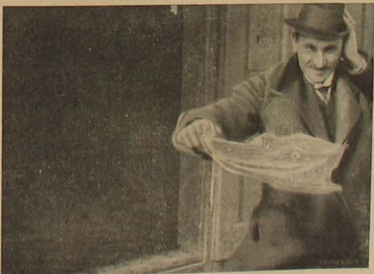
A kissármási gázkut. — A kítörülő gáz sodró erejének bemutatása.

Altiszti vizsga Nagyváradon. A nagyváradai továbbképző és altisztiiskola mostani altiszti tanfolyamainak záróvizsgája altorjai Altorjay Luce tábor-