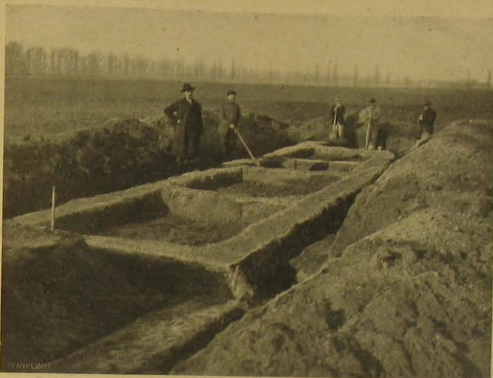
Ujjonnan felfedezett római temető Keszthelyen. — A római temető épületének alapfalai.

illetékes lakpénz. Rendszeresítve irodatiszti és irodaigazgatói állások, mely utóbbi állással 2600 kor. fizetés és szabályszerű lakpénz jár.