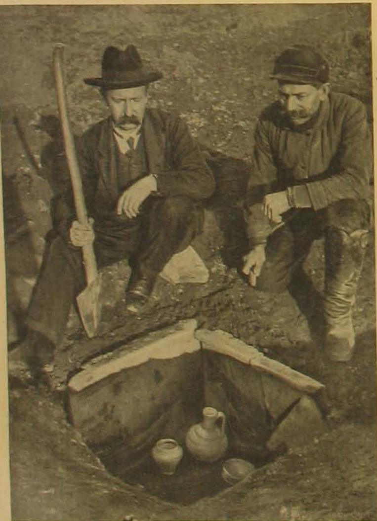
Római háztető-zsindelyvel kibélelt urna-sír.