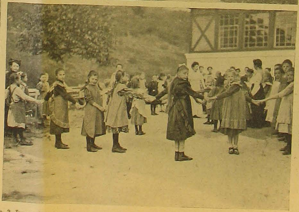
1. Uzsona-osztás. 2. A gyermektelep épülete. 3. Ima a délutáni pihenő után. 4. Kinn a bárány, benn a farkas, Gyermek szőlői nyaralása a szőlői gyermektelep egyesület zebegényi telepén.