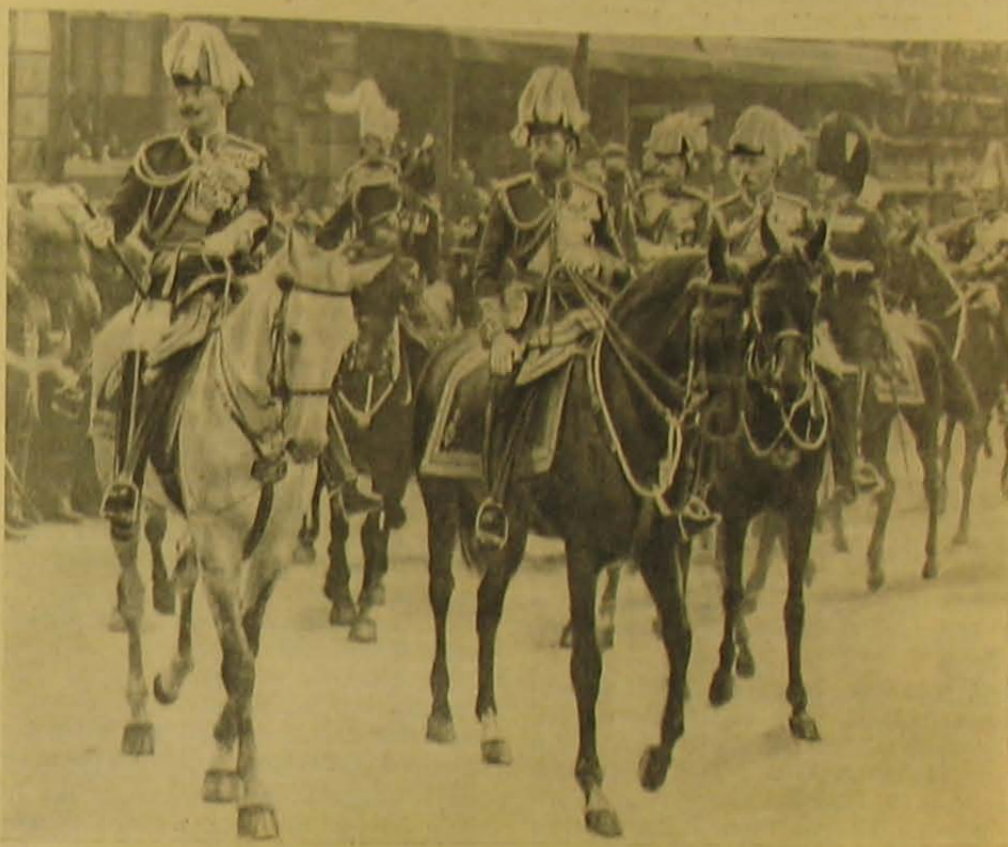
VII. Edvárd angol király temetése. — A német császár, V. György király és a connaughti hercege a menetben.