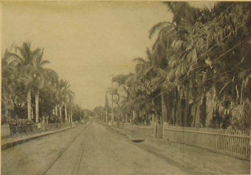
Honolulu egyik utcája.